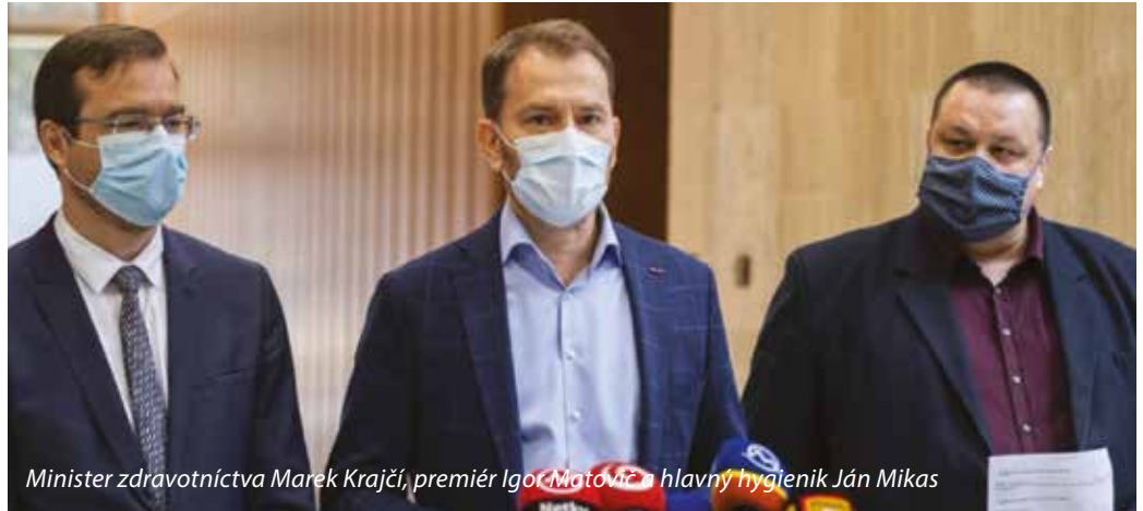
Minister zdravotníctva Marek Krajčí, premiér Igor Matovič a hlavný hygienik Ján Mikas

12. marca, keď bolo na Slovensku infikovaných len 16 osôb, premiér nariadil hraničné kontroly a zatvorenie medzinárodných letísk. Boli zakázané všetky masové podujatia. Pre osoby prichádzajúce zo zahraničia bola nariadená 14-dňová karanténa. Boli odložené všetky plánované operácie, v nemocniciach a sociálnych