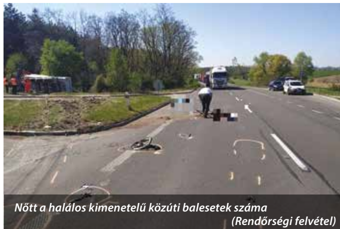
Nőtt a halálos kimenetelű közúti balesetek száma (Rendőrségi felvétel)

Az év eleje óta tizenöt ember halt meg az utakon Nagyszombat megyében. Áprilisban kilencen veszítették életüket közlekedési balesetben. Bár a jelenlegi időszakban a megszokottnál jóval kevesebb jármű közlekedik az utakon, az év kezdete óta 6-tal több