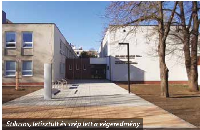
Stílusos, letisztult és szép lett a végeredmény

A munkák során felújították az épület homlokzatát, revitalizálták a zöldterület, kivágták az elöregedett bok-