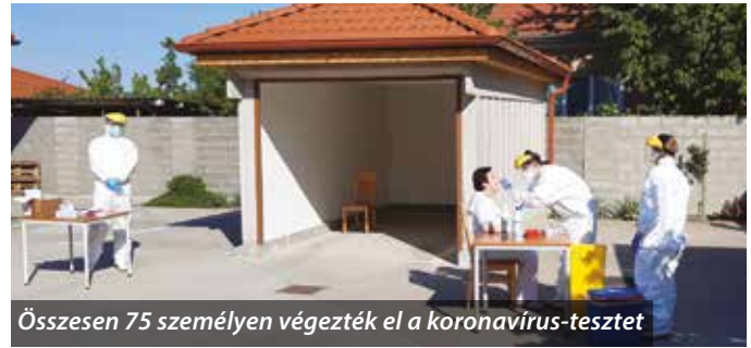
Összesen 75 személyen végezték el a koronavírus-tesztet

„Az intézmény kapuin belül továbbra is a legszigorúbb biztonsági intézkedések vannak érvényben, a bentlakók március hatodika óta nem