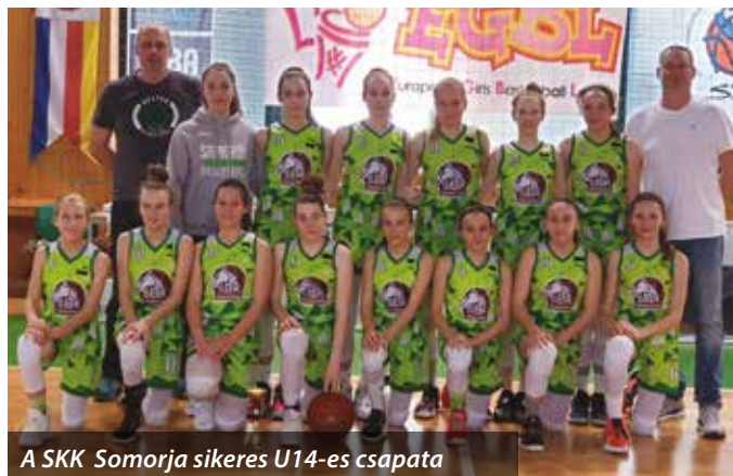
A SKK Somorja sikeres U14-es csapata