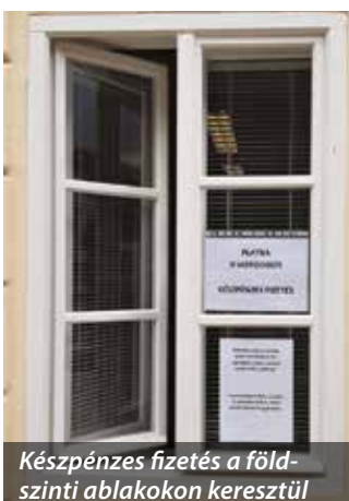
Készpénzes fizetés a földszinti ablakokon keresztül

A somorjai képviselőtestület legközelebbi ülése júniusban zajlik. (la)