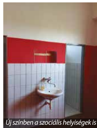
Új színben a szociális helyiségek is