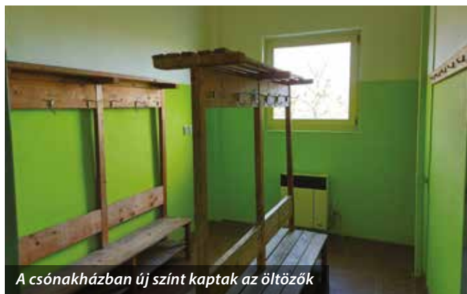
A csónakházban új színt kaptak az öltözők