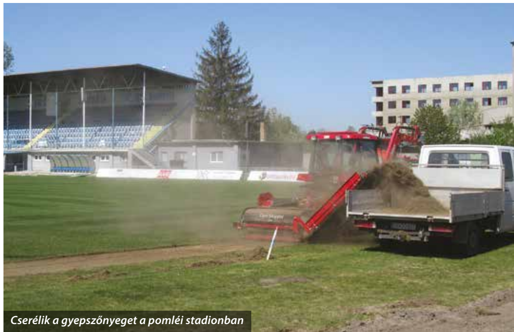
Cserélik a gyepszőnyeget a pomléi stadionban

Meccsek, versenyek ugyan nincsenek, és az edzések is csak nagyon korlátozva folynak, de a somorjai sportlétesítményeken nem állt meg az élet.