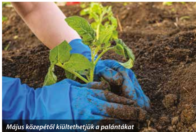
Május közepétől kiültethetjük a palántákat