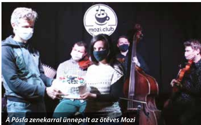
A Pósfá zenekarral ünnepelt az öt éves Mozi

Az idén 10 éves Pósfá zenekar élöben közvetített koncertjével ünnepelte ötödik születésnapját a ma már nemzetközi ismertségnek és elismertségnek örvendő Mozi Club.