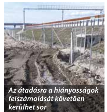
Az átadásra a hiányosságok felszámolását követően kerülhet sor

Az érintett szakaszon több olyan objektum is épült, amelyek Somorját közvetlenül érintik. Az egyik legfontosabb az Úszor irányába tervezett kerékpárút alagútja, a másik a gyorsforgalmi út déli oldalán megépített hangszigetelő fal. A somorjai önkormányzat elsősorban a kerékpáros alagút befejezetlen vízvezetését, a kerékpárút rácsatlakozásának hiányát, az autópálya mellett elhaladó kiszolgáló utak befejezetlen állapotát és a környék rekultivációjának hiányosságait, valamint a hangszigetelő falnak a kivitelező részéről történt önkényes lerövidítését kifogásolta, indítványozva az erről kidolgozott tanulmány pontosítását és újragondolását. Az úszori és a pakai önkormányzattal összehangolt fellépésnek köszönhetően sikerült elérni, hogy a hangszigetelő fal teljes egészében megépüljön.