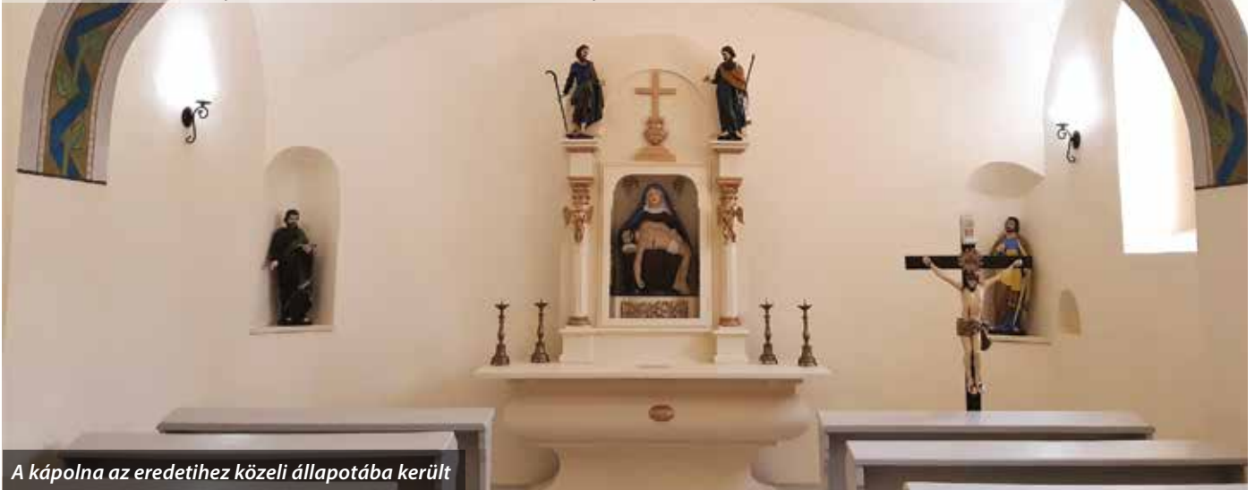
A kápolna az eredetihez közeli állapotába került