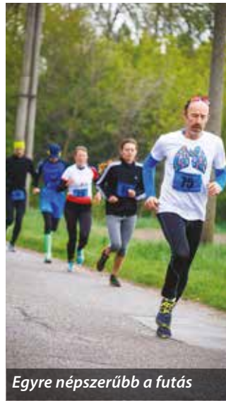
Egyre népszerűbb a futás