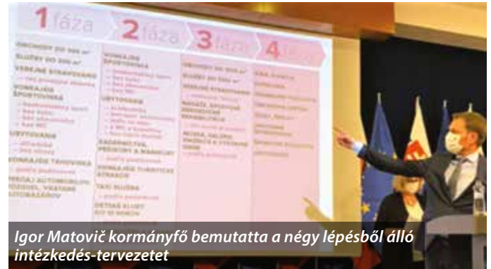
Igor Matovič kormányfő bemutatta a négy lépésből álló intézkedés-tervezetet

Május 2-től már nem ingyenes a közlekedés Nagyszombat megyében. Az Arriva Trnava, az SAD Dunajská Streda és a SKAND Skalica buszai továbbra is a megszokott menetrend szerint közlekednek, de már újra jegyet kell váltani rájuk. A megye körülbelül 400 ezer euróra becsülte a koronavírus járvány okozta eddigi kiesést, az utasok száma 80%-kal, körülbelül egymillió fővel csökkent a járvány kitörése óta. Az autóbuszokon nemsokára újra lehet készpénzzel fizetni a jegyért, a fuvarozók azonban azt