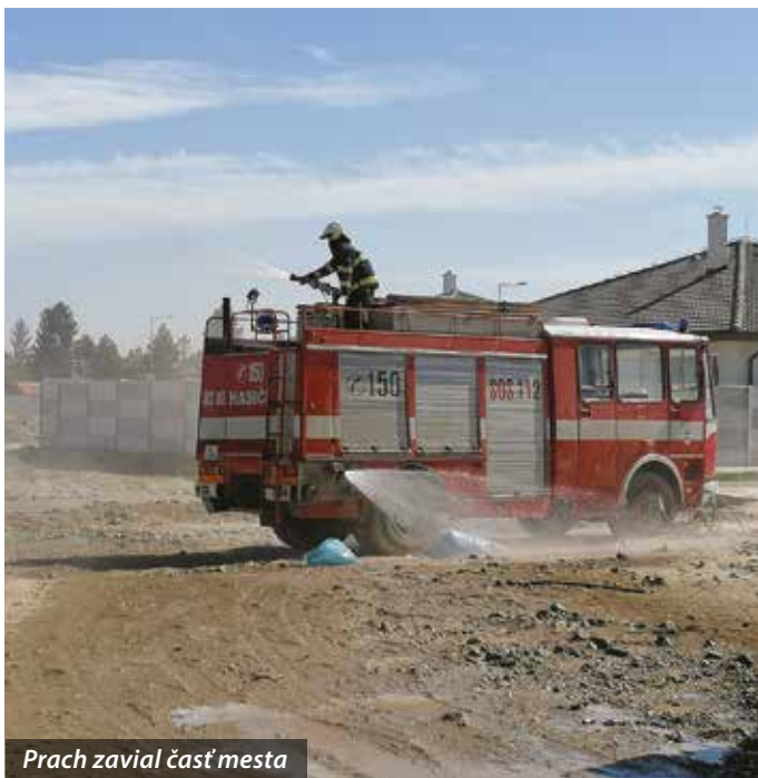
Prach zavial časť mesta

Členovia Dobrovoľného hasičského zboru Šamorín zasahovali 25. apríla na území obytného parku Labyrint, kde vplyvom silného vetra vznikla intenzívna prachová búrka. Jemný piesok aj prach zavial časť mesta, preto primátor