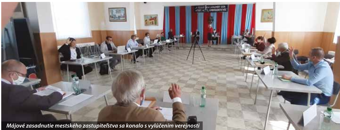
Májové zasadnutie mestského zastupiteľstva sa konalo s vylúčením verejnosti

Mestské zastupiteľstvo 5. mája rokovalo o otázkach, ktoré kvôli prvej zmene tohtoročného rozpočtu budú mať vplyv na všetky oblasti verejného života v Šamoríne. Zasadnutie sa pre preventívne opatrenia proti šíreniu koronavírusu konalo bez prítomnosti verejnosti.