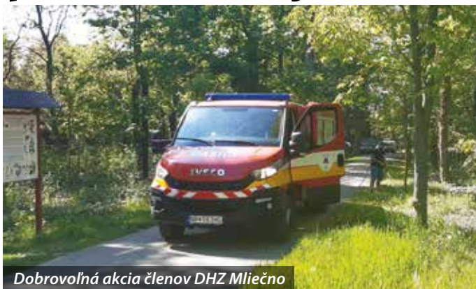
Dobrovolná akcia členov DHZ Mliečno

Členovia Dobrovoľného hasičského zboru v Mliečne vzhľadom na dlhotrvajúce sucho ponúkli vedeniu mesta, že sa postarajú o mladé stromy, ktoré boli v lesoparku Pomlé vysadené vlani. Vedenie mesta iniciatívu, prirodzene, privítalo a tak hasiči 28. apríla začali polievať mladé stromčeky. Naša samospráva získala vlani v projekte Podpora biodiverzity prvkami zelenej infraštruktúry