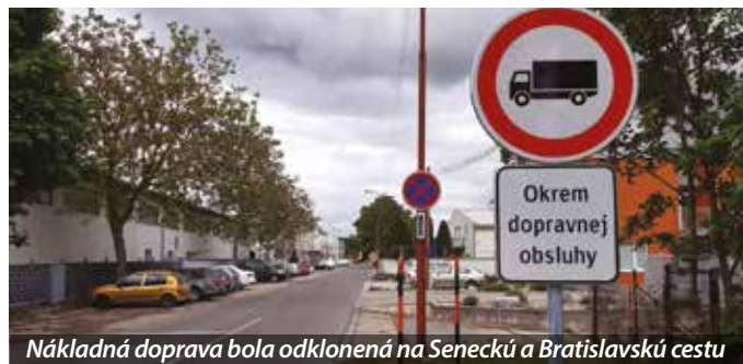
Nákladná doprava bola odklonená na Seneckú a Bratislavskú cestu

Samospráva Šamorína bola v týchto dňoch opäť nútená reorganizovať dopravu. Pre stavebné práce v obytnej zóne Labyrint bolo potrebné obmedziť nákladnú dopravu na Priemyselnej ulici smerom zo Seneckej ulice. Nákladné autá dodávateľov totiž spravidla chodili na stavenisko z Vinohradníckej ulice, no technické parametre a stav prípojnej