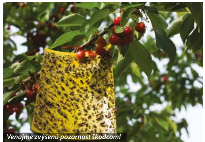
Venujme zvýšenú pozornosť škodcom!

Na ovocných stromov sa už vyvíjajú plody a stromy intenzívne ženú letorasty. V tomto období treba venovať zvýšenú pozornosť škodcom ako plodokaz jablčný, obalovač mramo-