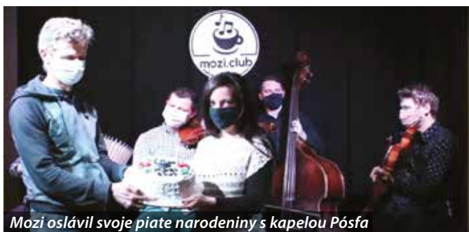
Mozi oslávil svoje piate narodeniny s kapelou Póšfa