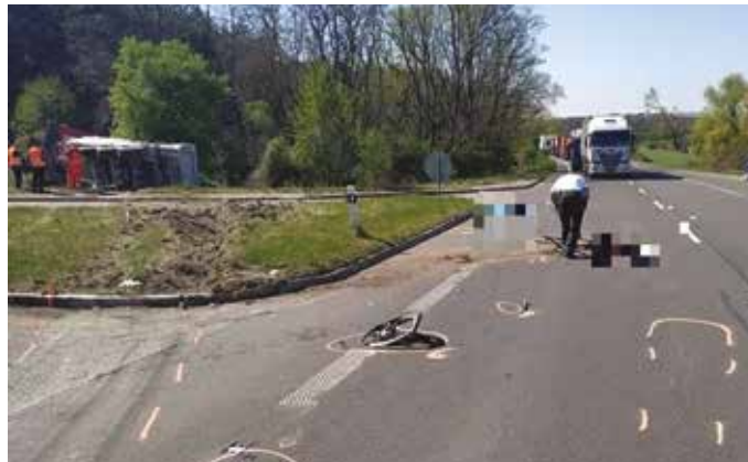
Na cestách zomrelo päť chodcov, traja cyklisti, jeden motocyklista, päť šoférov a jeden spolujazdec

Od začiatku roka zomrelo na cestách Trnavského kraja pätnásť ľudí. Len za mesiac apríl prišlo na cestách o život deväť osôb. Napriek výrazne zníženému počtu vozidiel na cestách je od začiatku roka o šesť mŕtvych viac ako vlani.