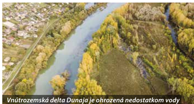
Vnútrozemská delta Dunaja je ohrozená nedostatkom vody

ramennej sústavy Dunaja; do jeho ramien, ktorými pred pár desaťročiami prechádzali kolísajúce prietoky rádo vo v stovkách m 3 s -1 , teraz tečie 20 až 30 m 3 s -1 . Pravidelné záplavy, ktoré boli prírodným javom v priemere viackrát do roka a zabezpečovali dynamický vývoj lužných ekosystémov, teraz úplne absentujú.