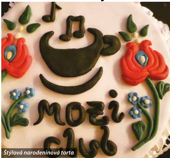
Štýlová narodeninová torta

Dnes už medzinárodne pre-slávený Mozi Club oslávil svoje piate narodeniny online prenosom koncertu desaťročnej kapely Póšfa.