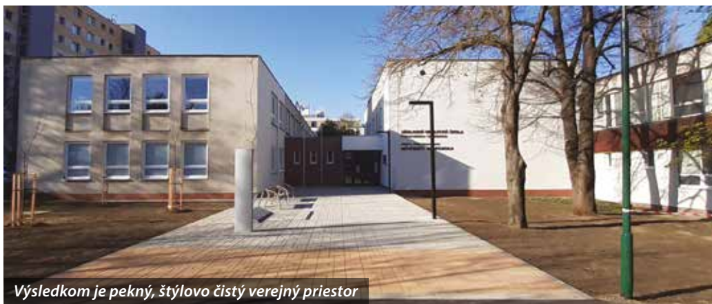
Výsledkom je pekný, štýlovo čistý verejný priestor

Obnovilo sa priečelie budovy, revitalizovala sa zelená plocha, vyrúbali sa staré kríky a vysadili sa nové stromy. Pred vchodom boli pôvodne tri schody, ktoré boli odstránené, aby bol vchod bezbariérový. Rozšíril