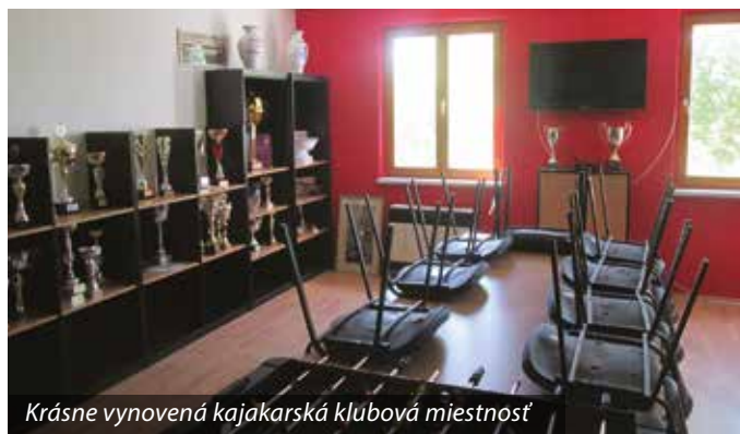
Krásne vynovená kajakárska klubová miestnosť

V šermiarskej hale v závislosti od epidemiologickej situácie plánujú namontovať rebriny a vymaľovať miestnosti. V športovej hale zápasníckeho klubu Gladiátor sa nainštaluje kvalitnejšie osvetlenie. Tibor Duducz