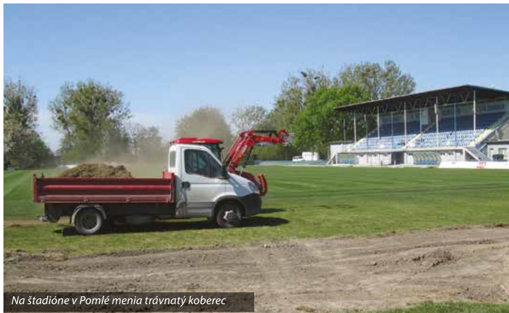
Na štadióne v Pomlé menia trávnatý koberec

Športovci síce v posledných týždňoch nemali zápasy a súťaže, a aj tréningy prebiehali v obmedzenom režime, no na šamorínskych športoviskách sa život nezastavil.