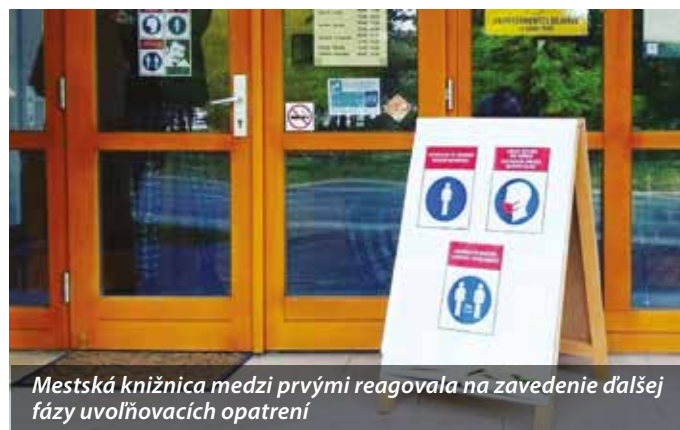
Mestská knižnica medzi prvými reagovala na zavedenie ďalšej fázy uvoľňovacích opatrení