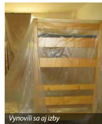
Vynovili sa aj izby