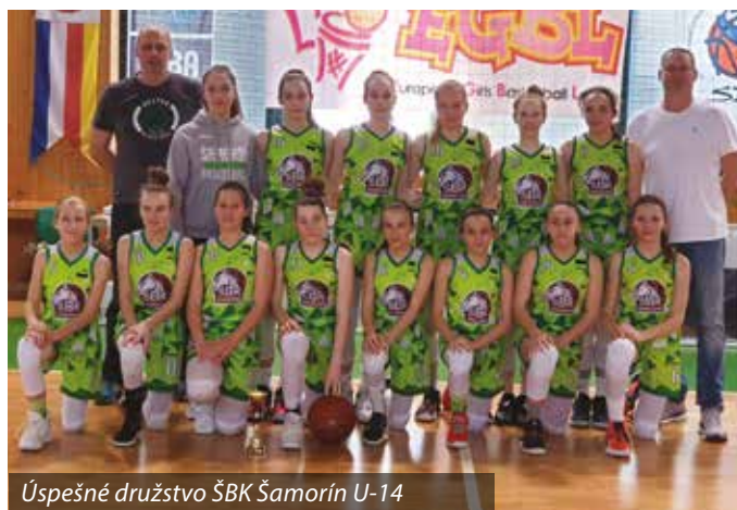
Úspešné družstvo ŠBK Šamorín U-14