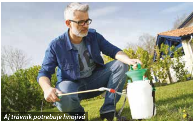
Aj trávnik potrebuje hnojivá