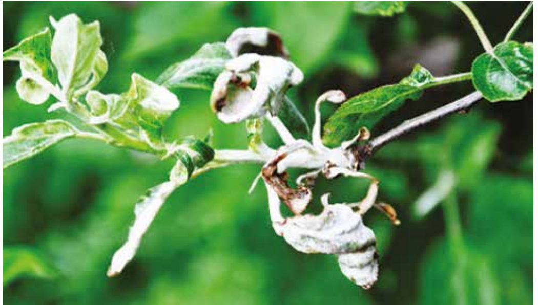
A lisztharmat az egyik leggyakoribb kártevő

Folytatjuk az alma és a szőlő gombabetegségek elleni védelmét. Az almafákat lisztharmat és varasodás ellen permetezzük (Kumulus, Thiovit Jet, Topas 100EC, ill. Syllit 65WP, Chorus 50WG, Qualy). A levéltetvek, illetve az almamoly ellen ajánlatos még hozzákeverni rovarirtót (Mospilan 20SP, Karate Zeon EC, Decis Protech, Marvick 2F) és tapadószerrel (Silwet). Ezen kívül az alma foltosságának elkerülése és az eltarthatóság céljából kalciumtartalmú levéltrágya