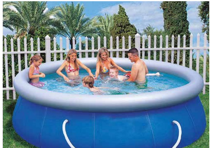
Fontos a víz Ph értékének beállítása