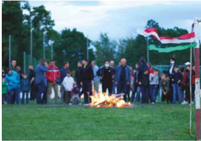
Tűzgyújtással emlékeztek a Corvin Mátyás Alapiskola udvarán