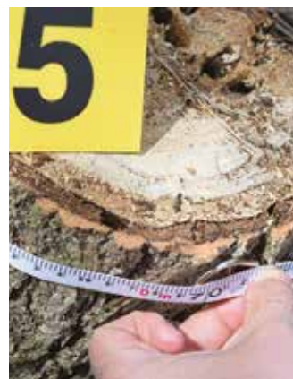
Környezetkárosítás miatt folyik eljárás