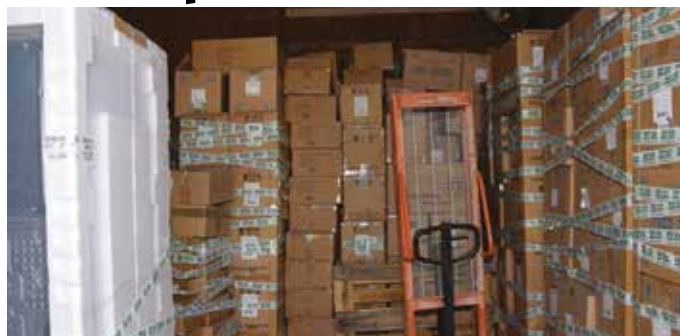
Jelentős kárt okoztak a betörők

Raktárakat tört fel és több ezer euró értékben lopott el árut két tettes, a rendőrség elfogta őket és az eltulajdonított tárgyakat visszaadta a tulajdonosoknak.