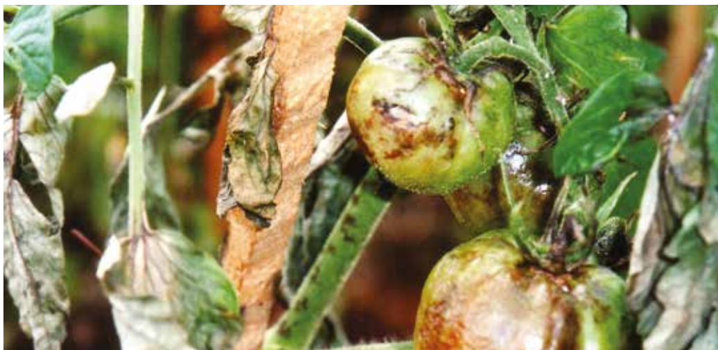
A fitoftóra a paradicsom legveszélyesebb betegsége

Az augusztus az új eperplánták telepítésének időszaka. Gondosan előkészítjük a talajt, felássuk, illetve jól fellazítjuk. Ezután megtrágyazzuk komposzt, illetve granulált tehéntrágya hozzáadásával. Az eperágyás letakarására fekete fátyolfólia használata ajánlott, amely védelmet nyújt a gyomok ellen és a termések nem sávozódik be.