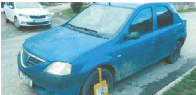
A lebilincselt jármű

Szabálytalanul parkolt egy Dacia Logan Nagymenyeren, ezért a városi rendőrség kerékbilincset helyezett az autó kerekére. A tulajdonos, ahelyett, hogy kifizette volna a bírságot és a városi rendőrökkel vetette volna le a bilincset, maga oldotta meg a problémát. Leszerelte a kereket a