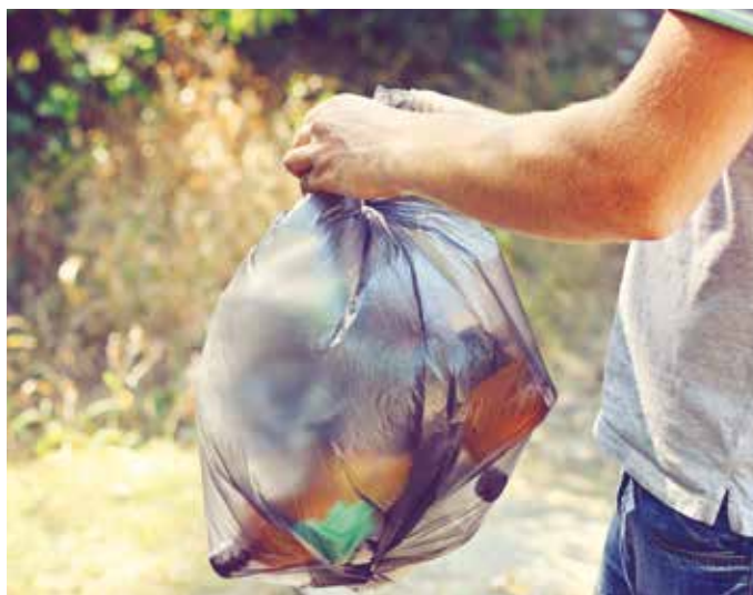
Tömörítve, összepréselve több fér a zacskóba

A módosított hulladéktörvény alapján a biológiailag lebomló háztartási hulladék gyűjtéséért és kezeléséért 2021. január 1-jétől az önkormányzat felel. A biológiailag lebomló háztartási hulladék gyűjtését és kezelését a hulladékdíj összegéből a település finanszírozza.