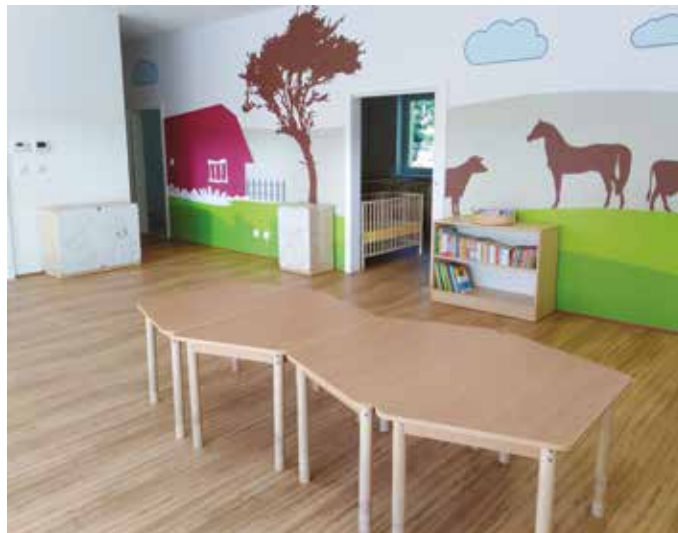
Helyére került a berendezés

A tavaly májusi alapkölvetétel napjától máig elvégzett beruházás a Kárpát-medencei Óvodafejlesztési Program keretében, és a Bethlen Gábor Alapkezelő Zrt. támogatásával valósult meg. (s)