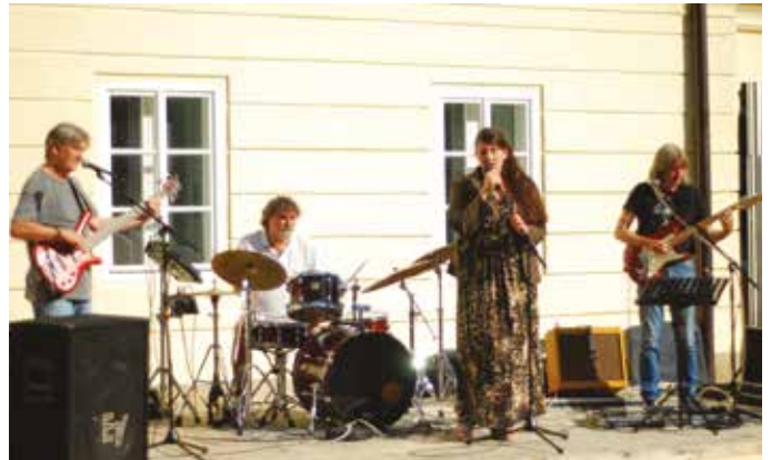
A térzenét hozta vissza a város központjába a Deja vu

évfordulóhoz érkeztek. Remélhetőleg legkésőbb az ősze visszaáll a régi rend, és újra szerveznek kulturális rendezvényeket. Idén 20 éve annak, hogy felmerült a Deja vu-klubestek ötlete. „Ezeket a főleg diákság körében kedvelt rendezvényeket annak idején a Pozsonyi Magyar Intézettel közösen indítottuk el. Az évforduló alkalmából az intézet megbízásából egy kiadványon dolgozom, amelyben igyekszem összefoglalni az elmúlt húsz évet, amikor felléptünk Somló Tamással, Hernády Judittal, Geszti Péterrel, Somával, Lovasi Andrással, Horváth Charlieval és még hosszan sorolhatnám. A kötet bemutatója Pozsonyban lesz, illusztris magyarországi vendégfellépőkkel. A tájoló klubestjeinket is folytatjuk. Bár fix dátumok