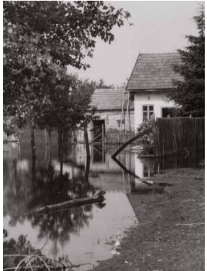
Az árvíz során sok építmény megrongálódott

Június 25-én, amikor az emberek azt hitték, a nehezen már túl vannak, a víz áttörte a gátat Gútánál. Csaknem egy hónapig harcoltak az árral. Az árvízvédelmi bizottság csak július 8-án jelentette be, hogy elmúlt a veszély. Megkezdődhetett a károk helyreállítása. Egész Csehszlovákia a katasztrófa sújtotta Csallóköz segítségére sietett.