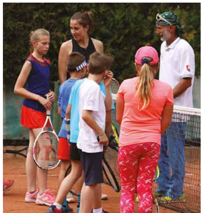
A gyerekek jelentik számára a legnagyobb hajtóerőt