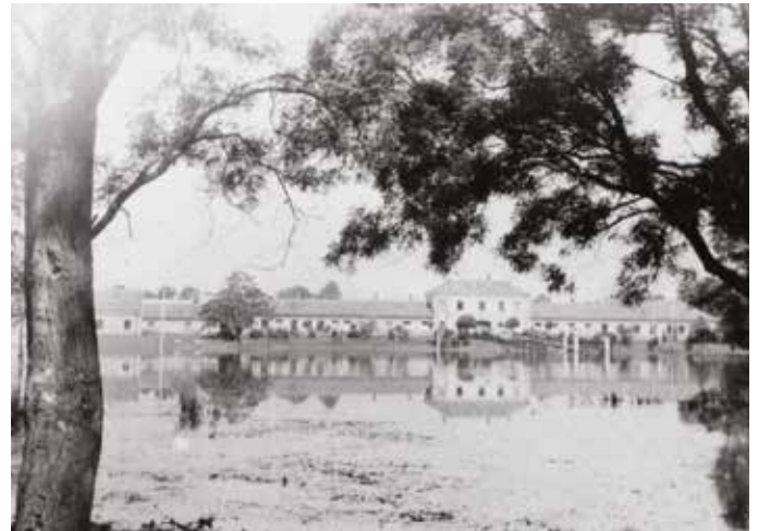
Víz alá került az egykori méntelep előtti tér is