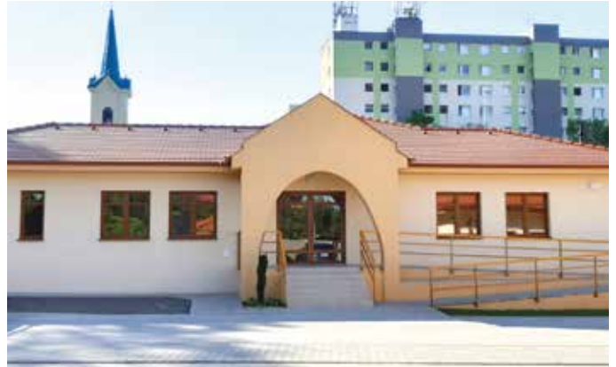
Tizenhat személyt lesz képes befogadni az új pavilon

Az új épületszárny akadálymentes és klimatizált, ami kényelmesebbé teszi a lakók életét, de nagymértékben megkönnyíti majd a személyzet