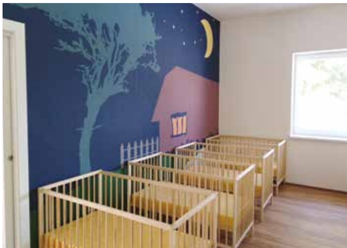
A város első bölcsődéjének hálóterme

A Somorjai Önkéntes Tűzoltó Testületnek ez a negyedik bevett járműve, felújítására eddig mintegy négyezer eurót költöttek. Az egész országban mindössze öt ilyen jármű áll az önkéntes tűzoltóság szolgálatában.