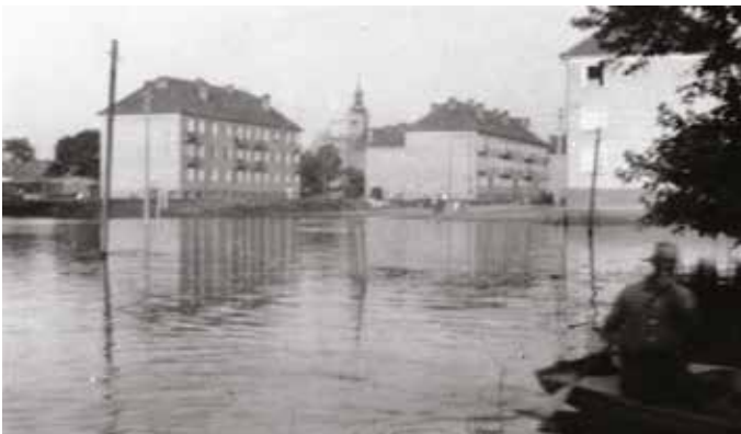
Mintegy 1,1 milliárd köbméter víz zúdult 1965-ben a Csallóközre