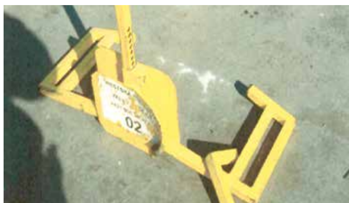
Egyszerűnek tűnt a megoldás

papuccsal együtt, felszerelte a pótkereket, majd egy közeli autójavító műhelybe vitte és lefűrészelte a kerékről a kerékbilincset. Ezzel 160 eurós kárt okozott a városi rendőrségnek. A nyomozó hivatalos személy elleni támadás miatt indított büntetőeljárást a 39 éves férfi ellen.