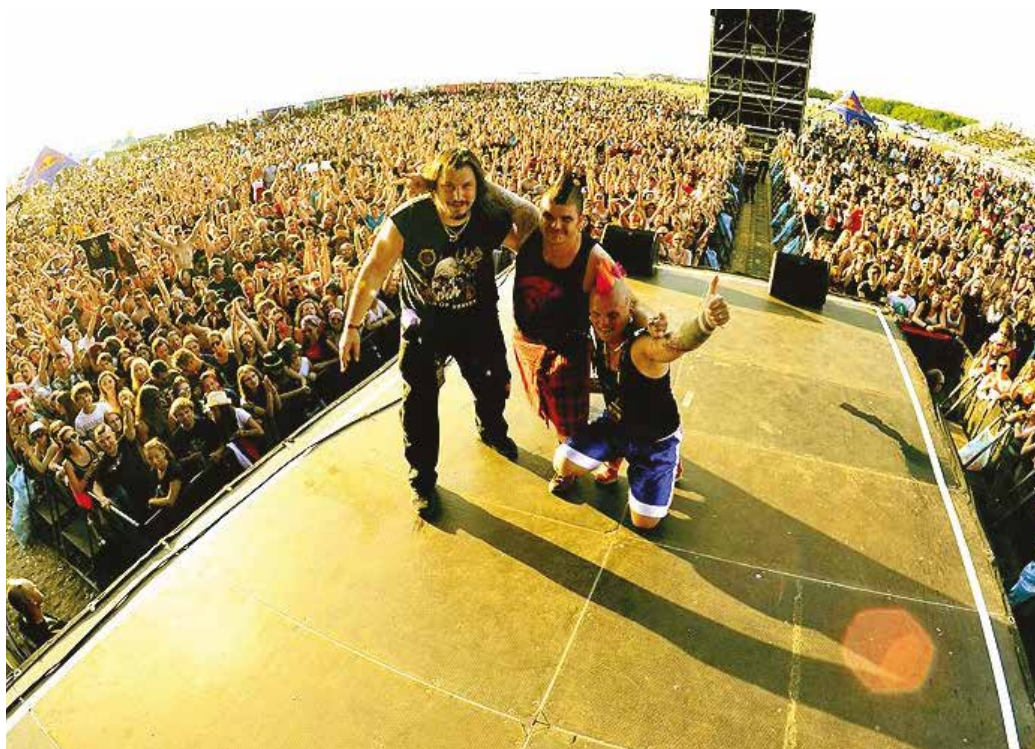
Sikeres koncert után, a Topfest-en

Körülbelül száz. Rengeteg felkérésünk volt távolabbi helyszínekről is, Kolumbiától egészen Moszkváig. De mivel évekig annyira be voltunk táblázva, hogy hosszabb utakat nem