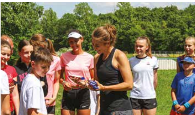
Belinda Bencic látogatását nagy érdeklődés övezte