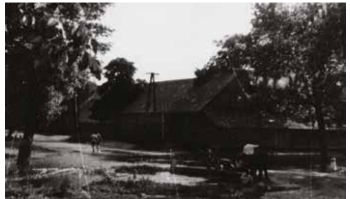
A Csölösztői út elejét is elborította az ár