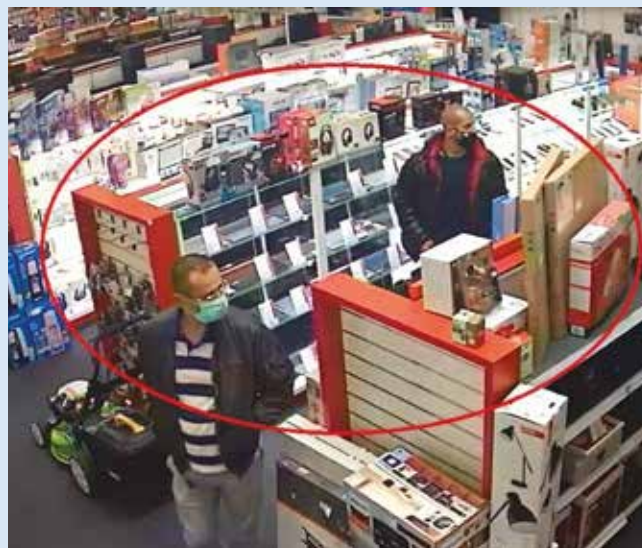
Ha felismerik őket, hívják a rendőrséget

fekete kapucnis kabátban tűnik fel, 30-35 éves lehet. Tettestársai többen lehetnek. A szürke nadrágos, fehér tornacipős, fekete kabátos férfi körülbelül 180 cm magas, míg a piros pulóveres 30-35 éves lehet, sötétebb bőrtónussal. Ha felismerik őket, jelezék azt privát üzenetben a Facebook-on a Políciának SR-Trnavský kraj felhasználónak, vagy hívják a 158-as telefonszámot.