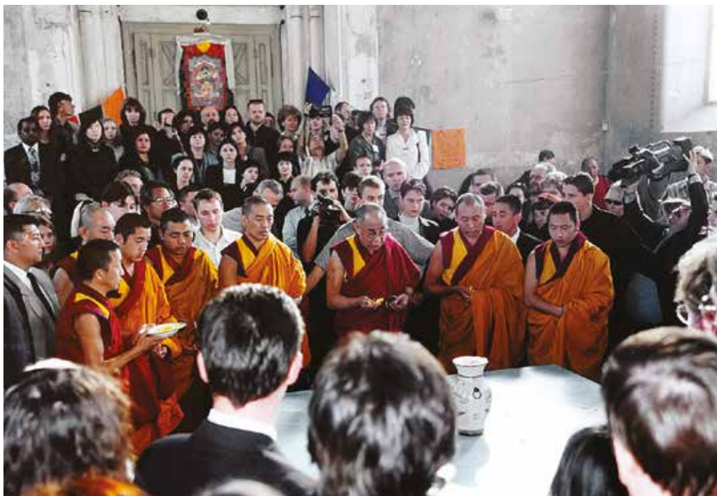
Őszentsége a XIV. Dalai Láma az egykori zsinagógában

zsinagógát, feléled a szelleme is. A belső tér, amely több mint 50 év után újra megnyílt, már önmagában is kiállítás” – mondta Kiss Suzanne.