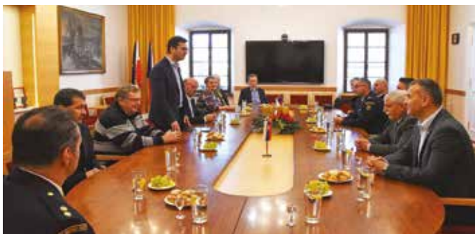
Somorja és a helyi önkéntes tűzoltó testületek küldöttsége 2019 novemberében Uherský Brod-ba látogatott