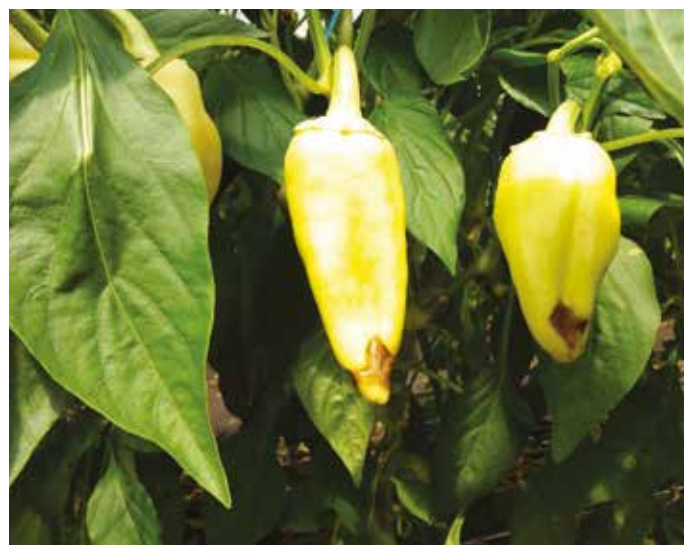
A paprika foltosodását a kalciumhiány okozhatja

és utána is elvégezni, hogy minimalizáljuk a fertőzés kialakulását. A fent említett Sanium Ultra a közkedvelt Decis Protech rovarölőszer utódja, amely új néven kerül forgalomba. Nagy kárt okozhatnak a káposztafélékben előforduló levélbolhák, levéltetvek és az üvegházi molytetű (lisztec-