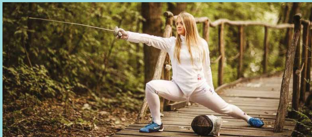
Hat éves kora óta vív