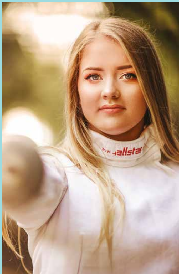
Ciel' je jasný: dostať sa na olympiádu