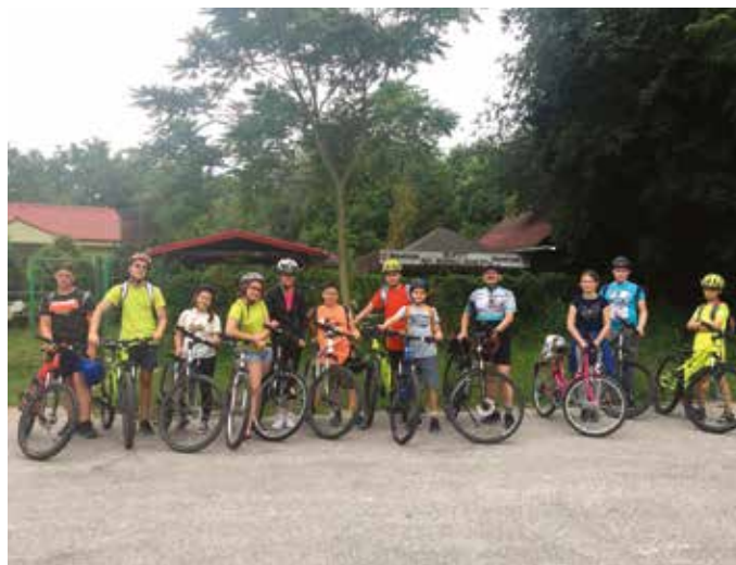
Unavení, ale šťastní

Už tradične sa chodí koncom školského roka na triedny výlet. Nebolo tomu inak ani tento rok.