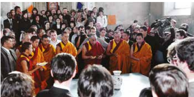
Prvá návšteva Jeho Svätosti XIV. Dalajlámu na Slovensku