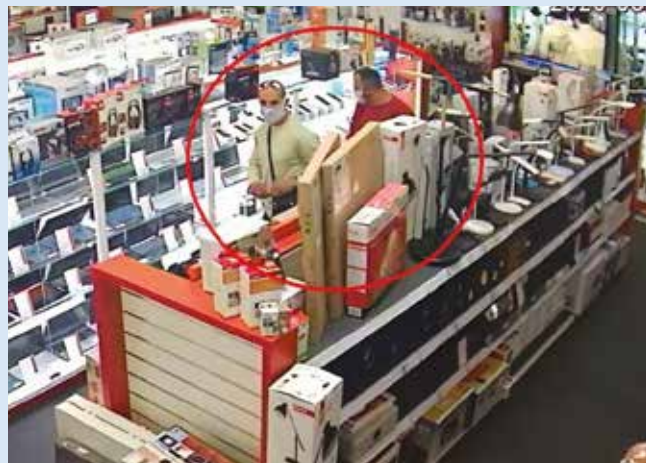
Ak ich spoznáte, volajte polícii

Ak Vám muži na fotkách niečo hovoria, napíšte polícii do súkromnej správy Polícia SR -Trnavský kraj alebo zavolajte na linku 158.