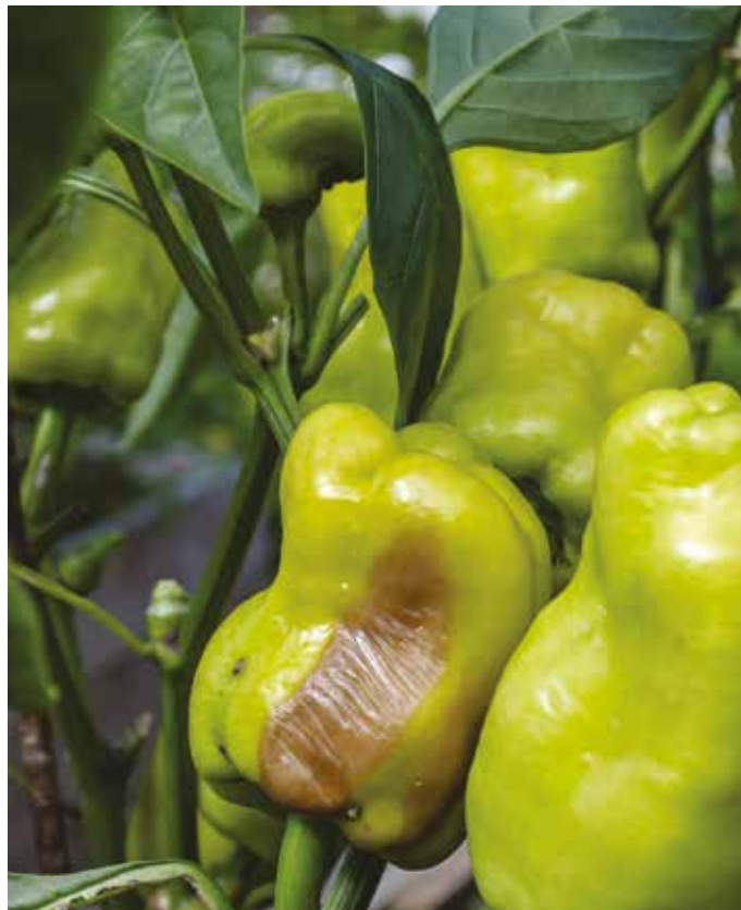
Hnedé flaky na paprike svedčia o nedostatku vápnika

Na paprike sa aj tento rok často objavujú hnedé flaky. Môže to byť spôsobené nedostatkom vápnika. Problém sa dá riešiť použitím tekutého hnojiva s obsahom vápnika, napríklad pomocou Kalcidolu alebo Wuxal Ca. Táto nedostatková choroba je častá aj u paradajok, kde tiež postupujeme podobne. Paprika počas zrenia potrebuje viac dusíka a v prípade paradajok môžeme proces dozrievania urýchliť draslíkom. V rámci starostlivosti o papriky a paradajky musíme okrem vošiek venovať zvýšenú pozornosť aj roztočom. Tieto nepatrné a voľným okom neviditeľné parazity sa často usadia na listoch papriky a zabraňujú ďalšiemu vývinu rastliny. Proti nim môžeme použiť akaricíd s názvom Vertimec. Najnebezpečnejšou chorobou paradajok je fytoftóra. Najprv napadne spodné listy, na ktorých sa objavia žltohnedé flaky. Choroba sa postupne rozširuje aj na plody a okolo stopky sa vytvo-