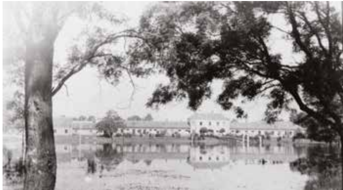
Aj námestie pred bývalým plemenárskym podnikom bolo zaplavené

Po roztrhnutí hrádze v Čičove sa voda liala smerom na Medvedov, Sap, Nárad, Pataš, Okoč, Šrobárovú, Čalovec, Opatovský Sokolec, Zemiansku Olču, Zlatnú na Ostrove, od Patiniec zas smerom na Komárno, Moču a Kolárovo. Voda obklopila Bodzu a Tõň. Zemiansku Olču, Holiare, Čičov a Čiližskú Radvaň museli evakuovať. Do Komárna sa dalo priblížiť