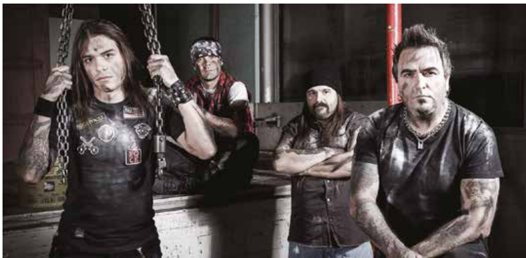
Kapela vydá v októbri nový album

Dosť nás kvôli tomu bolela hlava. Ale situácia, ktorá vznikla v dôsledku koronavírusu, zložila celú hudobnú scénu. Plán bol taký, že takmer celý rok budeme koncertovať, mali sme zjednaných skoro 70 akcií a v tomto prakticky neboli zahrnuté ani letné festivaly. Ak nerátame tie dva-tri koncerty v januári, na pódium sa prvýkrát postavíme 5. augusta. Ale táto situácia mala aj svoje pozitíva, takto sme mohli v klude pracovať v štúdiu na skladbách nového albumu. Chalanom som aj