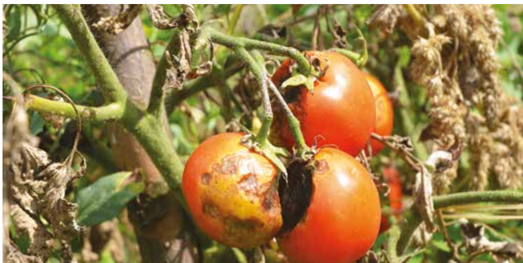
Fytoftóra dokáže zničiť úrodu paradajok zo dňa na deň

Na kapustovitých rastlinách spôsobujú veľké škody skočky, vošky a molice skleníkové. Proti nim bojujeme insekticídmi Karate Zeon, Sanium Ultra a Neemazal TS. Je dôležité prmiešať do postrekov aj zmáčadlo (Silwet Star alebo Agrovital). Koncom júna začíname s ochranou proti vrtivke orechovej, ktorá v posledných rokoch spôsobila obrovské škody. Orechy striekame 3-4 krát so striedaním prípravkov Sanium ultra a Mospilan 20 SP.