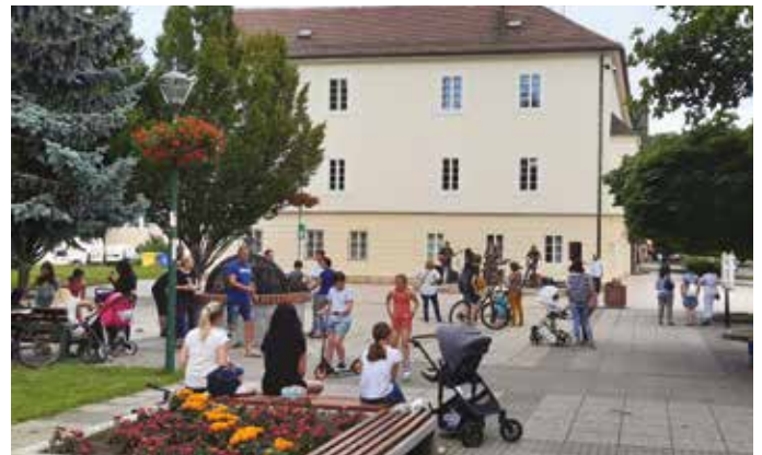
Po dlhej prestávke opäť na pódiu

kolají a znovu sa začnú orga-nizovať kultúrne podujatia. Tento rok je tomu 20 rokov ako nám napadlo organizovať klubové večierky. „Tieto podu-jatia, ktoré obľubujú najmä študenti, sme kedysi začali robiť v spolupráci s Maďar-ským inštitútom v Bratislave. Pri tomto výročí pracujem na poverenie inštitútu na jednej publikácii, v ktorej sa snažím spracovať uplynulých dvadsať rokov – keď sme vystupovali s Tamášom Somlóm, Juditou Hernádi, Péterom Gesztim, Somou, Andrásom Lovasim, Charliem Horváthom a mohol by som ešte dlho pokračovať. Prezentácia knihy bude v Brati-slave so znamenitými hosťami z Maďarska. Pokračujeme aj v našich klubových večierkoch. I