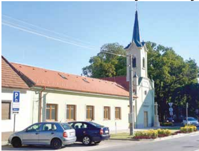
V novom pavilóne bude miesto pre 16 ľudí

Začiatkom leta bola dokončená výstavba nového pavilónu Domova seniorov Ambrózia. Odovzdanie modernej budovy odsunulo mestské zastupiteľstvo na január 2022.