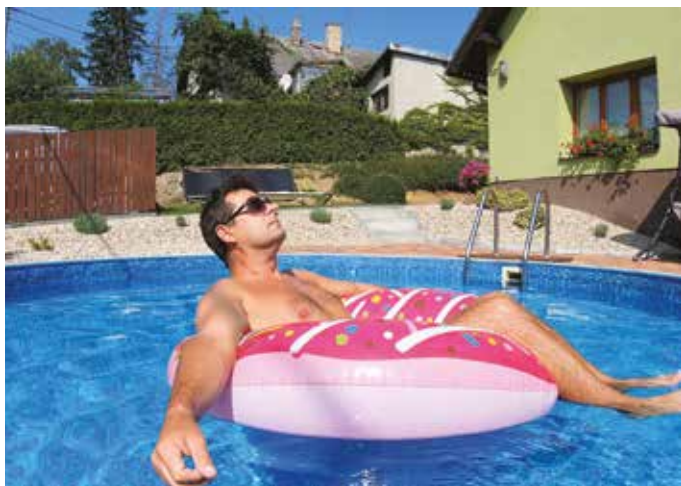
Domáci bazén vyžaduje pravidelnú starostlivosť