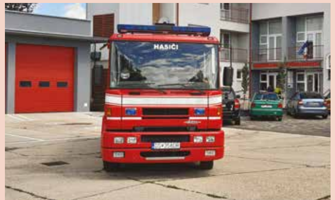
Dennis Sabre bol považovaný za Rolls-Royce hasičských vozidiel