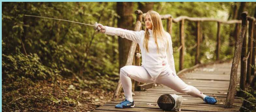
Šermu sa venuje od svojich šiestich rokov