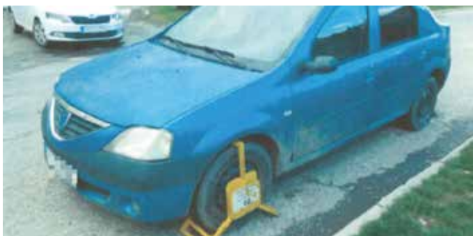
Vozidlo zablokované mestskými policajtmí

Vodič Dacie Logan parkoval v meste Veľký Meder v protismere. Mestská polícia mu za priestupok nasadila blokovacie zariadenie, tzv. papuču. Namiesto toho, aby majiteľ auta zaplatil pokutu a odstránenie „papučy“ riešil s mestskými policajtmí, problém vyriešil po svojom. Odmontoval celé kole-