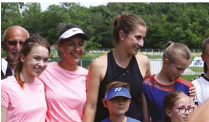
Deti sú pre ňu najväčšou hnacou silou