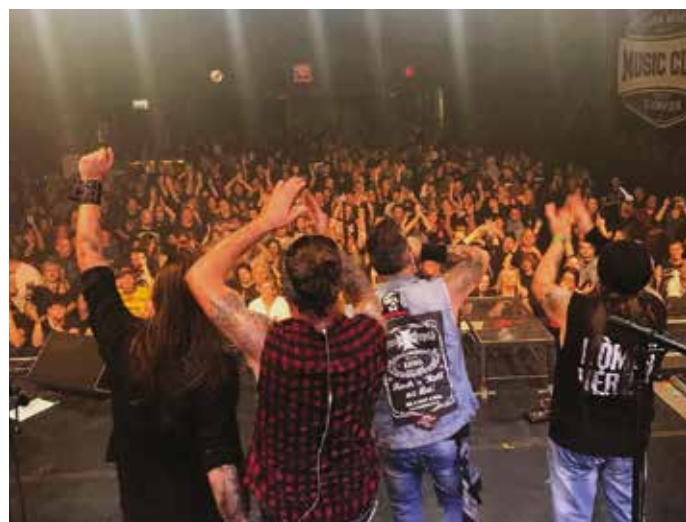
Rómeó Vérzik zostáva šamorínskou kapelou navždy

neho domu, ale u mňa v pivnici. Takto to bolo pohodlnejšie, jednoduchšie. Ale Rómeó Vérzik zostáva šamorínskou kapelou navždy. Takto nás ľudia spoznali a nechceme na tom nič meniť. Skladba A három je tiež o tejto téme. Obecenstvo aj na veľkom októbrovom koncerte pozdravím tak, že „na javisku je šamorínsky Rómeó Vérzik!“