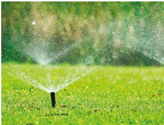
Trávnik polievajme zriedkavejšie, ale s väčším množstvom vody

me večer, tak zostane mokrá až do rána a takto vytvárame podmienky pre vznik hubových ochorení. Nezabudnime ani na umelé hnojivo. Po pohnojení je potrebné trávnik poriadne zaliať.