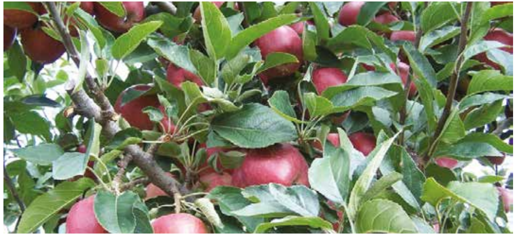
A kései fajták szeptembertől szedhetők

Az almát napos, világos helyre ültessük. Legjobban a vályogos kötöttségű, tápanyagban gazdag talajt kedveli, viszonylag nagy a vízigénye, ezért öntözni kell. A vásárlásnál figyeljünk az alanyra, amely a gyökérzetet