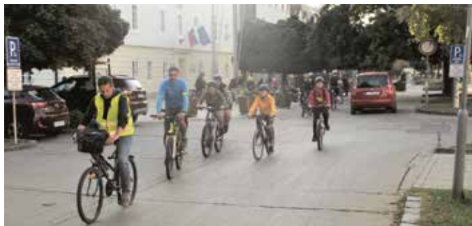
A kerékpáros közlekedés fontosságára is felhívták a figyelmet

Szeptember 16-án rajtolt és 22-én ért véget az Európai Mobilitás Hete, amely a környezetbarát, elsősorban a kerékpáros és a gyalogos közlekedés, illetve a tömegközlekedési eszközök használatára hivatott irányítani a figyelmet. Városunkban elsősorban a kerékpáros és gyalogos közlekedésre fókuszáltunk, ezért fontosnak tartottuk felhívni a gyalogosok és kerékpárosok figyelmét a közlekedés biztonságára is. Ezt a célt szolgálják a gimnázium sarkán a Napos utcában, a Pozsonyi úti körforgalomnál, a Slovnaft töltőállomásnál és az Alfito bútórúzletnél a járdára felfestett piktogramok. Tavaly az önkormányzat a három alap-