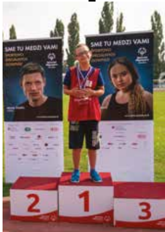
Nagyon jó érzés a dobogó legfelső fokán állni