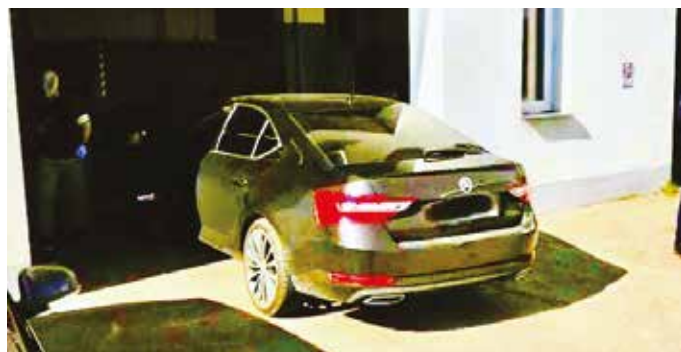
Az autót is átvizsgálták a rendőrök

Lefoglaltak három fegyvert és több mint 700 darab töltényt is. A férfinak nincs fegyverviselési engedélye. A nyomozó büntetőeljárás indított a 60 éves férfi ellen, és indítványozta előzetes letartóztatásba helyezését. Ha a bíróság bűnösnek találja, tíz év börtönbüntetést kaphat. (l)