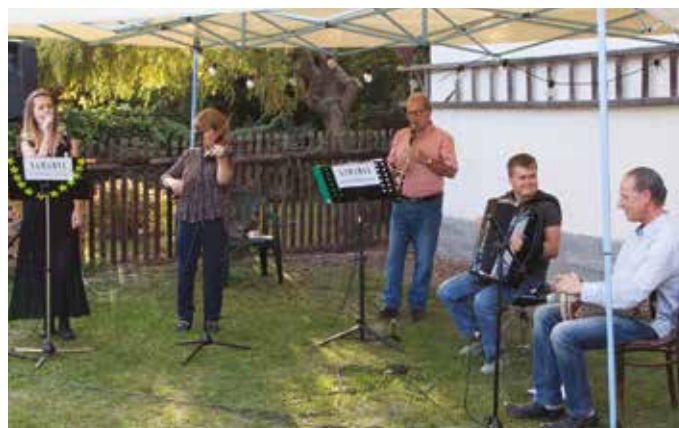
A koncertet a tájház udvarán tartották meg