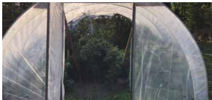
Kannabiszt és fegyvereket is találtak a házkutatás során

Szeptember végén előállítottak a rendőrök egy patonyréti házaspárt. Házkutatást tartottak náluk, kannabiszt és három fegyvert találtak. A rendőrök a fóliasátorban és a füstölő mellett marihuánaültetvényre bukkantak. Zacsókban tárolt, szárított kannabiszt is találtak a házban és az autóban.