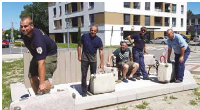
Az önkéntes tűzoltók is segítettek a munkában

Az alkotásnak helyet adó terület előkészítése februárban kezdődött, majd a Via Nova és a Somorjai Önkéntes Tűzoltó Testület tagjai július elején a