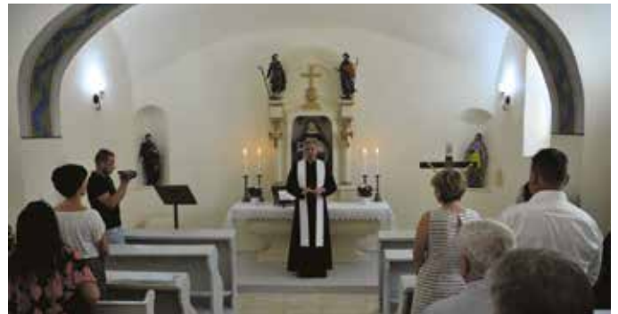
Naponta 60-70 látogatója volt a kápolnának