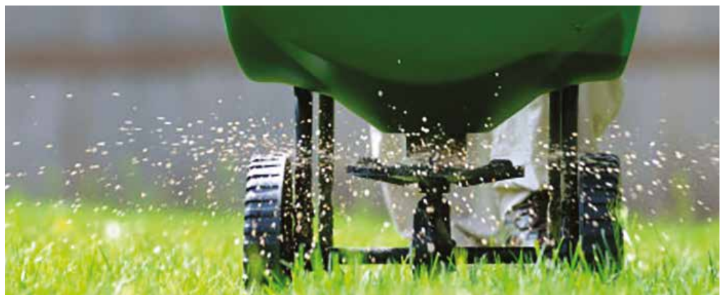
Októberben is törödni kell a pázsittal