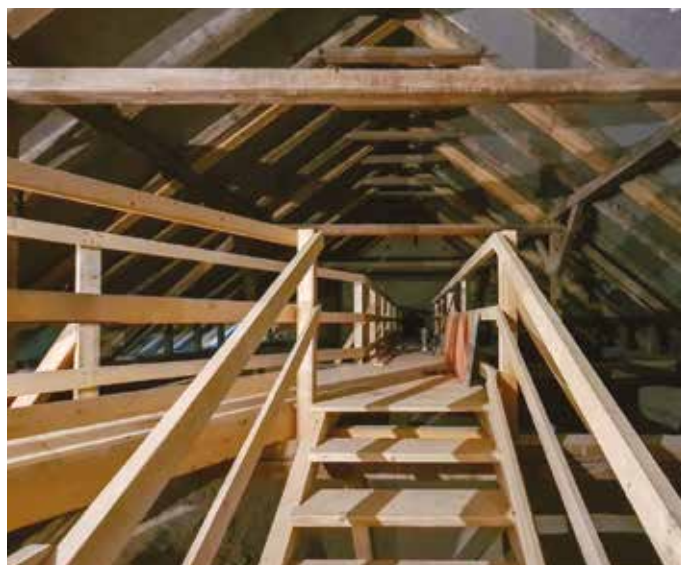
A torony épülete biztonságosabb lett, a régészek számára pedig lehetővé vált a még részletesebb kutatás