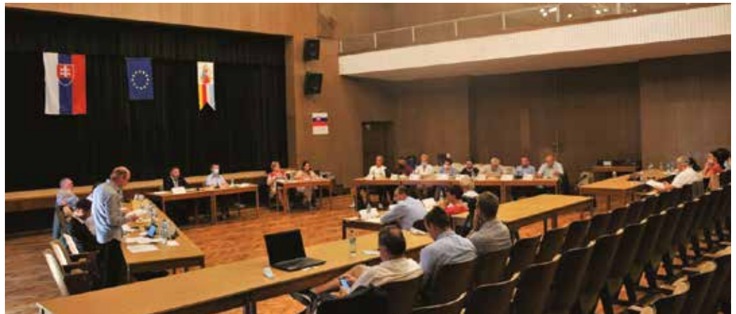
Az ülésen elfogadták a költségvetés második módosítását

A képviselő-testület megszavazta a 328 ezer eurót kitevő