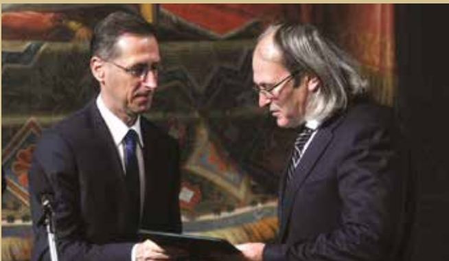
Varga Mihály, Magyarország pénzügyminisztere is gratulált a kítüntetettnek