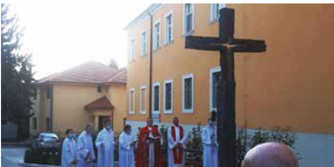
A kereszt Pavol Dubina szobrászművész alkotása

Négy méter magas bronzkeresztet avattak fel a város szívében, a katolikus templom közelében. Az alkotás a Kolostor utca központi eleme lett.