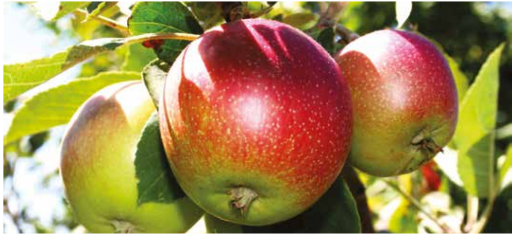
Neskoré odrody jablák sa oberajú od septembra

Jablone vysádzame na slnečné, svetlé stanovištia. Najradšej majú piesčito-ílovitú, na živiny bohatú pôdu, ale sú pomerne náročné na dostatok vody, pre-