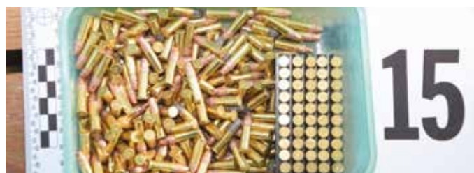
Bolo zaistené aj veľké množstvo nábojov

zámožnejšiemu odberateľovi. V ostatných mesiacoch bolo v okrese zadržaných viacero drogových dílerov: v auguste našli u istého muža vo Veľkom Mederi viac stoviek dávok pervitínu, ešte predtým zaistili iného šamorínského dílera. (k)