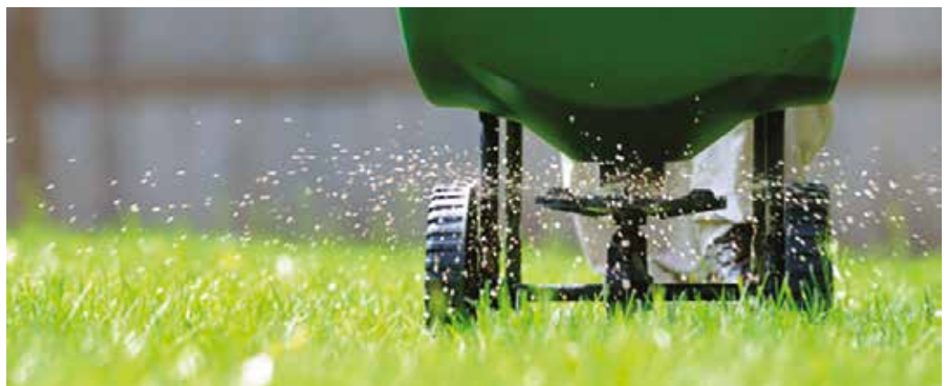
Na jeseň posypeme trávnik umelým hnojivom s vysokým obsahom draslíka