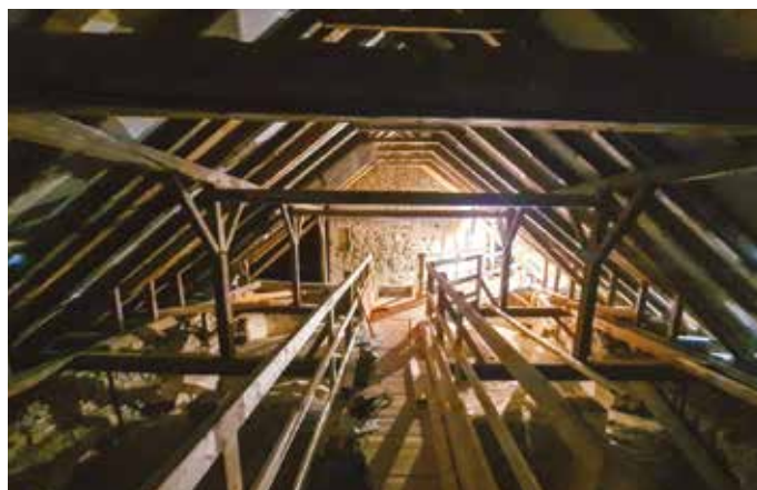
Veža sa stala bezpečnejšou, z hľadiska archeológov môže byť ich výskum ešte podrobnejší