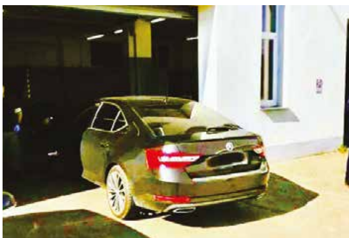
Policajti preverili aj vozidlo zadržanej osoby

Hliadkujúci mestskí policajti si všimli 24. septembra na Školskej ulici osobu, po ktorej bolo vyhlásené pátranie už v roku 2018. Muž je obyvateľom Šamorína, adresu bydliska má v Mestskom majeri. Keď si dotyčný všimol policajné auto, snažil sa uniknúť smerom na Mestský majer, a následne na Hlavnú ulicu, kde ho hliadka zadržala a vzala do väzby. Upozornili štátnu políciu ktorá potvrdila, že po dotyčnom mužovi bolo vyhlásené pátranie z dôvodu, že nenastúpil do výkonu väzby. Muža previezli do väznice v Leopoldove.