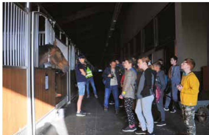
Žiaci ZŠ Mateja Bela na exkurzii v x-bionic® sphere

Záverečným akordom tohtoročného týždňa mobility bola cyklotúra, na ktorej sa naše základné školy prezentovali niekoľkočlennými skupinami svojich žiakov. Túru odštartovali pred mestským úradom, odkiaľ sa školáci a ich sprievodcovia presunuli do športového komplexu x-bionic® sphere. Po