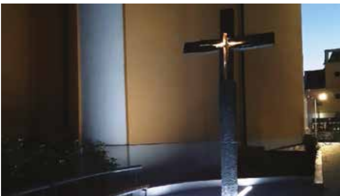
Križ je dielom akademického sochára Pavla Dubinu