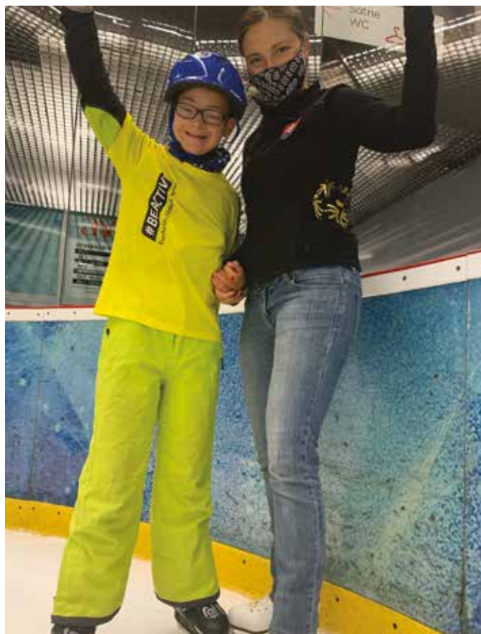
Pravidelný tréning je veľmi dôležitý