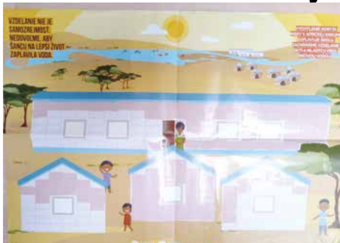
Aj žiaci ZŠ Mateja prispeli na školu v Keni

Mať v núdzovej situácii srdcia otvorené pre tých, čo sú ešte núdznejší, je postoj, ktorý stojí za vyzdvihnutie.