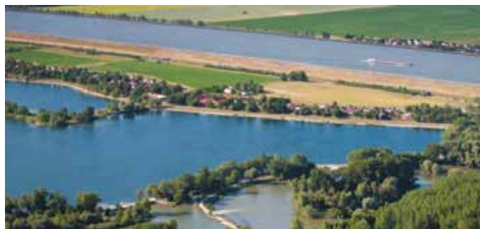
Miznú posledné prirodzené biotopy

Predstavitelia Šamorína, Veľkej Paky, Hviezdoslavova a Vojky nad Dunajom upozornili na stretnutí v Dunajskej Strede najmä na fakt, že dokument nezohľadňuje negatívne environmentálne vplyvy VDG Gabčíkovo, nezaoberá sa s problematikou čiernych skládok, je príliš všeobecný, miestami dokonca obsahuje nereálne tvrdenia a nemotivuje samosprávy k zachovaniu svojich prírodných hodnôt.