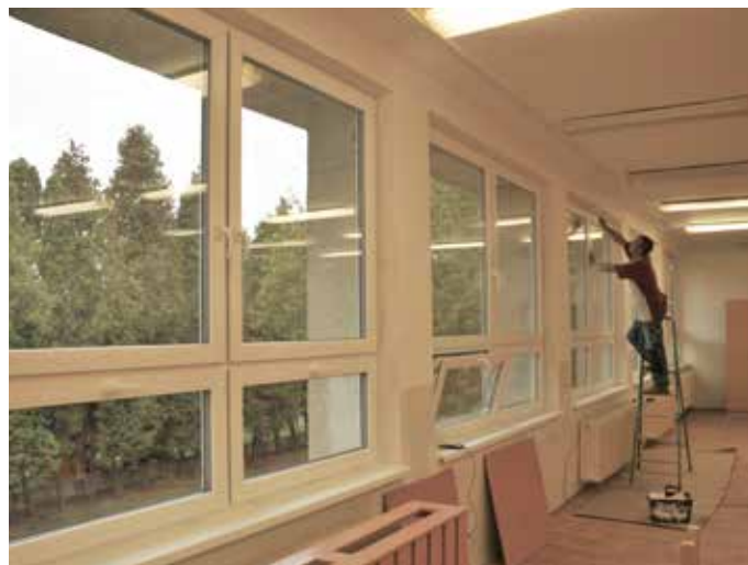
Pôvodné okná nahradili novými plastovými oknami

Mesto nižšími nákladmi na energiu v konečnom dôsledku ušetrí, pričom sa komfort užívateľov budovy zvýši. Stavebné úpravy zahŕňajú aj práce na zlepšenie hygienických a zdravotných podmienok v interiéri škôlky. Zástupcovia samosprávy spolu s vedením a so zamestnancami materskej školy urobia všetko pre zabezpečenie bezproblémového chodu materskej školy počas rekonštrukčných prác. Ďakujeme rodičom za pochopenie a nápomocný prístup. Dúfame, že sa detičky čoskoro dočkajú vynovenej budovy, ktorá bude šetriť prírodné zdroje. (k)