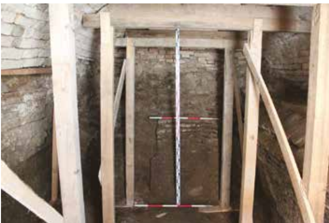
Žumpa kláštora počas rekonštrukčných prác

gickú rolu, bol jediným väčším mestom na ľavom brehu Dunaja medzi Prešpokom a Komáromom. Komárno bolo v tom čase pohraničným opevnením pred tureckou ríšou. Zo zachovaných písomností vieme, že v 17. storočí v Šamoríne skladovali strelný prach, delá a zbrane a zdržovali sa tu vojenské posádky. Opevnenie mesta bolo preto dôležité. „Žiaľ, aj keď sme našli tento múr tam dole v pivnici, nemáme poňatia, kde máme hľadať jeho pokračovanie. Vieme toľko, že ho nemohli dokončiť, nechali ho nedobudovaný