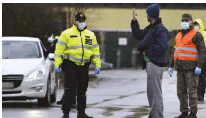
Nie každý súhlasí s povinnosťou nosenia rúška

Bez údajov, ktoré slúžia na overenie, či osoba naplní podstatu výnimky, nie je možné výnimku potvrdiť, vysvetľuje hovorkyňa. "Ide o údaje získavané s cieľom naplnenia účelu, pre ktorý bol vládou nariadený zákaz vychádzania a tieto údaje majú svoj legálny podklad v príslušných uzneseniach vlády prijatých