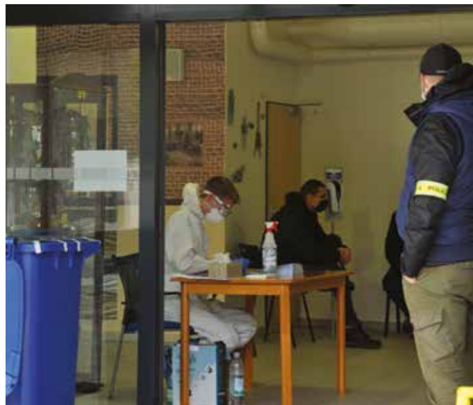
Jedna z najvyťaženejších odborných miest – Športcentrum Samaria