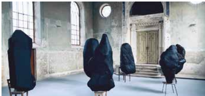
Kamene sú svedkami našej minulosti a prítomnosti