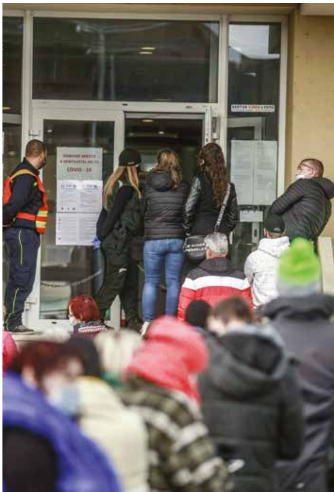
Pred odbornými miestami už ráno sa tvorili dlhé rady

knihnice Zsigmonda Zalabaiho sa ako dobrovoľníčka zapojila do administratívnych prác. „Neviedli sme, s čím máme počítať. Riadenie bolo v rukách armády, no tušili sme, že veľa bude závisieť aj od Šamorínčanov, aj od dobrovoľníkov. V ten víkend som objavila pravý zmysel