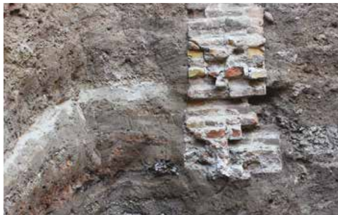
Zvyšky múrov domu z neskorého stredoveku na nádvorí