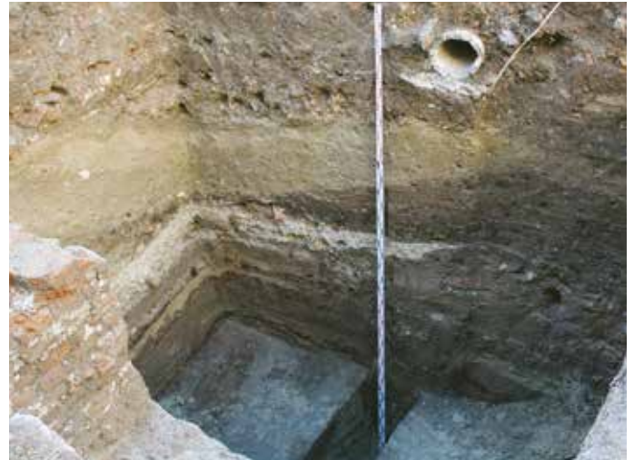
Prieskumná sonda vrtaná na nádvorí kláštora: História Šamorína vtlačená do štvormetrovej vrstvy (žltá vrstva ílu je hlina zachovaná z kopania základov kláštora)

V čase výstavby bývalého kláštora boli na lokalite ruiny, ktoré boli z väčšej časti odstránené. Ruiny tu zostali aj po veľkom požiari v roku 1683, pričom si stavitelia s týmto múrom už zjavne nevedeli rady. Časť múru smerujúcu do pivnice do určitej výšky zbúrali, potom nechali tak a sčasti ju zakomponovali do základov kláštora, čo je dodnes krásne vidieť v základoch a v podlahe pivnice kláštora. Táto časť je ozaj zaujímavá, pretože múr bol vybudovaný z pomerne veľkých kvádrov, akých v okolí Šamorína niet, najbližšie ich možno nájsť v Karpatoch. Od výšky zhruba 1 m bol tento 1,20 cm hrubý múr budovaný z tehál. Podľa všetkého tu ide o býva-