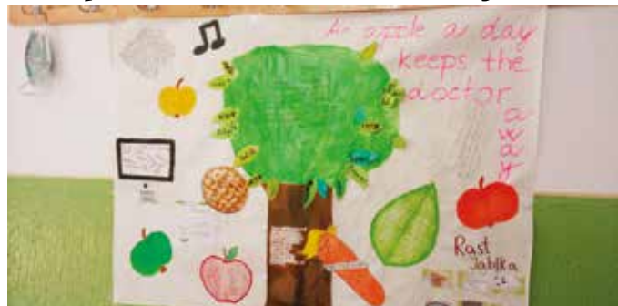
Jablko je symbolom kultúrnej i genetickej pestrosti

21. októbra je Deň jablka, na ktorý sme si v Základnej škole M. Bela v Šamoríne pripravili milý projekt.