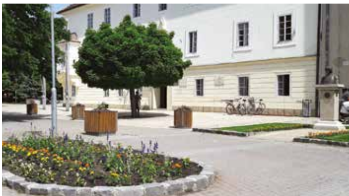
Pokračujeme v programe Zakvitnuté mesto

dobrovoľných hasičských zborov, súčasne sme navýšili rozpočet tradičných mestských podujatí. Nemenej je dôležité, že spolupráca založená na vzájomnom rešpekte naďalej trvá aj s tradičnými cirkvami.