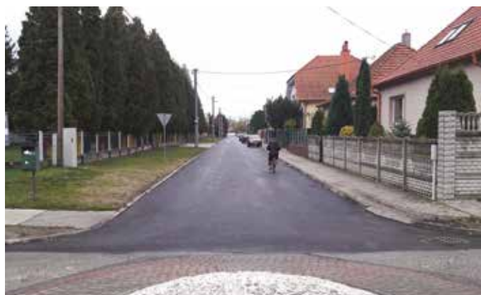
Aj na Poľovníckej ulici bola vozovka obnovená

Hornú časť Gazdovského radu sme kompletne obnovili, vymenili sme tu aj tepelné rozvody. Čiastočne sme upravili okolie škôlky na Dunajskej ulici, obnovili sme ulice Krížna, Poľovnícka a Márie. Pred budovou ZUŠ sme vytvorili nový priestor a obnovili, respektíve vybudovali sme nové úseky chodníkov v mestskej časti Kráľovianky a na ulici Jabloňový rad. Vyzdvihujem, že sme naše chodníky na desiatich miestach prerobili na bezbariérové. Zlepšilo sa verejné osvetlenie na Priechodnej ulici a podarilo sa nám osvietiť aj niektoré prechody pre chodcov. Úprava priestorov je ukon-