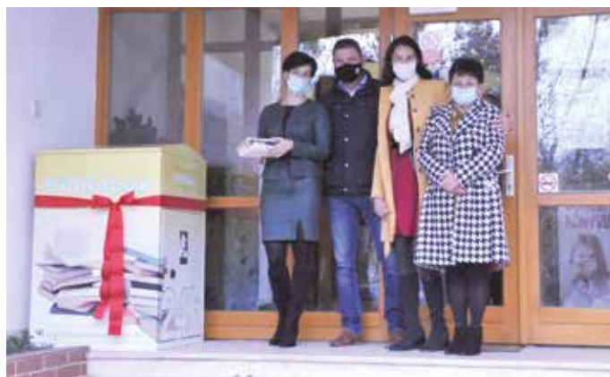
Stačí sem knihy vhodit.

Služby mestskej knižnice Zsigmonda Zalabaiho sa opäť rozšírili. Čitatelia majú možnosť vrátiť vypožičané knihy 24 hodín denne a 7 dní v týždni prostredníctvom Biblioboxu umiestneného pred budovou knižnice.