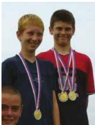
2006 – már gyerekkorában rengeteg érmet szerzett