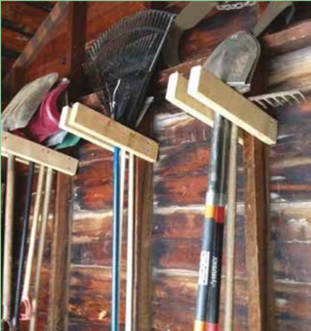
Ilyenkor van idő rendet tenni a szerszámok között

cseréljük ki az elszakadt tömitést. Ne feledkezzünk el a kerti gépek, fűnyírók, rotációs kapák, motoros kaszák és fűrészek téli karbantartásáról sem. Az olaj, a gyújtógyertya, a levegőszűrő cseréje, a kés és a lánc élezése is az éves karbantartás része. Ha mindezt elvégezzük, nem érhet bennünket meglepetés, amikor a szerszámot használnunk kell.