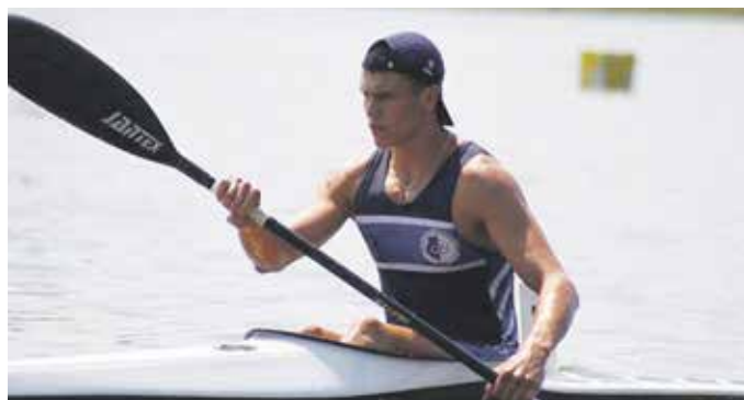
2012 – első komoly sikere, érmet az olimpiai reménységek versenyén