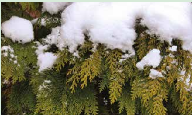
Az ágak letörhetnek a hó súlya alatt

Ha a tél a továbbiakban szárazra fordulna, a fagymentes időben gondoskodjunk a túlevelűek vízellátásáról. Ha havazik, az oszlopos tuják,