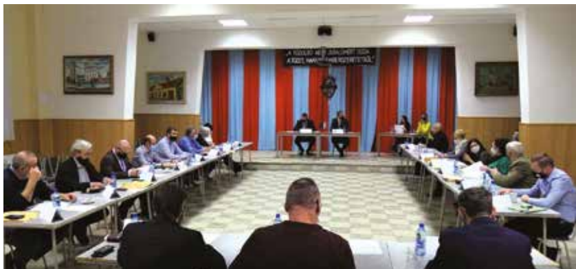
A járványügyi intézkedések miatt a decemberi ülés is a nyilvánosság kizárásával zajlott

Tavalyi utolsó ülését tartotta 2020. december 15-én a somorjai képviselő-testület. Ennek során elsősorban olyan témák kerültek terítékre, amelyek meg tárgyalására az év folyamán a járványügyi helyzet miatt nem került sor.