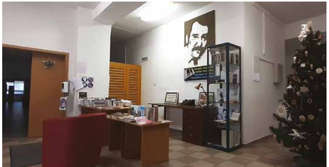
A berendezési tárgyakat az író özvegye adományozta a könyvtárnak

Nem egyszerű könyvkölcsönző, hanem közösségi hely a városi könyvtár. A könyvtárosok legfőbb célja, hogy minél több fiatal és új olvasót nyerjenek meg, ezért könyvismereti órákat, interaktív foglalkozásokat, könyvbemutatókat, író-olvasó találkozót szerveznek. A napi több mint ötven látogatót és az összesen csaknem másfélezres tagságot közel 45 ezer könyv, valamint az olvasóteremben