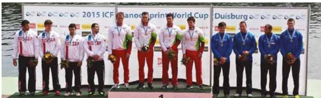
2015 – első érmet a felnőttek között, bronz a világtúrában