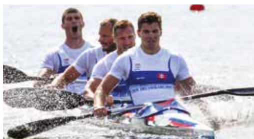
A K4 ezer méteres verseny döntőjében