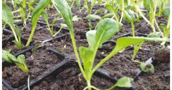
A melegházba hajtásra szánt paprika- és paradicsommagok beszerzését nem érdemes sokáig halogatni

Eddig enyhe a tél, meglátjuk, mit hoz a Pálforduló (január 25.), hiszen a népi hiedelem szerint amilyen idő van Pál napján, olyan lesz az időjárás negyven napig. Vagyis Pál napján a tél az ellenkezőjére fordul.