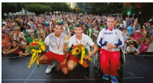
A somorjai fogadtatás a főtéren