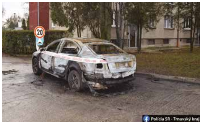
Még vizsgálják, mitől gyulladt ki az autó

észrevette a lángoló embert, és vízzel leöntötte. A fiatalember a gyors segítség ellenére is második- és harmadfokú égési sérüléseket szenvedett, testfelületének 62 százaléka megégett. Kórházba szállították és mesterségesen altatják. A helyi önkéntes tűzoltók oltották el a lángoló autót, a rendőrség vizsgálatot indított az ügyben. Részletes tájékoztatást egyelőre nem adnak, a szakértők még vizsgálják, mi okozta a robbanást és a tüzet.