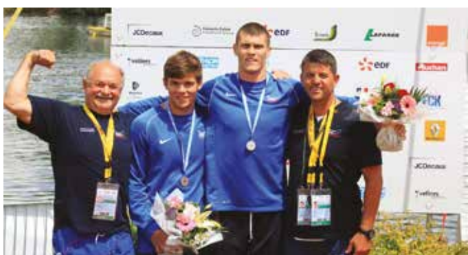
2014 – ezüstérem az U23-as EB-n