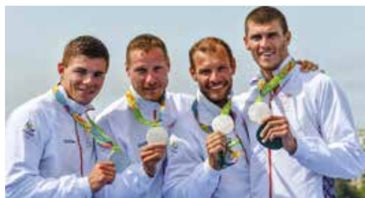
Az ünnepélyes eredményhirdetés után, az ezüstérem boldog tulajdonosaként