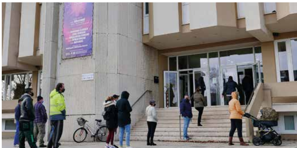
S registráciou to bolo oveľa jednoduchšie

Čo všetko znamená zorganizovať jedno takéto testovanie? Minimálne zabezpečiť nasledujúce úlohy: mestský