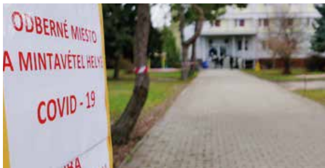
Samospráva postupne znižila počet odberných miest

Covid neobišiel ani Ambróziu Striktnú karanténu v Domove pre seniorov Ambrózia ukončili 28. januára. V celom okrese bol šamorínsky domov pre seniorov ten, ktorý najdlhšie odolával pandémie. Žiaľ, v januári sa vírus dostal aj tam a spôsobil veľké problémy.