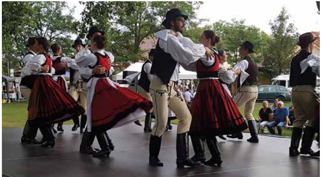
Vystúpenie Csalló na 6. Bazovom festivale v Kyselicách

Potom v polovici marca prišla pandémia a všetko sa zastavilo. Návky sa nemohli konať tradičným spôsobom, vystúpenia odpadávali jedno za druhým,