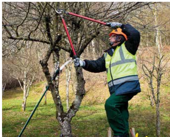
Našou najdôležitejšou prácou je teraz zimný rez stromov

Najdôležitejšou aktuálnou prácou v záhrade je zimný rez stromčekov. Jablone a hrušky orezávame až vtedy, keď sú teploty pod -10°C už nepravdepodobné. Stromčeky orezávaj-