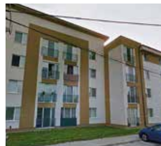
Nájomné byty na Kasárenskej ulici

Zákon ukladá za vraždu blízkej osoby trest odňatia slobody na 20 - 25 rokov až doživotie.