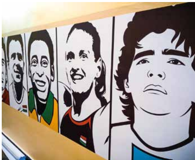
Steny Základnej školy Mateja Korvína zdobia portréty svetoznámych športovcov