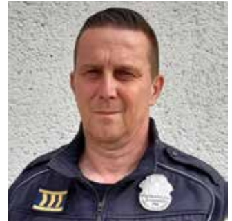
Imrich Szabados: nie je našim cieľom rozdávať pokuty, ale zabrániť šíreniu pandémie

Povolené je ísť k lekárovi, veterinárovi alebo do lekárne, vychádzka so psom je možná v okruhu do 1 km od bydliska. Zákaz sa nevzťahuje na starostlivosť o hospodárske zvieratá, ani na cesty kvôli úradným záležitostiam. Cesta do zahraničia je možná, ale je k tomu potrebný negatívny test. V čase medzi 5.00 a 20.00 hodinou je možné ísť s testom do obchodu, na poštu, do čistiarne, optiky, trafiky, banky, poisťovne, knižnice, autoservisu alebo cykloservisu.