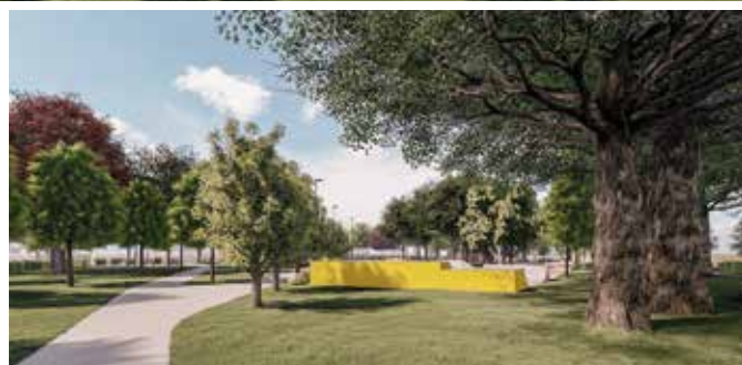
Projekt mládežníckeho parku je dielom Ateliéru Duma

Na plánovanej ploche 6260 m 2 bude skejtová dráha, ihrisko na streetball, vybudujeme tu