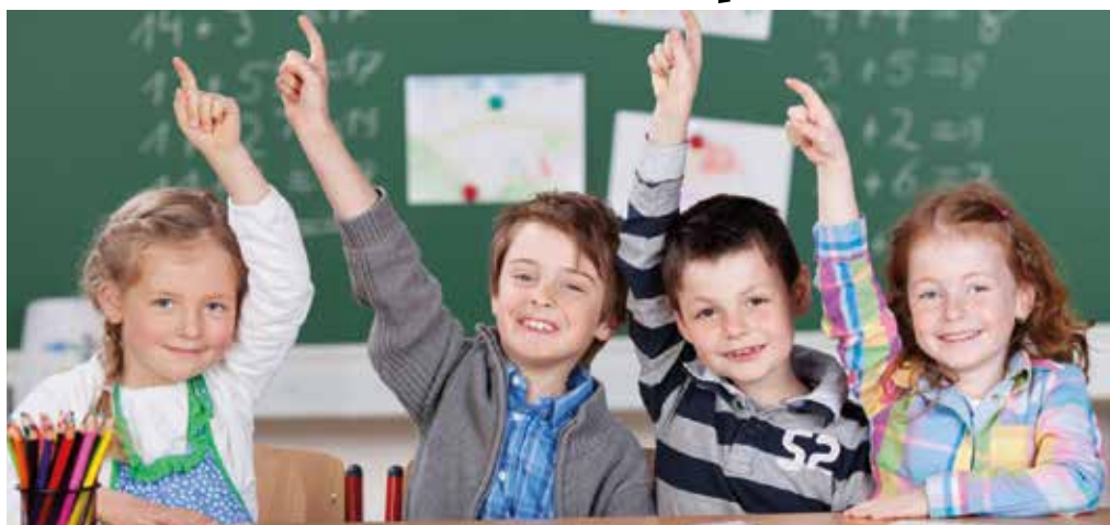
Rodičia aj deti dúfajú, že nový školský rok nezačne dištančne

Do maďarskej základnej školy M. Korvína bolo zapísaných 73 prvákov. „Veľa rodičov má ešte stále obavu, že na jeseň bude výuka opäť bežať online a preto máme nadpriemerný počet žiadostí o odklad. V našej škole plánujeme otvoriť tri prvé triedy. Žiaľ, kvôli pandémie sme nemohli zorganizovať naše klasické programy súvisiace so zápisom, napr.