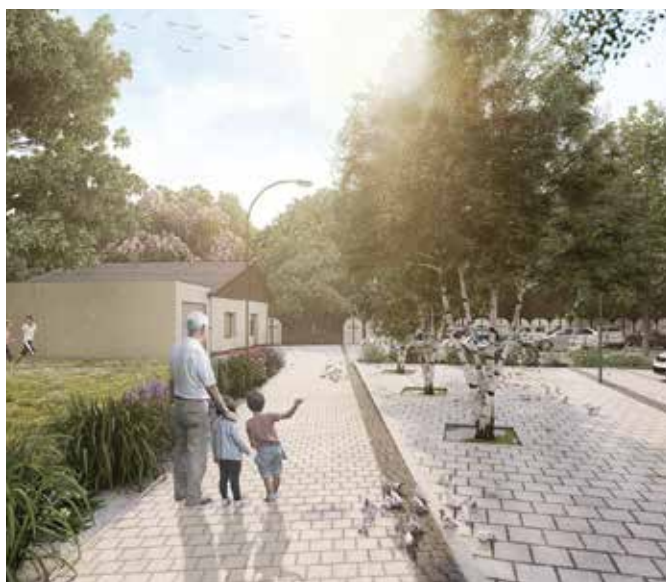
Projekt bol vyhotovený architektonickým štúdiom Maarchitekti

Prípravy sú už v plnom prúde a stavba sa začne o necelý mesiac. Nakoľko projekt plánuje riešiť nielen skrášlenie priestoru pred cintorínom, ale aj parkovacie a dopravné problémy obyvateľov bezprostredného okolia, dodávateľ žiada obyvateľov o pochopenie a trpezlivosť. Kým budú trvať práce, na dotknutom úseku Cintorínskej ulice nebude možné parkovať a aj obyvatelia panelákov budú musieť používať zadné vchody. Dodávateľ sa bude primerane k jeho možnostiam snažiť o minimalizáciu podobných nepríjemností. Samospráva bude obyvateľov informovať o aktuálne prebiehajúcich prácach na webovej stránke mesta. (1).