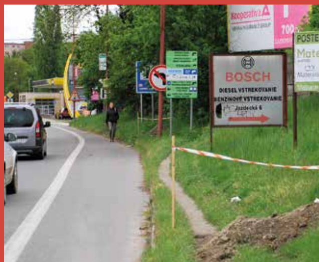
AREA s.r.o. začne s výstavbou chodníka 17. mája