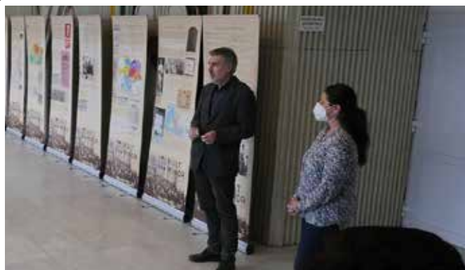
Výstava priblíži udalosti z rokov 1918–1920

domu, aby mohla byť výstava pre malé skupiny otvorená. „Neskôr, ak bude záujem, by sme ju radi priniesli aj do ďalších obcí. Podklady výstavy približujú udalosti, ktoré sa stali pred viac ako sto rokmi. Ukážeme, čo sa vtedy stalo v regióne obývanom Maďarmi, vo významnejších usadlostiach južného Slovenska, na Hornej zemi od jesene 1918 po podpis trianonskej zmluvy. Výstava znázorňuje každodenné udalosti, počas ktorých sa obyvatelia Šamorína, Komárna, Rimavskej Soboty, Košíc a iných obcí – občania Maďarského kráľovstva stali občan-