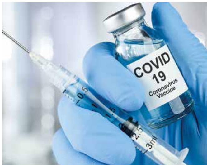
Na očkovanie vakcínami Pfizer a Moderna sa už môžu hlásiť ľudia od 45 rokov

Zdravotná poisťovňa vedie zoznam svojich chronicky chorých pacientov. Záujemcovia, ktorí sú súčasne chronicky chorými pacientmi sa môžu na očkovanie registrovať na stránke www.korona.gov.sk . Systém porovná údaje registračného formulára s údajmi evidovanými v zdravotnej poisťovni. Ako-