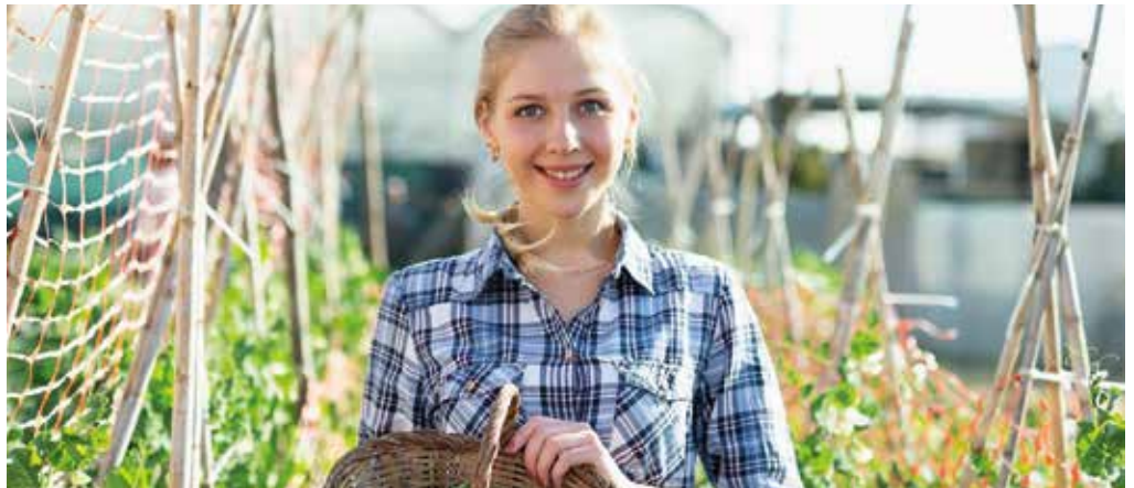
V máji môžeme zbierať prvé plody zo záhrady

V máji už môžeme zbierať prvú úrodu zo záhradky: redkovic, jarný šalát, špenát a cibuľku. Môžeme pokračovať v sejbe a výsadbe plodín menej citlivých na chlad, napr. redkovic, šalátu, špenátu, hrášku, mrkvy, petržlenu, paštrnák, zemiakov, kukurice lahôdkovej, cvikly, bylínok a jarných cibuľovín. Teplomilné plodiny (uhorka, cuketa, patizón, melóny a dyňa, tekvice a fazuľa) sa vysádzajú až po troch zmrznutých (Pankrác, Servác, Bonifác), teda v druhej polovici mája. To isté platí na vysádzanie paradajok do záhonov. Vysádzanie papriky radšej tiež nechajme na koniec mája, nakoľko je táto rastlina