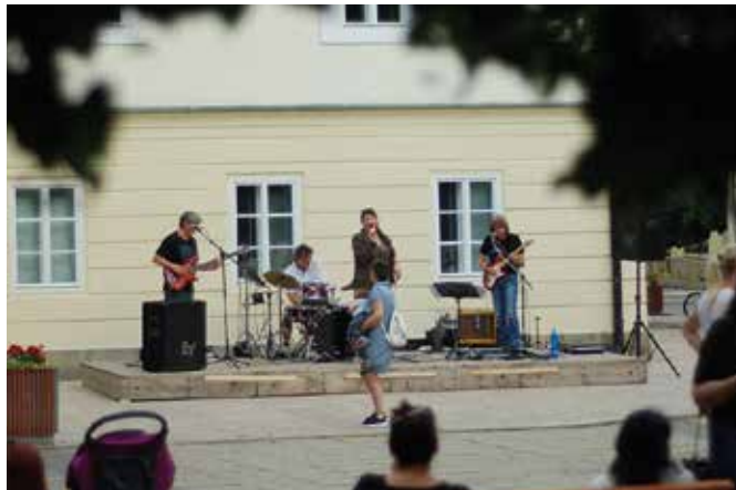
Deja vu - stále blízko k obecenstvu