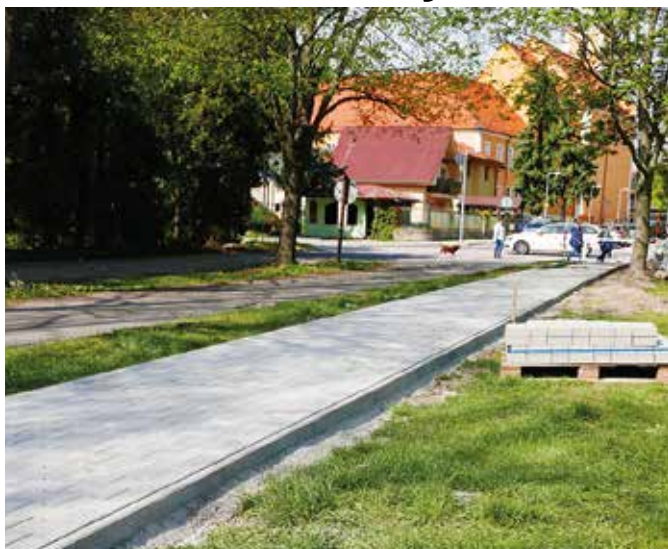
Nerovný asfalt je vymenený za dlaždený povrch

Starý rozbitý asfaltový chodník na Kláštornej ulici v úseku od križovatky so Školskou ulicou po paneláky na Mestskom majeri vystrieda elegantný bezbariérový chodník vykladaný dlaždicami. Na tomto približne 130 m dlhom úseku bude súčasne obnovené aj verejné osvetlenie, budú tu