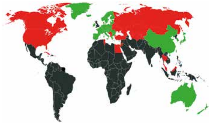
Az utazási szemafor állása június elején

Csehország, Magyarország és Ausztria elismeri a Szlovákiában kiállított oltási tanúsítványokat. Ausztriába azonban csak olyan oltási tanúsítvánnyal léphetnek be a szlovák állampolgárok, amely az Európai Gyógyszerügynökség (EMA) vagy az Egészségügyi Világszervezet (WHO) által elismert vakcina beadását igazolja. Akiket Szputnyik V vakcinával oltanak be, ezentúl is csak érvényes negatív teszttel, vagy a betegség