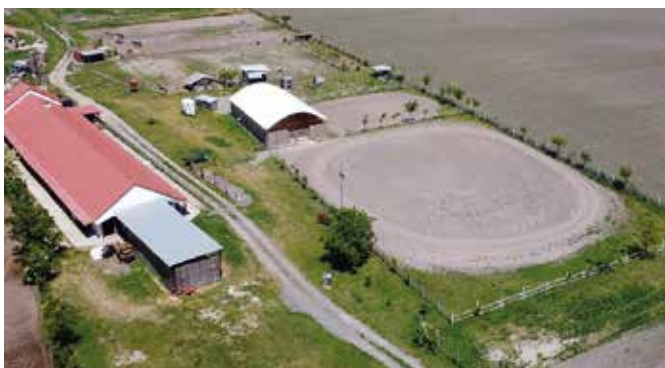
A Patatanyán egy fedett lovardában és két szabadtéri lovaspályán lovagolnak a hobbilovasok