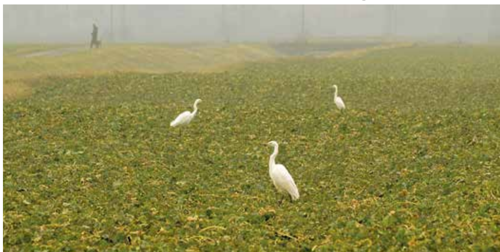
Városunk határa a nagy kócsagok telelőhelye

A biodiverzitást támogató koncepció egyik alapja a 2000-es években beszántott régi mezei utak helyreállítása lenne, amelyek mentén a táj élővilága számára hasznos őshonos fákat és gyümölcsfákat ültetnének ki. Így fontos biokorridorok jönnének létre a mezőgazdasági tájban, lehetővé téve a méhek, madarak, egyéb állatok megmaradását, vándorlását. Új szélfogók, méhlegelő, vizes élőhelyek kialakítását is tartalmazná a terv. Ezekkel az elemekkel változatosabbá tehetnénk a város