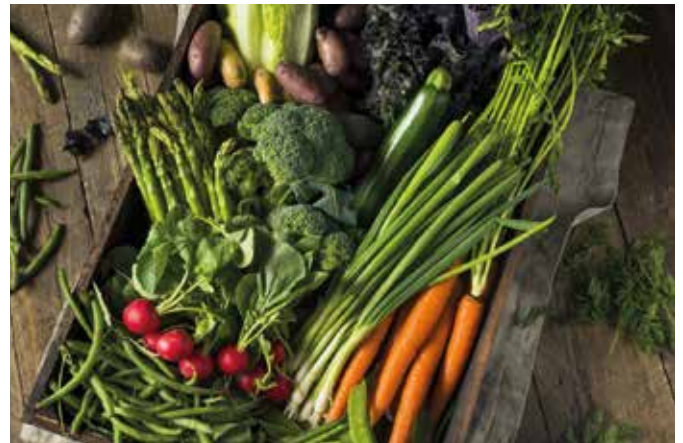
A zöldségekertből már szedhetők az első tavaszi zöldségek

Folytatjuk az alma és a szőlő gombabetegségek elleni védelmét. Az almafákat liszt-