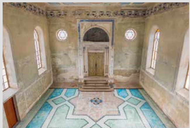
Az emléktáblát az egykori zsinagóga falán helyezik el

A tábla elkészítése és felszerelése 3500 euróba kerül. Aki támogatni szeretné a kezdeményezést, az SK58 5200 0000 0000 0575 6544 számlaszámra (VS: 620021) küldheti az erre szánt összeget. Az adományozó nem