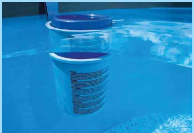
(lr) Gondosan állítsuk be a medence vizének pH-értékét

a víz elszíneződését és a mészkő lerakódását a medence falára. Ezt követi a klórszint beállítása, amelynek célja az algák és más baktériumok elszaporodásának megakadályozása. Ezt leginkább sokkáló klórozással érhetjük el. Ezután a klórszint tartására általában kombinált klórtabletta a legelterjedtebb, amely a klóron kívül, algaölőt, stabilizátort és pelyhesétől is tartalmaz. Az elpusztult algák és szennyeződések kiszűrésére filteres medenceszűrőt használunk.