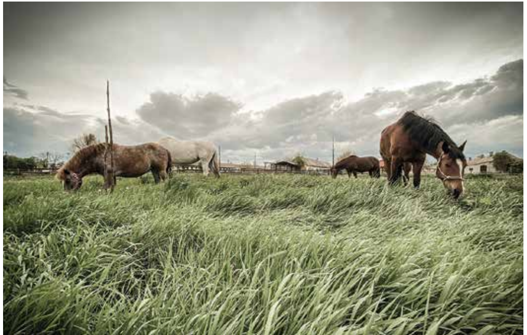
Lovak a nagyszarvai legelőn

Napjainkban egyre népszerűbb a hobbilovaglás, és a Somorját