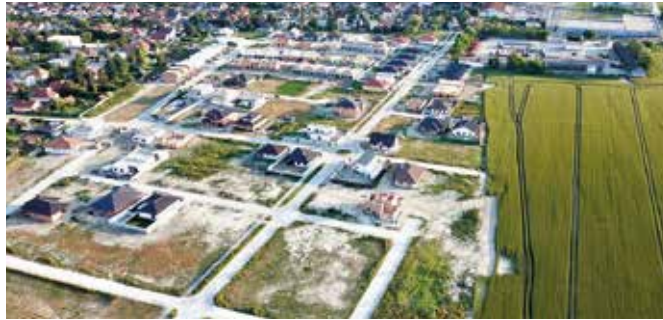
A lakosok javaslatot tehetnek a Labyrinth-Labirintus lakópark új utcáinak megnevezésére.