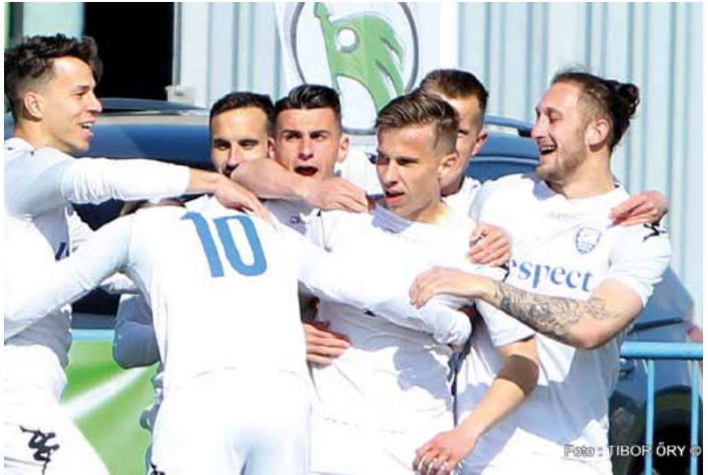
Gólöröm somorjai módra