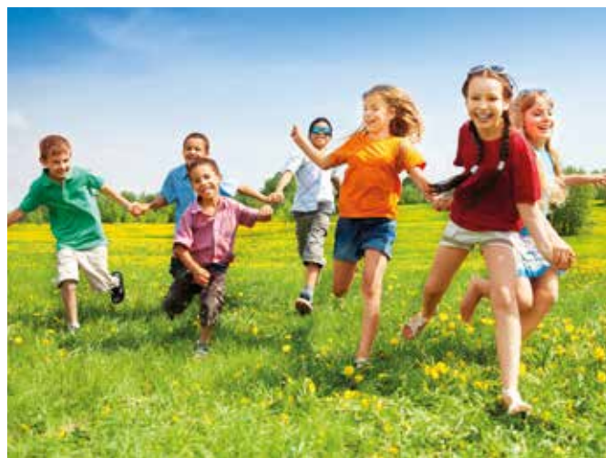
Nyári iskola helyett inkább táborokat szerveznek idén

Nem volt könnyű dolguk ebben a tanévben a tanulóknak és a tanítóknak sem, de az iskolave-