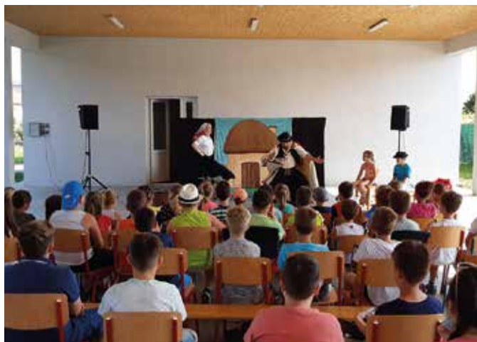
A Csemadok tejfalusi alapszervezetének meghívására látogatott el a Tejfalusi Alapiskolába június 23-án az ekecsi Kuttyomfitty Társulat. János Vitéz című interaktív előadásukat nagy érdeklődés kísérte.

A látogatás végén a tanulók is feltehetik kérdéseiket a hivatalvezetőnek, és jó hangulatú beszélgetés alakult ki. Főleg az alpolgármester munkája és feladatköre érdekelte őket, illetve az, hogy ha egy lakosnak valamilyen, a várost érintő ötlete van, kihez kell fordulnia, mit kell tennie. Minden kérdésükre válasz kaptak a gyerekek, akikből remélhetőleg olyan felnőttek lesznek, akik aktívan részt vesznek majd a város életében. Varju Péter