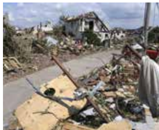
Óriási károkat okozott Csehországban a júniusi vihar

IBAN: CZ19 0100 0001 2331 1627 0217, BIC: KOMBCZPP