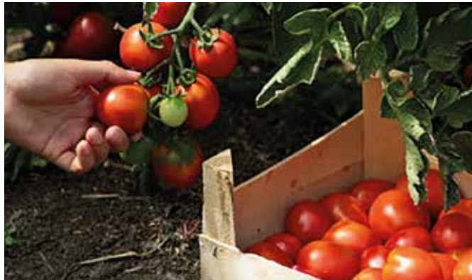
Az ideai termés egészségesnek mondható