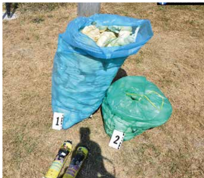
A nyomozók a környezet veszélyeztetése miatt indítottak eljárást

A Sülyi-tó a dunai ártéri erdők védett területéhez tartozik. 2. fokozatú védelem alatt áll. A nyomozók a környezet veszélyeztetése és károsítása miatt indítottak büntetőeljárást. A bűnösre 1-től 5 évig terjedő börtönbüntetést kiszabhatnak ki. (k)