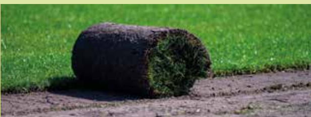
A pázsit telepítésére augusztus második fele az egyik legalkalmasabb időszak

A nagy hőség erősen igénybe veszi pázsitot, ezért folyamatosan locsoljuk. Inkább ritkábban, de nagyobb adag vízzel, lehetőleg reggel. Ha este locsoljuk, reggelig nedves marad, ami elősegíti a gombabetegségek kialakulását és terjedését. A barnás foltok megjelenését a gyepen valószínűleg gombás fertőzés okozza, ennek visszaszorítására Askon gombaölőszert alkalmazzunk. Továbbra se feledkezzünk meg a pázsit műtrágyázásáról, a szétszórás után jól be kell önteni a pázsitot. A pázsit telepítésére augusztus második fele az egyik legalkalmasabb időszak. A nappalok már nem olyan melegek, az éjszakai hőmérséklet viszont még nem alacsony. A fűszálak biztonságosan legyökereznek és megerősödnek még a tél beállta előtt.