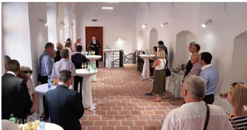
Az átadóünnepségen meghívott vendégek vettek részt

A somorjiaiak mindig is szívügyüknek tekintették, hogy