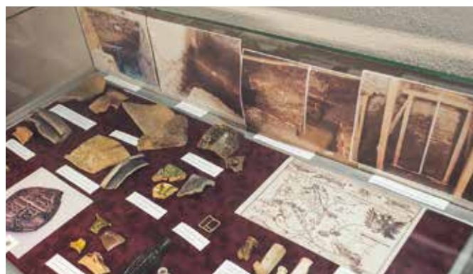
Érdekes leleteket állítottak ki a vitrinekben

A kolostor történetét három panelen mutatják be, a paneleket Virág Anita grafikusművész tervezte. Az első a paulánus rend történetét mutatja be, a rendet 1454-ben alapította Paulai Szent Ferenc az olaszországi Kalábriában.