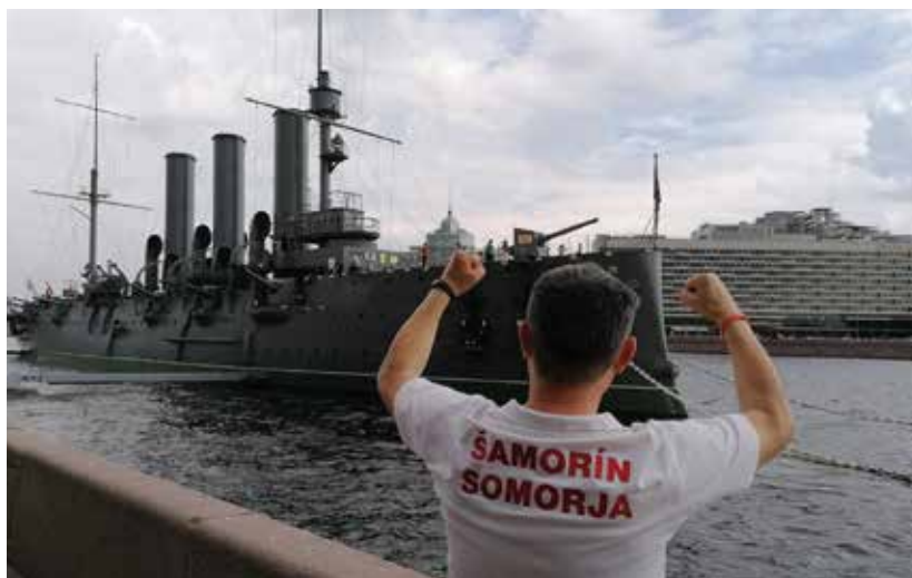
Somorjai üdvözet az Aurórának

Az első szentpétervári találkozón, amelyen az oroszok a belgákkal játszottak, megtelt minden szurkolói zóna. Egy idő után a szervezők lezárták az összes bejáratot. Szájmászk és távolságtartás? Senkit sem érdekelt.