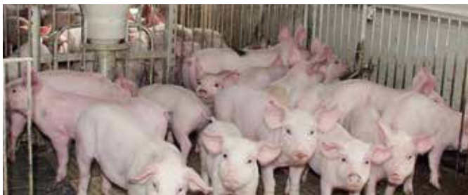
15 sertést lopott el a tolvaj

Linkešová elmondta, az ismeretlen tettes 15, egyenként kb. 30 kilós hízósértést lopott el, emellett megrongált egy lószállításra alkalmas pótkocsit. (k)