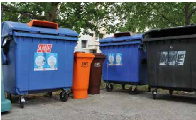
Július elején a somorjai lakótelepeken is megjelentek a lebomló konyhai hulladék gyűjtését szolgáló kukák

Tavaly a háztartási hulladék több mint 45 százalékát a lebomló konyhai hulladékok tette ki Szlovákiában, ezeknek nagy része a szeméttelpekre került, ahol ez a hulladék rövid időn belül bomlani kezd, és emiatt nagymennyiségű üvegházhatású gáz keletkezik, ami károsítja a légkört, nem beszélve arról, hogy feleslegesen terheli a lerakatok kapacitását, pedig e lebomló szerves hulladék nagyrésze újrahasznosítható lenne. (s)