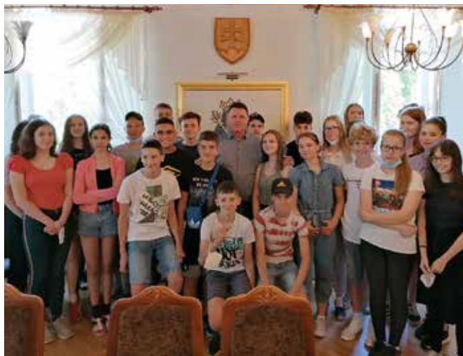
A Corvin Mátyás Alapiskola nyolcadikosai az önkormányzati munka felől tájékozódtak