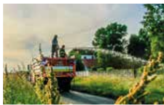
Június 9-én riasztották a tűzoltókat Csölösztőre

tartani az erdei utakat és vízforrásokat, hogy a tűzoltóság járművei hozzáférhessenek a területhez,