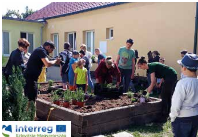
A gyerekek visszatérnek a természethez, megtanulhatják a kerti ágyások gondozását

Ezek az első olyan közösségi kertek Somorján, amelyeket az iskolaudvarokon alakítottak ki. Minden hasonló tevékenységet támogat a város, mivel a helyi termékek fogyasztása segít csökkenteni a szén-dioxid-kibocsátást, gondoskodásra és felelősségvállalásra tanítja a gyerekeket, és jól illeszkedik az alapiskolai órarendbe.