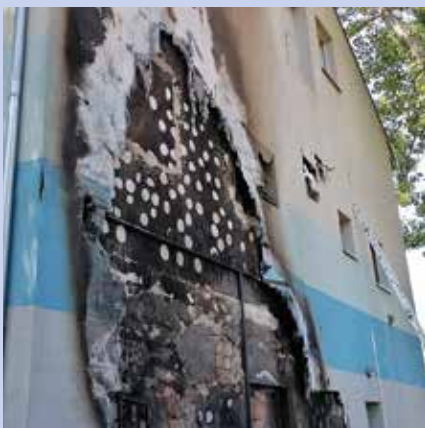
Az épület homlokzatának polisztirol hőszigetelése gyulladt ki

hanem a környezetvédelmi minisztérium illetékes munkatársai is felelősségre fogják vonni. Környezetkárosítás bűncselekményével gyanúsították, az ügyet a járási hivatal vizsgálja. (k)