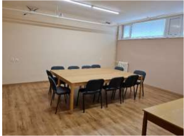
Oprava a maľovanie stien a elektrického vedenia na 1. poschodí