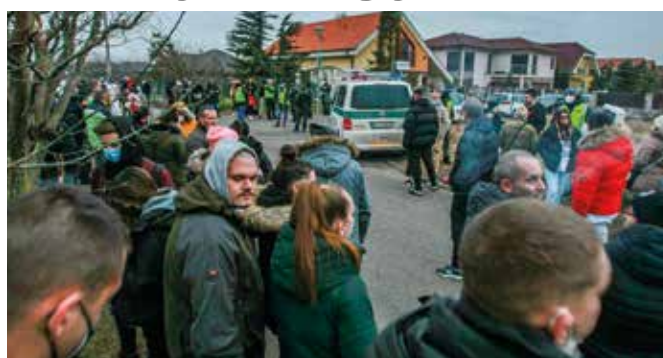
Január 9-én tüntetés volt Annamajorban, a rendőrség is nagy erővel kivonult

Annamajorban egy fiatal lányt bántalmazott több kiskorú, és a bejelentő fiát tanúként hallgatták ki a szenci rendőrkapitányságon. „Az intézkedő kollégák felszólították a nőt, hogy életveszélyes fenyegetés miatt tegyen büntetőfeljelentést a somorjai állami rendőrségen,