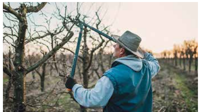
Az almafa metszése során a vízajtások többségét el kell távolítani

Aki azonban zöldséget akar termesztetni, annak lassan komolyan el kell kezdenie a vetőmagvak beszerzésével foglalkozni. Ez idén duplán érvényes, hiszen a tavalyi év a járvány miatt nem volt egyszerű a vetőmagot előállító cégek számára sem. Minden jel arra mutat, hogy bizonyos fajtákból vagy jóval kevesebbet, vagy egyáltalán nem tudnak szállítani.