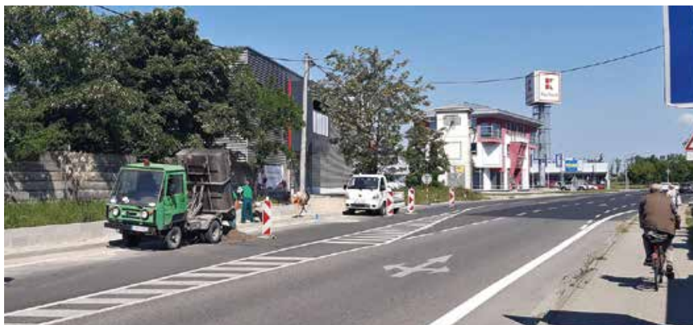
A tavalyi év egyik fontos beruházása a Kaufland felé vezető járda megépítése volt