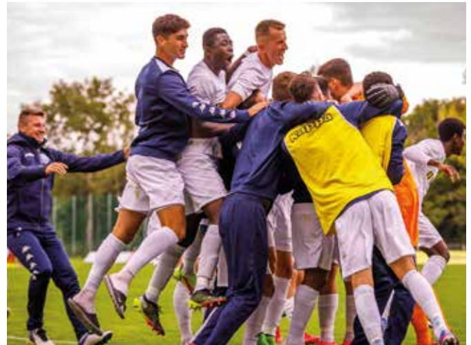
Az STK Somorja a nyolcadik helyen zárta az évet (Képtár) (Képtár)

A télen nem történtek nagy változások a csapatban. „Adott a csapat magja, csak minimális változások történtek. Január