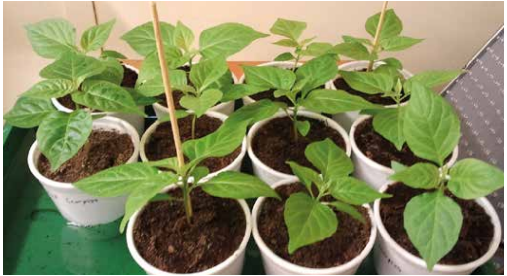
Február második felében el kell vetni a paprikamagot, hogy áprilisra életképes palántáink legyenek

Növekedés szerint folyton növő és determinált (nem folyton növő) fajták léteznek. A termésmennyiség a determinált fajtáknál kisebb, mint a folyton növő fajtáknál. Alacsony belmagasságú helyre válasszunk determinált növekedésű, illetve alacsony növésű fajtát (pl. Fehérozón, Amy). A folyton növő, nagy növeke-