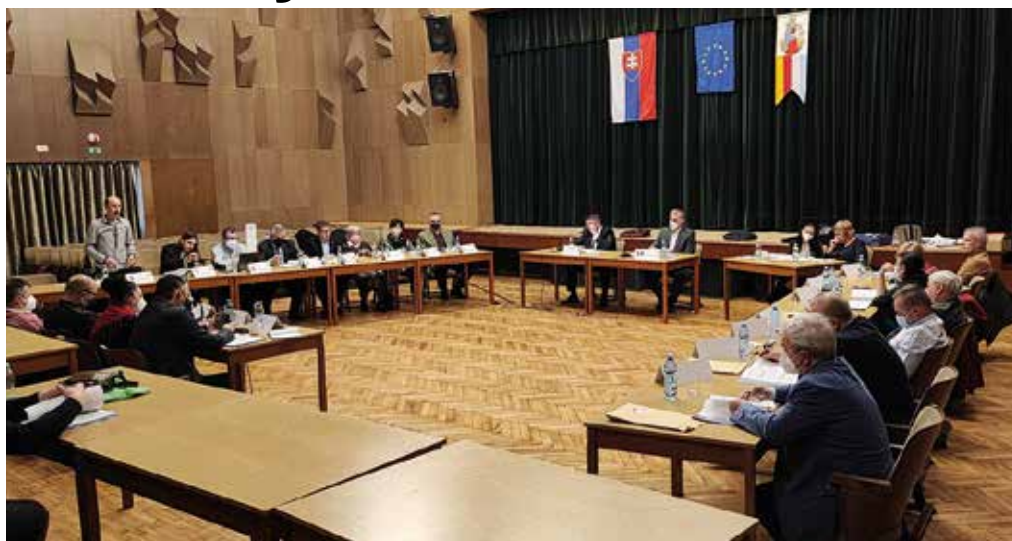
A képviselő-testület által elfogadott költségvetés a fejlesztést tartja szem előtt

Somorja idén 17 849 104 euróból gazdálkodik. A költségvetés hosszas egyeztetés eredménye, amely során mindegyik szakbizottság érvényesíteni tudta a maga prioritásait. Figyelembe veszi a város és a lakosság igényeit, biztosítja az intézmények működését és jelentős összeget szán a fejlesztésre. Prioritása az oktatási intézmények, valamint az idősek és rászorultak megsegítésére kialakított szociális háló zavartalan működése, elsősorban a rezsiköltségekre szánt összeg növelésével. A dologi kiadások idén mintegy 15,3 millió eurót tesznek ki, ebből az oktatási intézmények fenntartására 8,3 millió eurót fordít a város. A költségvetés továbbra is az előző évek szintjén támogatja a kulturális szervezetek, valamint az önkéntes tűzoltóság működését, míg a sportklubok támogatására fordítandó összeget 5 ezer euróval növeli, 120 ezer euróra. Megmarad a 2021-ben elindított participatív költségvetés 15 ezer eurós kerete, amely szükség esetén a beérkező lakossági pályázatok minőségétől függően bővíthet.