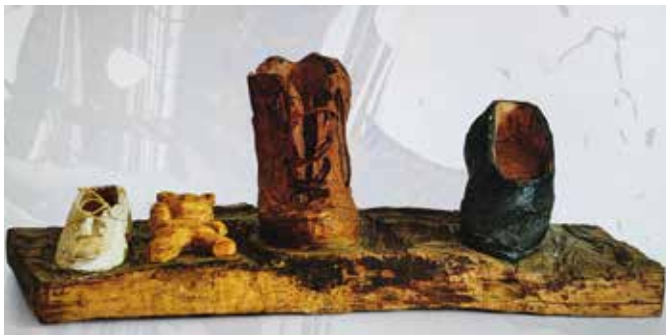
A Holokauszt-trilógia egy része, amely bejárta az országot