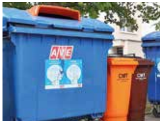
A lakótelepeken tavaly jelentek meg a barna és narancssárga kukák

Szlovákiában több mint 900 ezer tonna élelmiszer kerül a konténerekbe évente, és Somorja sem marad el az országos átlagtól, sőt. Sajnos világszinten is katasztrofális a helyzet, a vizsgálatok és a felmérések szerint az előállított élelmiszerek harmada a szemétkerül. A városvezetés, a hulladékgazdálkodás terén érdekelt társulások és vállalkozások továbbra is arra igyekeznek felhívni a figyelmet, hogy ami nekünk hulladék, az másnak értékes alapanyag lehet. A szakemberek arra kéri a lakosokat, hogy vegyék igénybe a szelektív hulladékgyűjtésre szolgáló edényeket, a komposztálórekeszeket, a konyhai hulladék, valamint az elhasznált olajak gyűjtésére kijelölt tárolóedényeket.