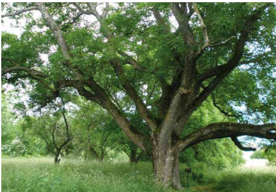
Nagyszüleink számára még ismeretlen fogalom volt a diófa betegsége (Képtár) (Képtár)

A diófa réme a dióburok-fúrólégy. A nyugati dióburok-fúrólégy nagyon hasonlít a cseresznyeléggyhez, ám sokkal agresszívabb, ezért nehezebb védekezni ellene. Évi egy nemzedéke van, és báb formájában telel át a talajban. Nagyjából június végétől számíthatunk az első repülő egyedek megjelenésére. Rajzásuk azonban nagyon elhúzódhat, hiszen egészen a betakarítási időszak kezdetéig, szeptember elejéig is eltarthat. Ez a kártevő, ahogy a neve is sugallja, befúrja magát a termés burkába, majd lerakja petéit. Miután a lárvák kikelnek, a termés zöld burkában élnek és rágják azt. A burkon először barna foltok jelennek meg, majd fokozatosan teljesen megbarnulnak. A rovar a rajzási időszakán kívül nem aktív.