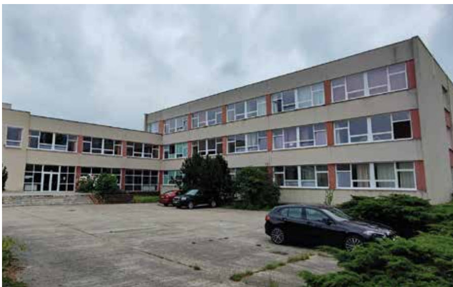
A szaktárca már tavaly szorgalmazta az új szlovák iskola megnyitását a helyi gimnázium épületében (Képtárház)

A galántai iskolanyitás nem is vetett fel kérdéseket, ott ugyanis egy szlovák tannyelvű szakközépiskola üresen álló termeibe költöznek be az új alapiskolai osztályok. A somorjai eset egészen más, mivel városunk szlovák tannyelvű alapiskolájában van elég hely a helyi tanulóknak. A gond az, hogy a környező településekre költözött szlovák családok gyerekeinek már nincs. Sőt, Nagyszarván, Keszölcésen, Bacsán, Tárnokon, Macházán, Sárosán és Békén sincs. A szaktárca már tavaly is szorgalmazta az új szlovák iskola megnyitását a helyi gimnázium épületében, de az erre vonatkozó javaslatot Somorja képviselő-testülete 2021. július 15-i rendkívüli ülésén nem támogatta. Igen egyszerű oknál fogva: másfél hónap alatt nem lehet iskolát alapítani (másfél év alatt is bajosan). Alternatívaként azt javasolta, az