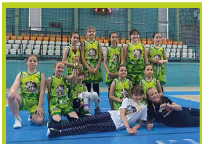
Az SKK Somorja utánpótlásnevelése már évek óta magas szinten folyik. Bizonyítja ezt az U10-es csapat sikere, amely a nem hivatalos bajnoki sorozatban (Pöstyén, Nyitra, Szered ellen) az összes tornán a legjobb lett.