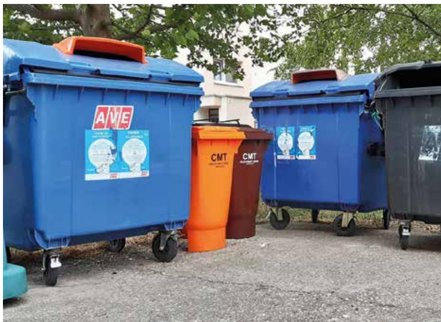
A somorjai kukaszigeteken egy éve jelentek meg a konyhai hulladék gyűjtésére szolgáló barna kukák (Képtár) (Képtár)

„Hogy ezt megelőzzük, arra kérem a lakosokat, legyenek a segítségünkre. Figyeljenek oda arra, hogy minél kevesebb lebomló konyhai hulladék kerüljön a nagy fekete konténerekbe. Bár a lakosok segítségével eddig is szép eredményeket értünk el, még mindig sok a tennivaló