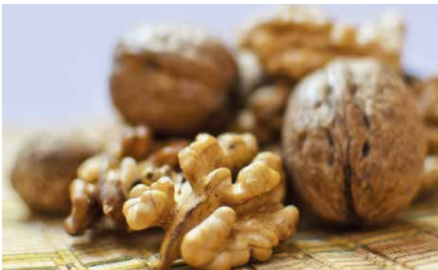
Ha nem vigyázunk, a kártevő tönkretelheti az egész termést

A dió feketedésének más oka is lehet, nem csak a dióburok-fúrólégy okozhat ilyen tünetet, hanem a baktériumos termésrothadás is. Ennek tünetei már kora tavasszal megjelenhetnek a friss hajtásokon, leveleken és a terméseken. A termésen sötétbarna foltok jelennek meg, majd elfeketednek és lehullnak. Ez ellen réztartalmú szerekkel védekezhetünk (Champion 50WP, Kocide 2000, Cuproxat SC), a virágzás kezdetétől, majd az elvirágzás után két héttel megismételjük. A diólevéltetű, a gubacsatka, dióaknázó moly és az araszoló hernyók is kárt tehetnek a termésben.