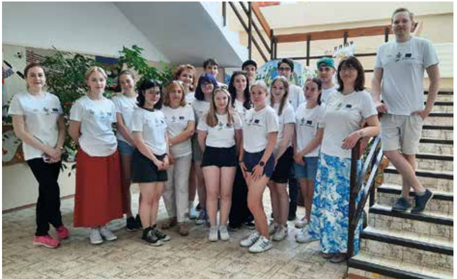
A finn küldöttség májusban járt a somorjai művészeti alapiskolában (Képtár) (Képtár)

Május elején a somorjai művészeti alapiskola vállalta a házigazda szerepét, és fogadta a finnországi diákokat és tanáraikat. Ennek a programnak az európai kultúra volt a témája. A finn vendégek meglátogatták az oroszvári Gerulata római katonai tábort, a Danubiana Múzeum modern művészeti kiállítását, valamint a Martin Benka festményeit