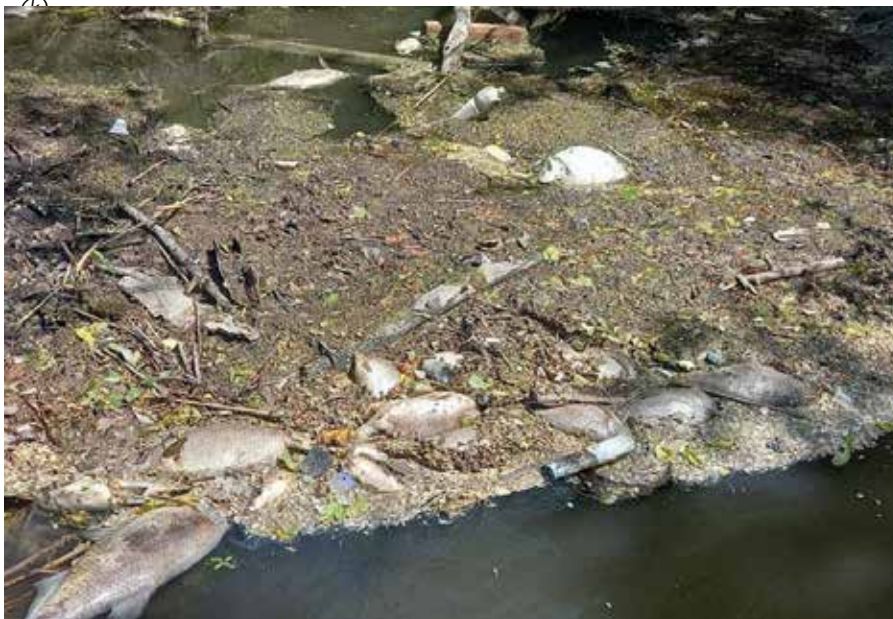
Lesújtó látvány fogadta a kirándulókat a Kis-Dunánál

A rendőrség szakértők bevonásával indított vizsgálatot az ügyben, május 18-án indult büntetőeljárás a környezet veszélyeztetése és károsítása gyanújával. A Kis-Dunán és a folyó környékén helyszíni szemlét tartottak a rendőrség, a tűzoltóság, a vízgazdálkodási vállalat, a környezetvédelmi felügyelet, valamint a Szlovák Horgászszövetség szakemberei. A szakértői vizsgálat eredményeit még nem hozták nyilvánosságra.