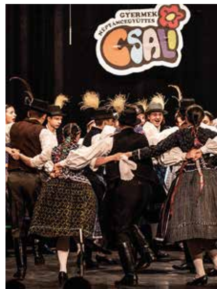
A somorjai együttes aransávós minősítést kapott, ezzel bejutott az országos döntőbe