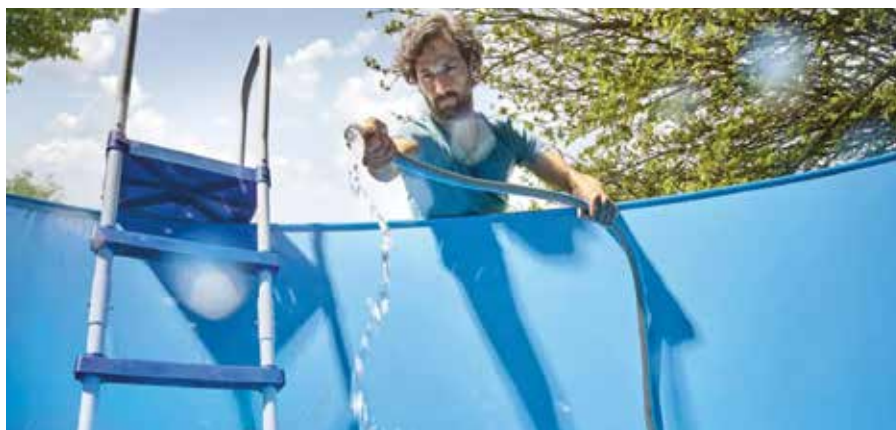
Figyeljünk oda arra, hogy ne csúcsidőben töltsük fel a kerti medencét

vízügyi szakemberek figyelmeztetnek, hogy szigorúan tilos összekapcsolni az ivóvízvezetékét a saját kúttal, mert ez az ivóvízhálózat elszennyeződéséhez vezethet. (k)