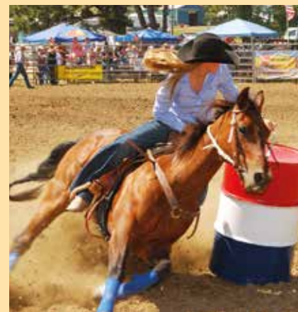
A fesztiválon lesz westernlovas bemutató is (Képcímke)