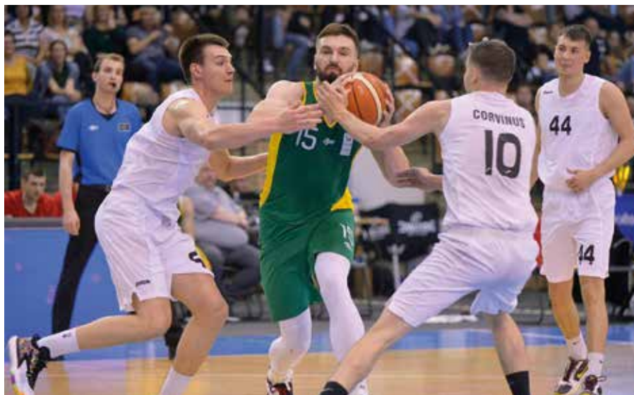
A somorjai kosaras a sikeres egyetemi bajnokságon