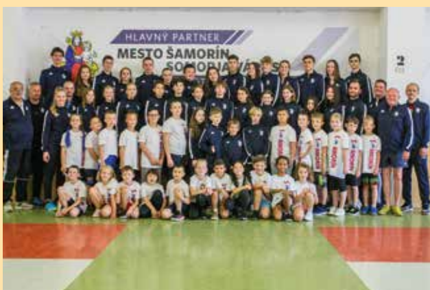
Pretekári Klubu šermu Šamorín majú za sebou ďalší úspešný rok. V sezóne 2021/22 získali na zahraničných súťažiach 54 zlatých, 52 strieborných a 76 bronzových medailí. Na Slovensku sa im podarilo vybojovať 34 majstrovských titulov.