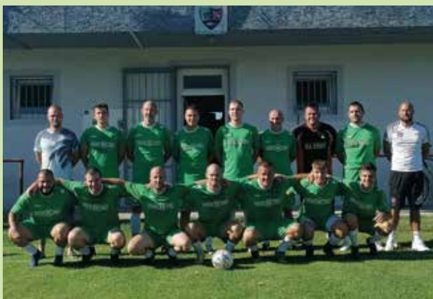
Futbalový klub Mliečno je opäť kompletný. V Mliečne sa vlni znovuzrodil mládežnícky futbal a po niekoľkoročnej prestávke sa v auguste vrátili na bojište aj dospelí.