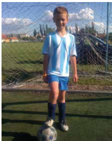
V drese Gheorgheni