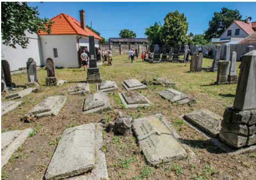
Šamorínsky židovský cintorín a obnovený dom smútku