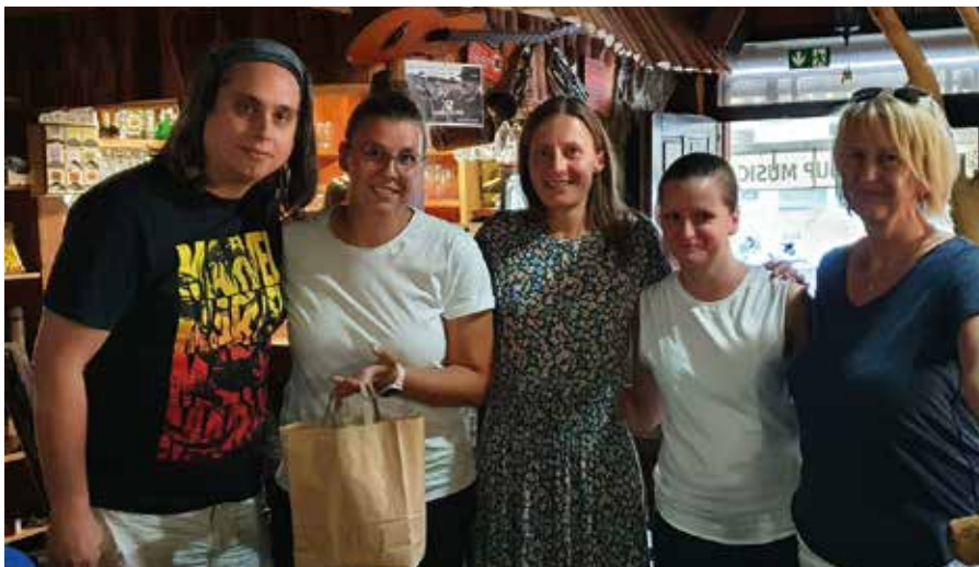
Víťazom kvízu sa stal tím Hútači