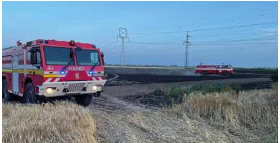
Obilie na ploche asi 30 hektárov padlo za obeť požiaru