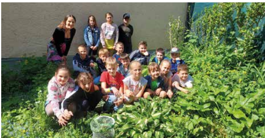
Sledovať motýle bola zábava

Aby toho nebolo málo, projekt pokračoval aj na hodinách anglického jazyka s príbehom nenásytnej húseničky, o ktorej sa dodnes rozprávame. Hlavne vtedy, keď príde reč na trpezlivosť, vytrvalosť, schopnosť prirodzeného napredovania v živote