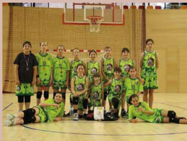
Basketbalisti ŠBK Šamorín opäť úspešne reprezentovali naše mesto. Najmladší hráči v U11 skončili na finálovom turnaji majstrovstiev Slovenska v Bardejove tretí.