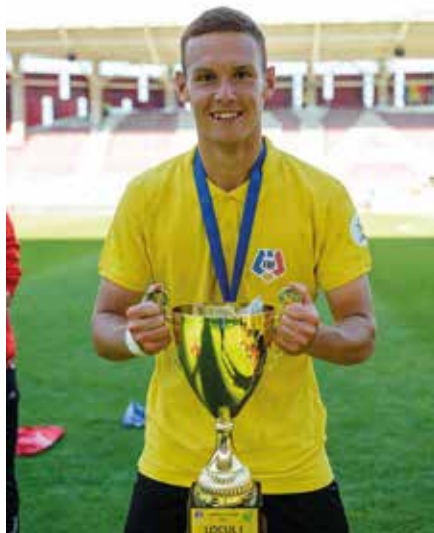
Pohárový triumf s tímom Miercurea Ciuc