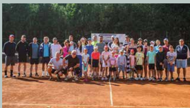
Predstavitelia Tenisového klubu ŠTK Šamorín pripravili krásny tenisový deň. Každý sa cítil veľmi dobre, o dobrú zábavu bolo postarané. Na antukovom ihrisku sme videli zaujímavé, špeciálne a vzrušujúce zápasy. Skvelú náladu doplnila ponuka výborných jedál a nápojov.