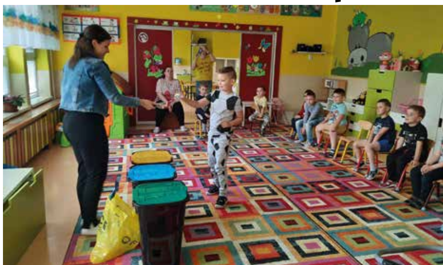
ZOHŽO kladie veľký dôraz aj na environmentálnu výchovu detí – Envirodeň v materskej škole v Čakanoch

„Naše združenie sa snaží redukovat' množstvo recyklovateľného odpadu, ktorý sa má uložiť na skládke. Aby sme vyhoveli súčasným legislatívnym požiadavkám, musíme si zabezpečiť najneskôr do roku 2024 linku separujúcu 6, resp. 8 frakcií odpadu, preto už teraz na to pripravujeme projekt. Medzičasom sme požiadali a aktualizovali našu žiadosť o navýšenie kapacity a optimalizáciu využitia skládky v