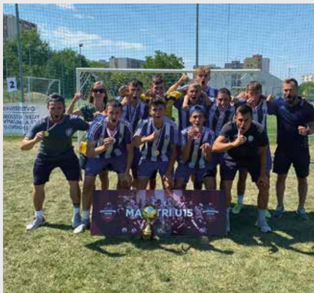
Žiaci Základnej školy Mateja Bela v Šamoríne vyhrali majstrovstvá Slovenska v minifutbale v kategórii U15. V kategórii U10 skončilo šamorínske družstvo na 2. mieste.