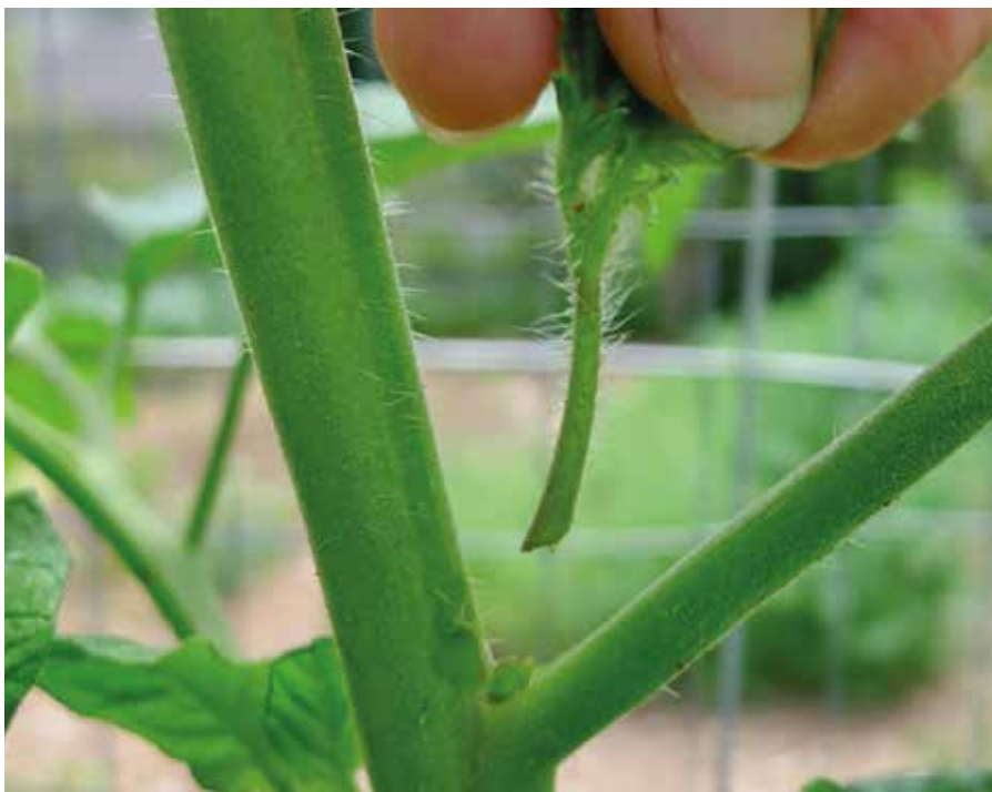
Výhonky pri zaštipovaní odstraňujeme skoro ráno

Dôležitou prácou tohto obdobia je strihanie a zaštipovanie paradajok. Toto opatrenie aplikujeme u tyčových odrôd, bočné výrasty z pazúch listov odstraňujeme týždeň čo týždeň. Ideálne skoro ráno, vtedy je rastlina odolnejšia. Odstraňujeme ich čo najskôr, kým je rastlina mladá, pretože veľkú paradajku môžeme ľahko poraniť. Konáre, ktoré sú nad kvetmi, však nechaj-