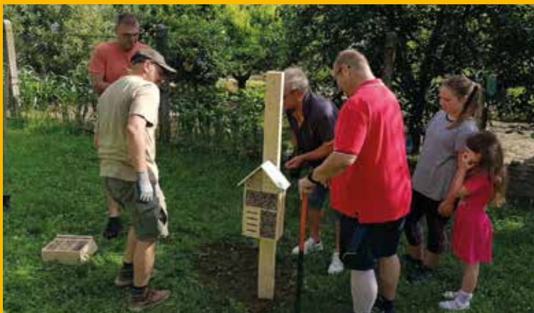
Zatiaľ boli inštalované štyri hotely pre hmyz, projekt pokračuje

„Sme radi, že sa môžeme takouto formou podieľať na ochrane a rozvoji životného prostredia v meste a svojim malým podielom prispieť k zvýšeniu povedomia verejnosti v tejto oblasti“, vyhlásila spoločnosť. Super zoo inštalovalo vo februári 2021 v Šamoríne krímidlá pre vtáky. (l)