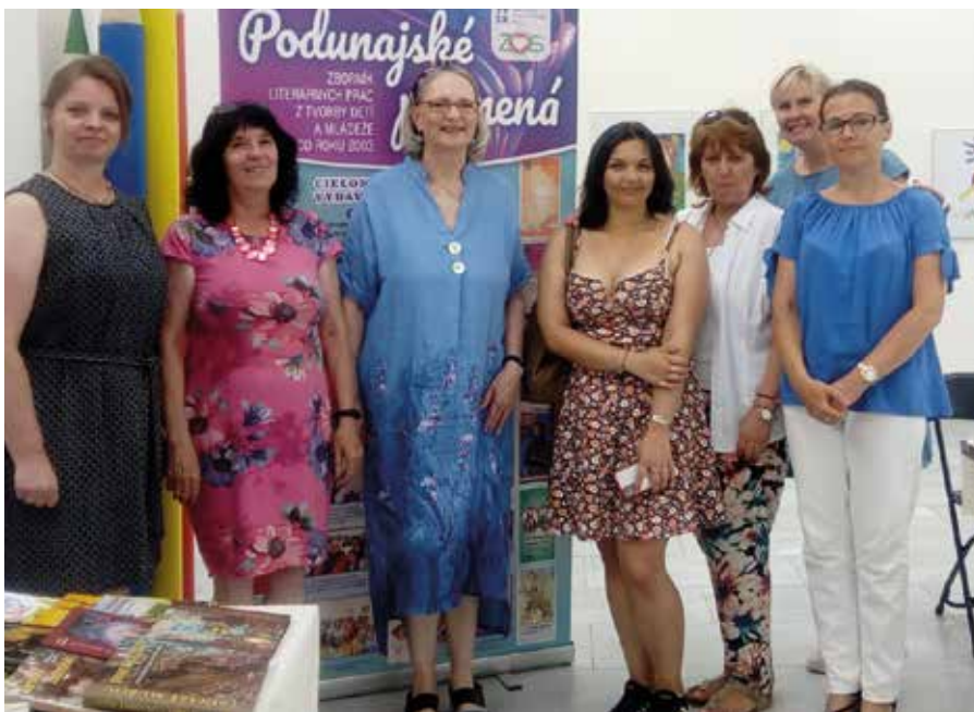
Tohtoročné Podunajské písmená boli nielen ocenením práce našich žiakov a pedagógov, ale aj dôstojnou reprezentáciou celej našej školy