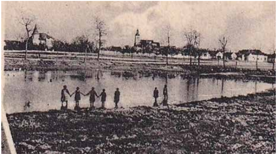
Kedysi mal Šamorín sedem jazierok

Aktuálne druhé popandemické kolo sa konalo 17. júna večer s počtom družstiev 7. Tímy tradične odpovedali na tri kolá otázok na rôznorodé témy. Nechýbali ani