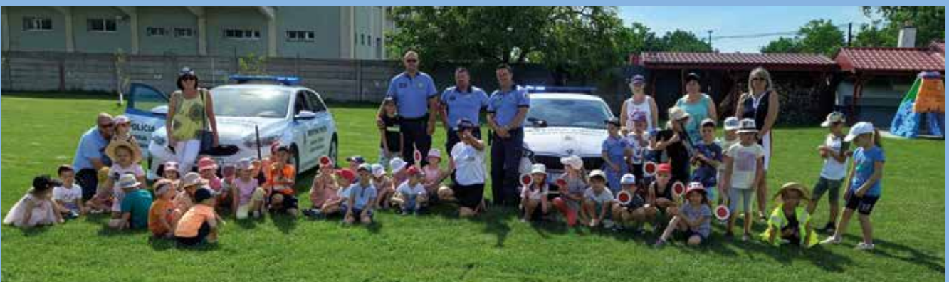
Dňa 27. júna v areáli hasičskej stanice príslušníci mestskej polície a hasiči pripravili pre škôlkarov MŠ Poľovnícka spoločnú ukážku. Podujatie určite zaujalo najmenších, deti obdivovali techniku hasičov. O otázky tiež nebola núdza.

Dažďovník je chránený vták, ktorý obýva škáry starých panelákov. Kvôli masívnemu zateplovaniu sa počet jeho populácií dramaticky znižuje. Združenie BROZ v regióne inštaluje špeciálne umelé hniezda, aby uľahčil dažďovníkom návrat do krajiny. (k)