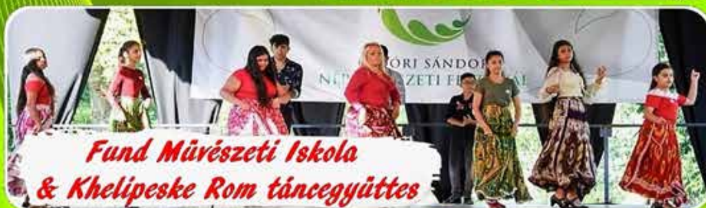
Fund Művészeti Iskola & Khelipeske Rom táncgyűttes