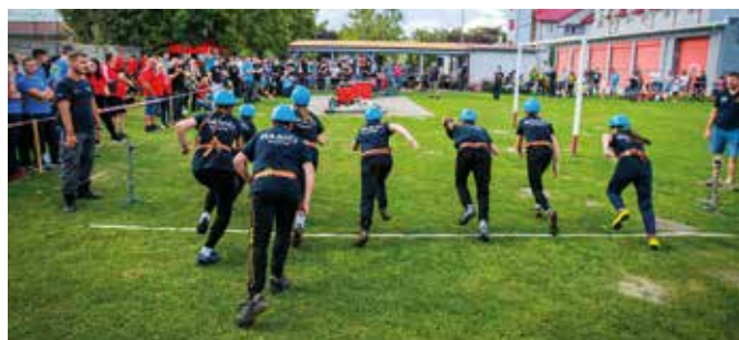
Sily si zmerali aj mládežnícke družstvá

Po súťaži sa hasiči a ich priatelia osviežili a zabávali pri občerstvení a dobrom jedle. Vedenie a členovia zboru sa poďakovali kolegom za podporu a oddanú pomoc pri organizácii podujatia, nakoľko bez ich spolupráce by 30. ročník tejto súťaže nemohol byť úspešný. (s)