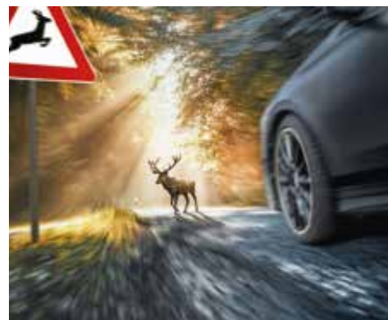
Keď prebehne divé zviera cez cestu, je možné, že ich tam bude aj viac

Ak sa už nevieme zrážke vyhnúť, zavolajme na tiesňovú linku 158. Kto nezavolá políciu a zrazené zviera si zoberie domov, dopúšťa sa trestného činu pytlactva. (k)