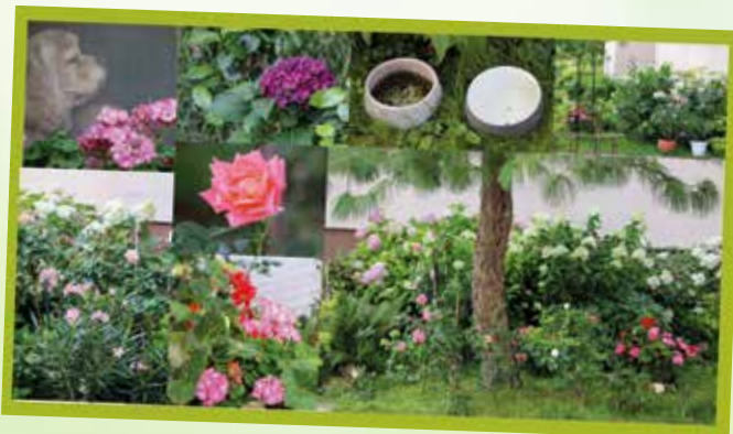
Najkrajšia predzáhradka pred bytovým domom: Jarmila Jáklyová, Dunajská 8 A legszebb tömbház előtti előkert: Jáklyová Jarmila, Duna utca 8.