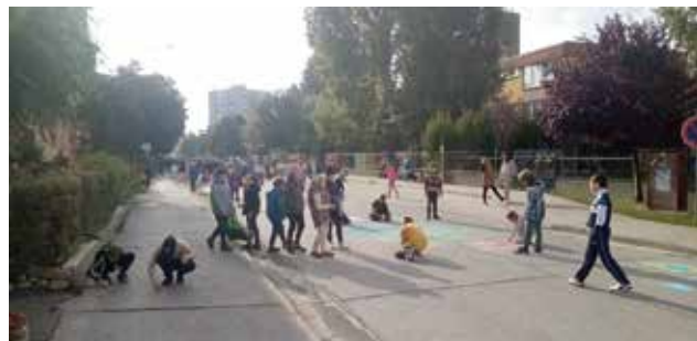
Žiaci ZŠ Mateja Bela vyzdobili svojimi kresbami povrch vozovky na Školskej ulici