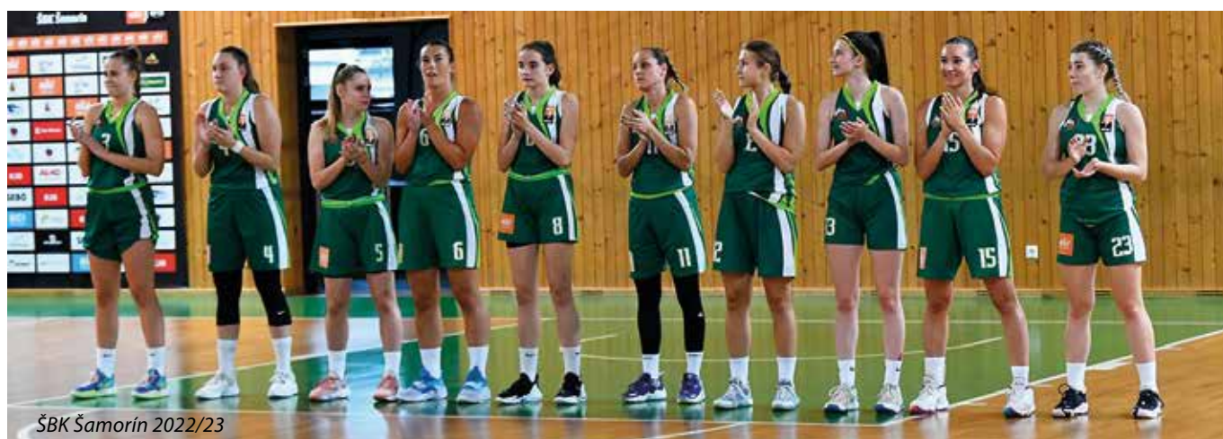
ŠBK Šamorín 2022/23