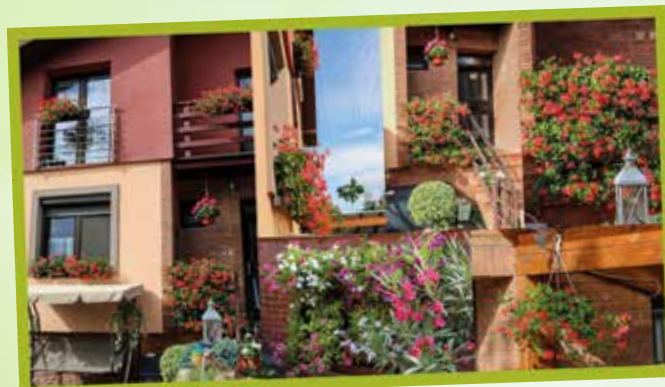
Výherca hlasovania na Facebook-u: Alžbeta Puhová, Bratislavská cesta 100/A A facebookos közönségszavazás nyertese: Puha Erzsébet, Pozsonyi út 100/A – 277 szavazat