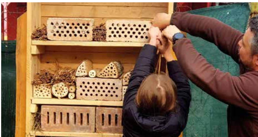
Hmyzie hotely vyhľadávajú najmä samotárske včely