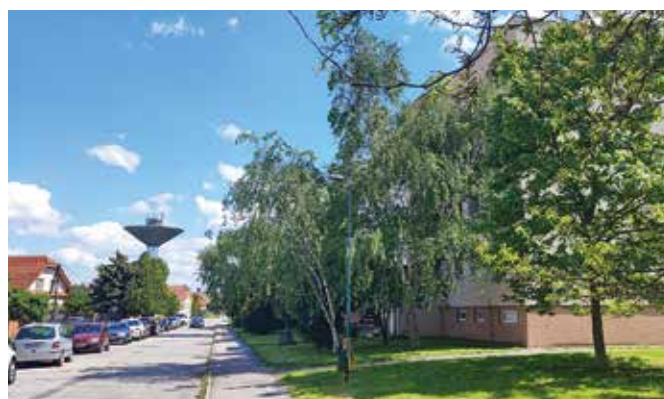
Parkovať sa bude na druhej strane cesty

tu a majitelia blízkych domov nebudú mať pred bránami parkujúce autá. Obyvatelia obytých domov budú zároveň v menšej miere vystavení hluku, vibráciám a prachu z dopravy. Návrh s odbornými argumentmi za túto zmenu bol jednohlasne schválený aj komisiou pre dopravu mestského zastupiteľstva. Dopravná polícia v Dunajskej Strede už vydala súhlasné stanovisko. Realizácia prác začne v máji. (1)