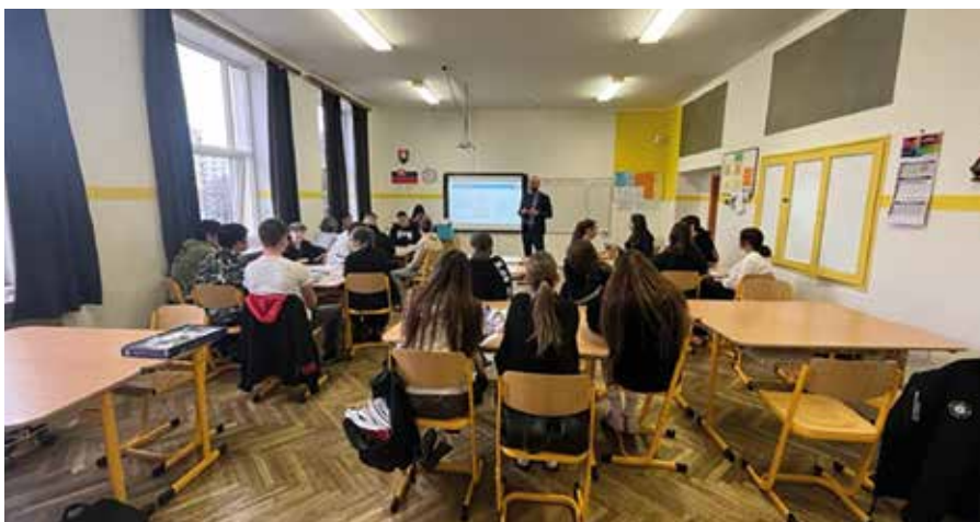
Žiaci sa učili riadiť financie hrou formou