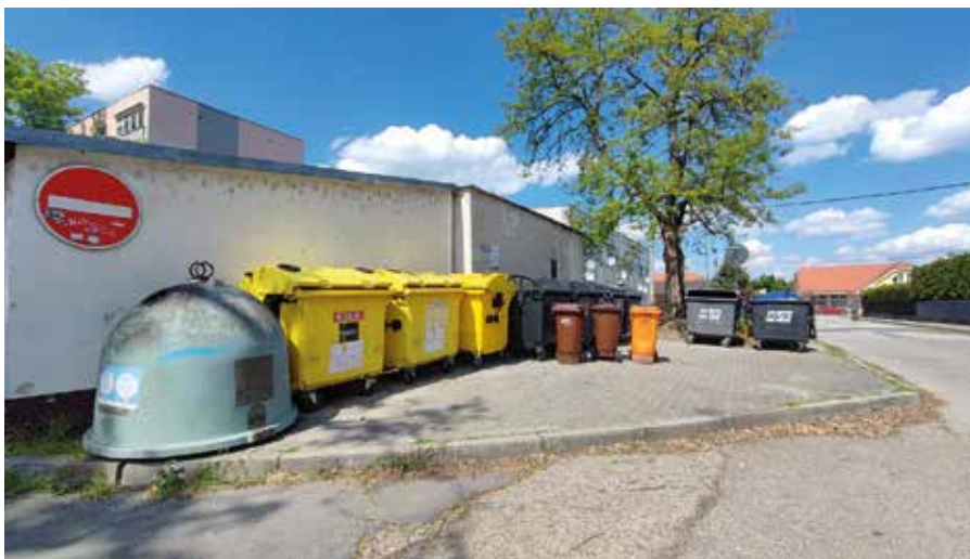
Podmienky na separovaný zber odpadov sú vytvorené

Jarné upratovanie z príležitosti Dňa Zeme bolo v meste usporiadané už 14-krát. Akcie sa zúčastnilo viac ako 120