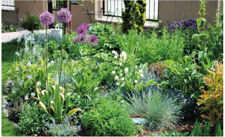
Tavaszi színekbe öltözik a kert

Május elejétől folytathatjuk a hidegre kevésbé érzékeny növények ültetését, vetését, ilyen például a retek, a saláta, a spenót, a cukorborsó, a sárgarépa, a petrezselyem, a paszternák, a burgonya, a csemegekukorica, a cékla, a fűszernövények, a tavaszi virághagymák. A globális felmelegedés hatását mindannyian érezzük, de az óvatosabbak betartják a