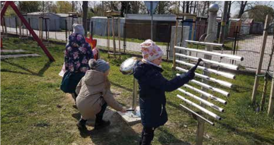
A projekt költségeihez a szülők is hozzájárultak