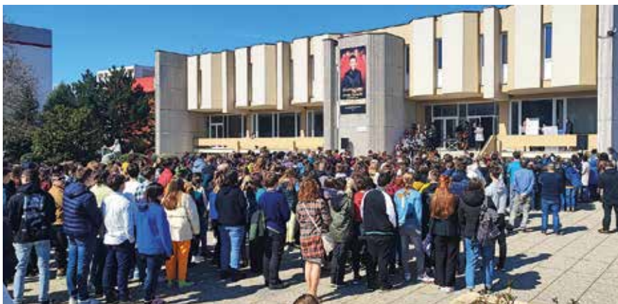
Százak szavaltak együtt a költészet napján