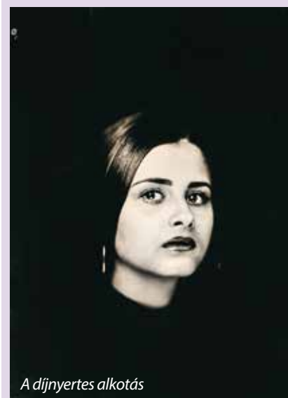
A díjnyertes alkotás