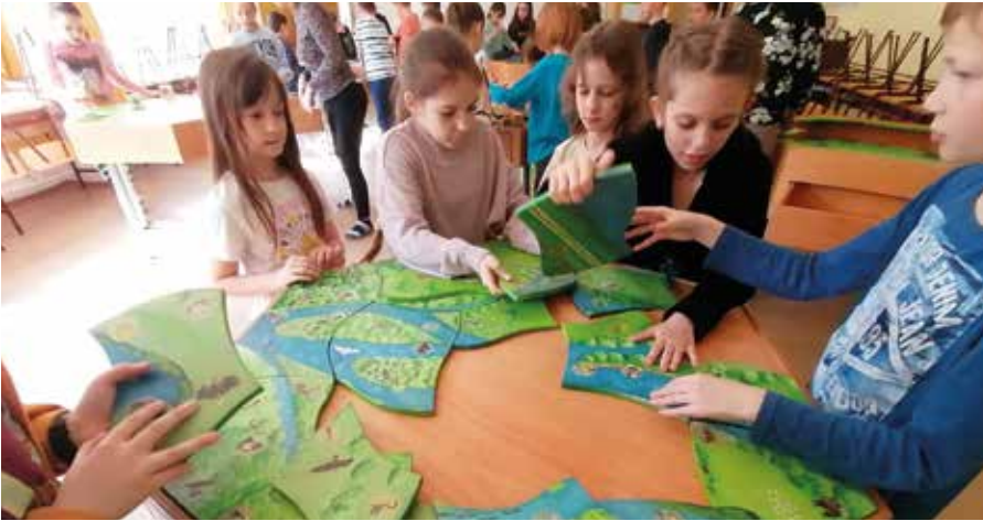
A gyerekek nagyon élvezték a játékos foglalkozásokat