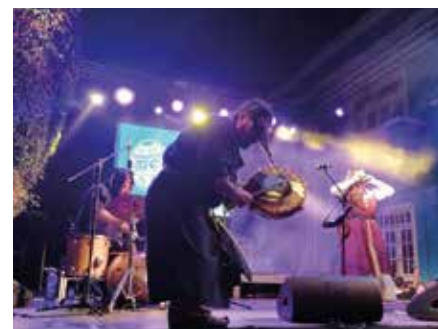
Több fesztiválra is meghívást kapott a zenekar

A fellépés előtt aggódtak a zenekar tagjai, hogyan fogadják a zenéjüket az ottani közönség, hiszen az ő fülüknek idegen lehet a doromb hangja. A fesztiválon fellépő zenekarok inkább lassú, dallamos zenét játszottak, de a közönség annál inkább értékelte azt a kontrasztot, amit a Varkocs hozott a színpadra. „Az aggodalmaink rögtön az első dal után elszálltak, nagy tapssal fogadott bennünket a közönség. Interjút adtunk a helyi televíziónak, a műsorvezető úgy fogalmazott, azért sze-