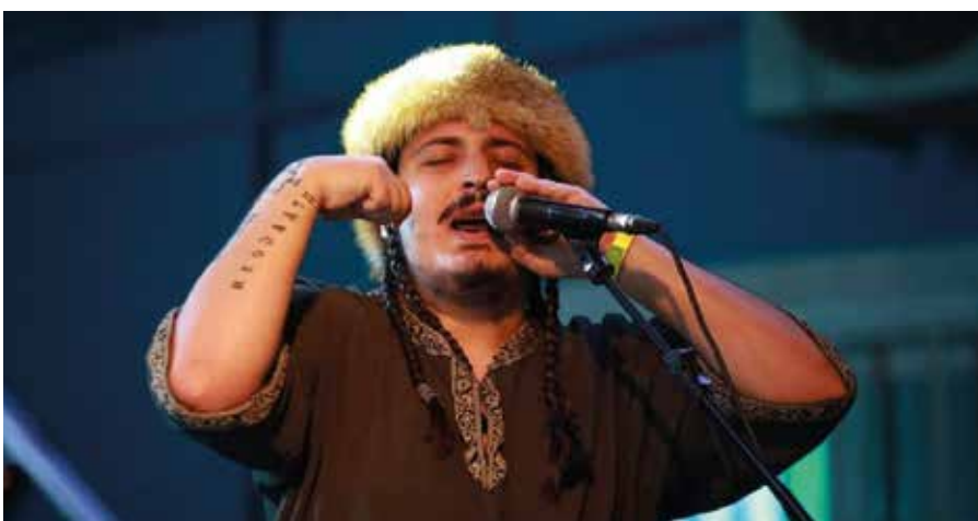
A közönség nagy tapssal fogadta a különleges hangzásvilágot

„Amikor a Zöld-foki-szigetekre megérkeztünk, rögtön világos volt, hogy ez egy