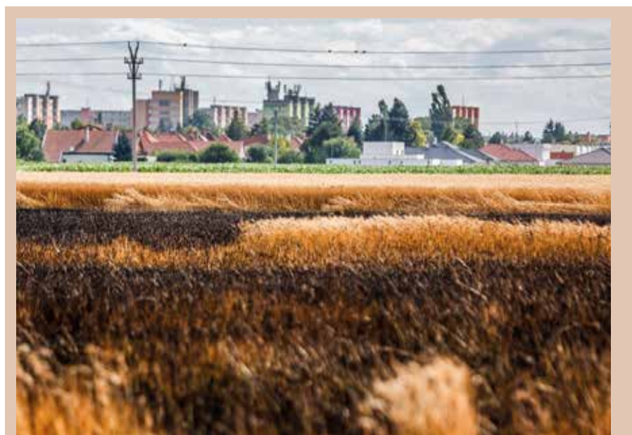
Július 2-án délután égett a gabona városunk határában, a régi Úszori útnál. A lángok megfékezésében a dunaszerdahelyi és a somorjai hivatásos tűzoltók mellett a somorjai, a tejfalusi és a nagypakai önkéntesek is részt vettek. A mintegy másfél hektáron pusztító tűz keletkezésének okát még vizsgálják.

A rendőrség és a nyitrai polgári védelem munkatársai is kivonultak a területre, hogy a levegő minőségét ellenőrizzék. Nem mutatták ki a levegőben a veszélyes anyagok megnövekedett koncentrációját, így a környéken lakók nem voltak veszélyben. (k)