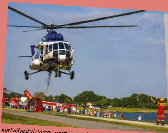
A körtvélyesi víztározó partján érdekes bemutatók zajlottak földön, vízben és levegőben