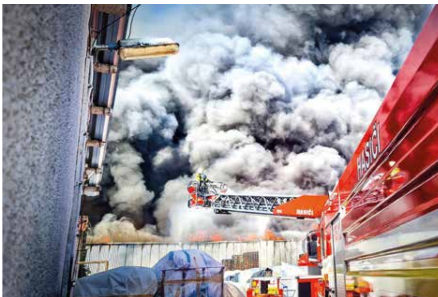
A raktárépületben 700 tonna műanyag és 1500 fa raklap égett