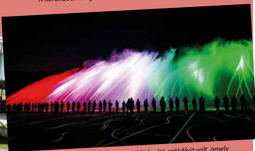
A rendezvény csúcspontja a zenélő tűzoltó-szökőkút volt, amely bekerült a Szlovák Rekordok Könyvébe

Kedves olvasóink, lapunk legközelebb 2023. szeptember 12-én jelenik meg.