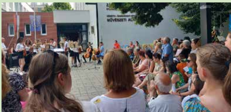
Idén is nagy sikere volt a szabadtéri koncertnek

A szabadtéri koncertet és kiállítást tavaly rendezték meg először, és a sikeren felbuzdulva idén is a gyönyörű hársfák alatt zajlott a rendezvény. A képzőművészeti alkotásokat a hársfákra akasztották, az énekesek és a muzikusok a bejárat előtti téren léptek fel. Több mint 15 műsorszámmal kedveskedtek a közönségnek a fellépők, a színvonalas rendezvény megszervezéséért elismerés illeti a gyerekeket, de az iskola vezetését és pedagógusait is. (s)