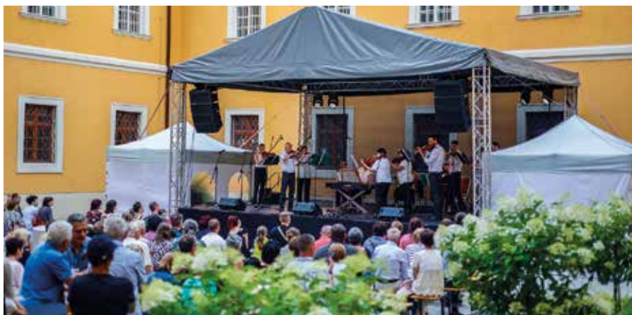
A Harmonia Classica kamaragyüttes is nagy sikerű koncertet adott a rendezvény során