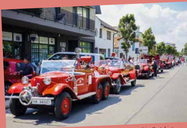
A kiállított eszközök, berendezések lenyűgözték a kicsiket és a nagyokat is

Több száz kiállított történelmi és modern tűzoltótechnikai berendezés, bemutatók tucatjai, történelmi kiállítások, fúvószenekari koncertek, pazar felvonulás, valamint egy sikeres rekordkíséret. Erről is szólt a június 16-án és 17-én ötödik alkalommal megrendezett Így oltották a tüzet elődeink című történelmi tűzoltótechnikai kiállítást, amelynek hangulatát most Szinghoffer Máttyás felvételeivel idézzük meg.