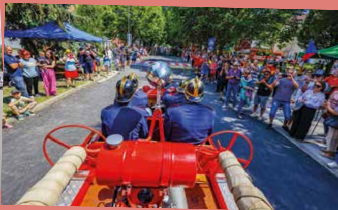
Az ünnepi felvonulást több százan kísérték figyelemmel