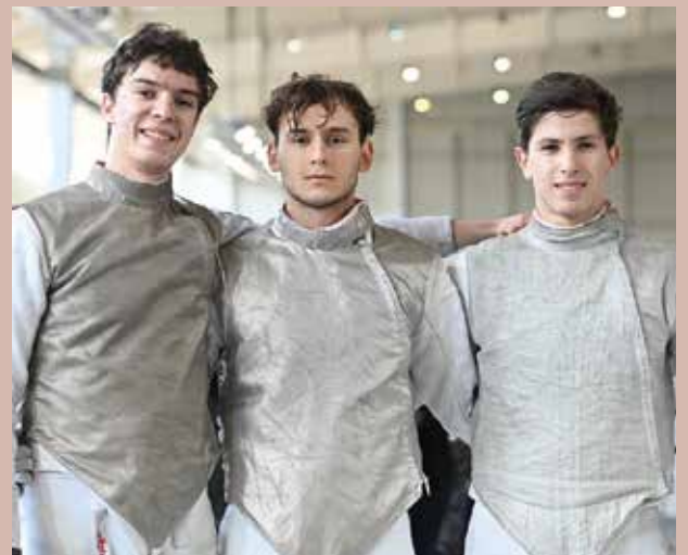
A somorjai junior vívók júniusban az Európa-Bajnokságon, majd az Európai Játékokon vettek részt. Az idény azonban még nem ért véget számukra, július második felében a világ-bajnokság vár rájuk.