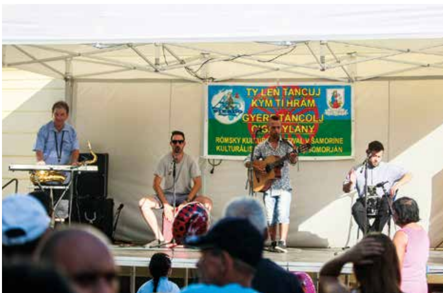
Idén is neves fellépők várják a közönséget