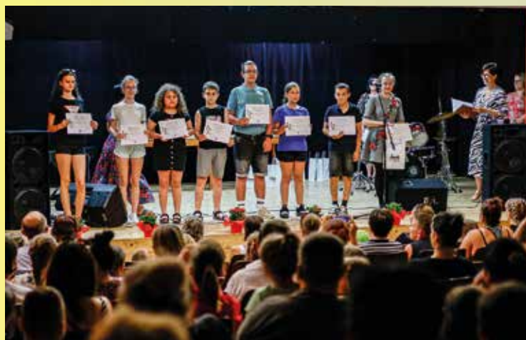
A IV. kategória résztvevői