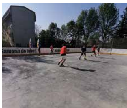
A somorjai floorball-pálya

A somorjai városvezetés nagyon fontosnak tartja a sportot, az önkormányzat kiemelten támogatja a klubokat, üzemelteti a sportlétesítményeket. Az elmúlt hetekben újabb sportpályákat adtak át, amelyeket már használatba is vettek a lakosaink.