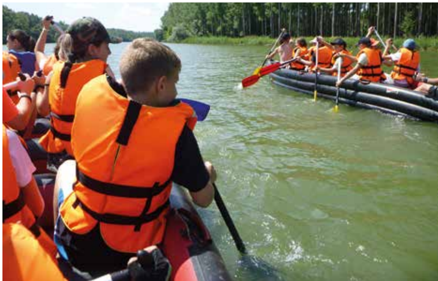
Mesés tájakon eveztek a somorjai iskolások

ra is, így várható, hogy a projekt lezárulta után megmarad az iskolák érdeklődése. A Korvin alapiskola egyik osztálya pedig a szivárgócsatornán Gútorig evezett és mivel az időjárás lehetővé tette, a víztárolón keresztül tértek haza. A csónaktúrák szervezését megkönnyíti, hogy az említett iskolák több pedagógusa már korábban részt vett kormányos tanfolyamon, így segítségükkel biztonsággal vízre vihetők a diákok. (tl)