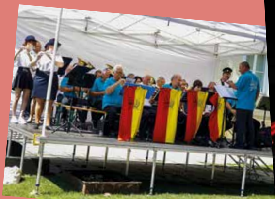
A kétnapos rendezvényen a SÖTT fúvószenekara is fellépett