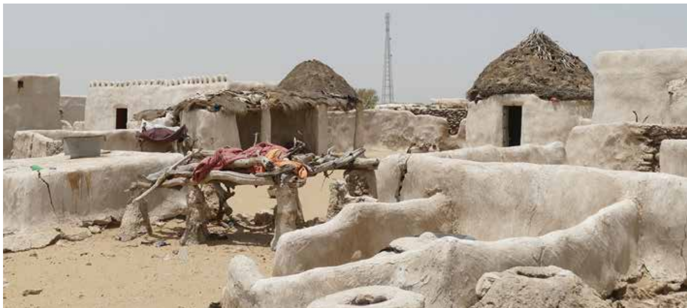
Ezeréves kultúra a pakisztáni Cholisztán sivatagban

Vajon akarunk-e, képesek leszünk-e változtatni ezen, mielőtt túl késő lesz? – fogalmazza meg a kérdést a két világotutazó, elkötelezett környezetvédő, aki a biodiverzitás állapotának, az ember és a természet viszonyának megfigyelését tűzte ki célul. Útjukról, tapasztalataikról a www.biking4biodiversity.org honlapon számolnak be bővebben, angol nyelven. (ö,s)