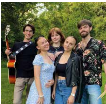
A Zümzüm együttes rendszeresen fellép a város rendezvényein is