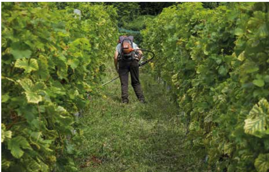
A kártevőktől permetezéssel védhetjük a szőlőt

Nagy kárt okozhatnak a káposztafélékben előforduló levélbolhák, levéltetvek és a lisztecsek. Ellenük Karate Zeon, Sanium Utra és Neemazal TS rovarölővel védekezhetünk. Fontos, hogy a permetbe keverjünk tapadószert (Silwet Star vagy Agrovital). A permetezést ajánlott pár nap után megismételni, ugyanis ezek a kártevők rendkívül szaporák, és az újabb kikelt egyedek újból károsítanak.