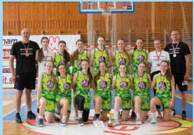
Az U12-es csapat után az U17-es kosaras lányok is bronzérmesek lettek a szlovák bajnokságban. A kassai döntőtornán előbb 73:45-re legyőzték a Pöstyént, majd az elődöntőben 54:81-es vereséget szenvedtek Rózsahegytől. A Slovant azonban 72:53-ra lelépték, és megérdemelten lettek harmadikok.