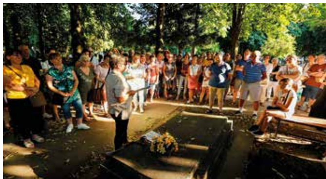
Fiatalok és idősebbek egyaránt részt vettek a temetésén