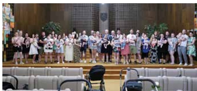
2022 novembere és 2023 márciusa között 39 gyerek született (Képtárház)

Városunk lakosainak a száma az említett időszakban 39 fővel gyarapodott. (1)