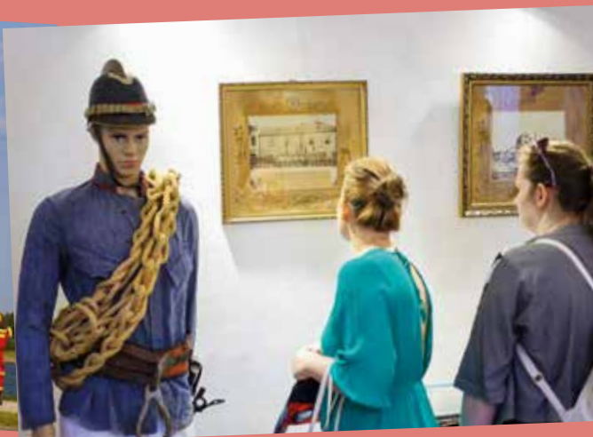
A Koronában megrendezett kiállítás a SÖTT 150. évét ölelte fel