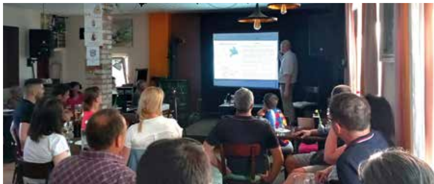
Érdekes dolgokat tudhatott meg a hallgatóság a nagyságos fejedelemről (Képcarchívum)