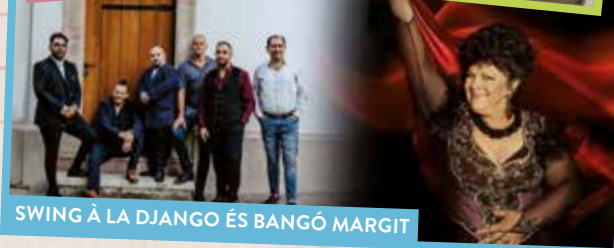
SWING À LA DJANGO ÉS BANGÓ MARGIT