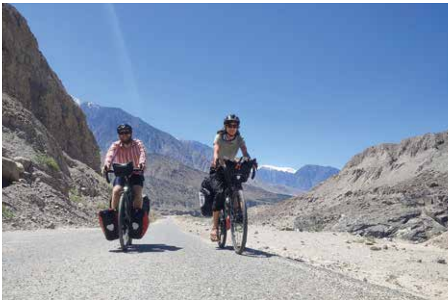
Paikisztán – ahol a Himalája, a Karakorom és a Hindukus összeér

És mégis bőségben élünk. Az anyagi gazdagságot és biztonságot időre és rugalmasságra cseréltük. Van időnk azt tenni, amihez kedvünk van. Új tudást szerezni az által, hogy már 13 országban több mint 200 természetvédő történetét ismerhetjük meg, nem beszélve a még annál is több emberrel, akikkel az útjaink keresztelték egymást. Csak a legszükségesebbre költünk, és a jelenben élünk, a jelen pedig Indiában nagyon sok új tanulsággal szolgál. Az elmúlt öt hónap alatt beutaztuk Nepált, Pakisztánt és a hatalmas India egy kis szejtét. Megismerkedtünk az első nyolcezreinkkel a Himalájában, zötykölődtünk a monszuntól áztatott nepáli utakon, bicikliztünk a pakisztáni Cholistan sivatagban, homokviharban,