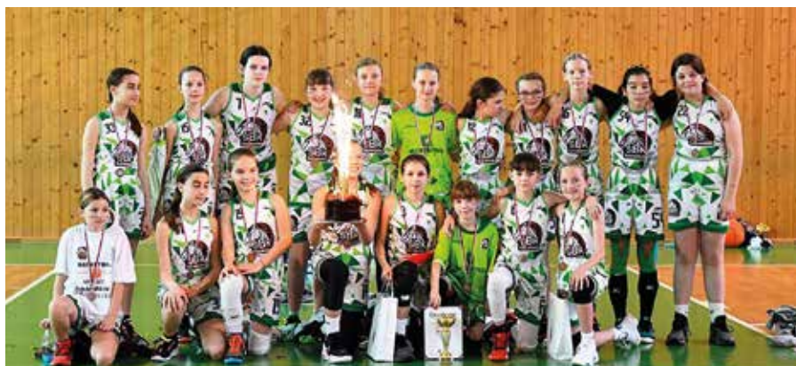
Bronzové družstvo ŠBK Šamorín U12

K ďalším úspešným klubom v roku 2023 patrí okrem vyššie menovaných aj Budokan Samaria, Kyokushin Karate