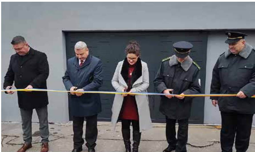
Slávnostné otvorenie stálej expozície historickej hasičskej techniky