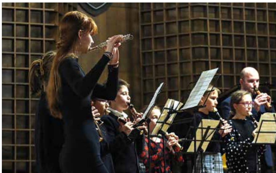
Koncert žiakov zožal veľký úspech