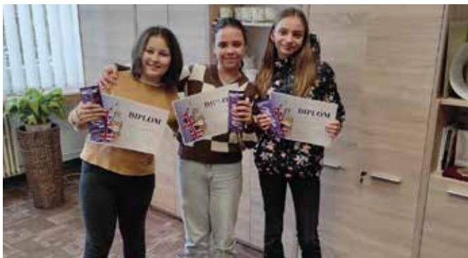
Vítazky školského kola