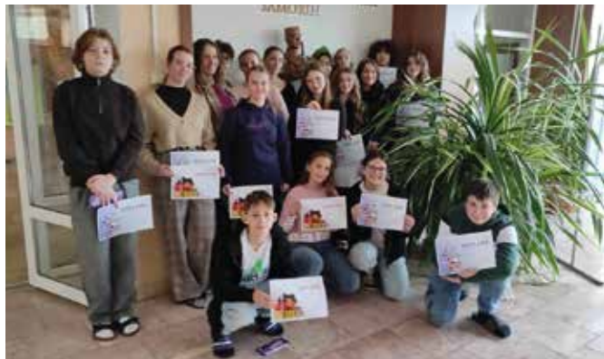
Účastníci olympiád v anglickom a nemeckom jazyku

Žiaci umiestnení na 1. miestach postupujú na okresné kolo a dňa 17. januára 2024 si zmerajú sily s inými súťažiacimi z okresu. Držíme im palce, aby z okresného kola postúpili a vo februári úspešne reprezentovali školu aj na krajských kolách v Trnave. (lmh)