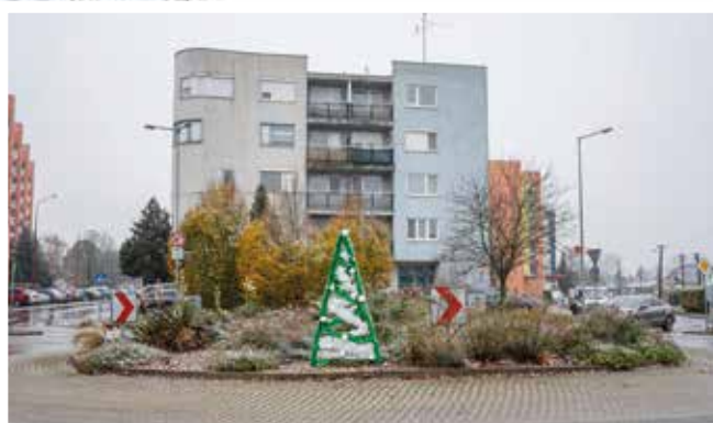
Kruhový objazd na Rybárskej ulici: Základná škola s VJM M. Korvína