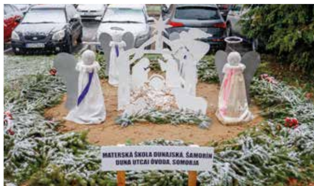
Priestor pred mestským úradom: Materská škola na Dunajskej ulici - anjel