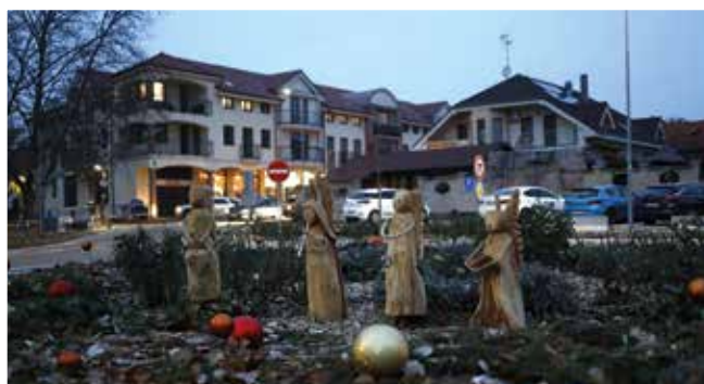
Kruhový objazd na Čilistovskej ceste: Materská škola na Ulici Márie