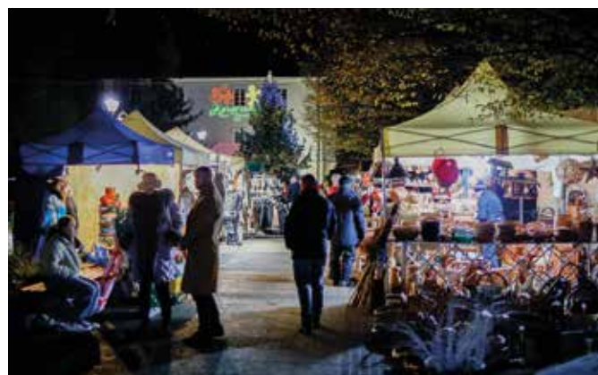
Vianočné trhy na Hlavnom námestí v Šamoríne v dňoch 7-9. decembra sa niesli v duchu očakávania vianočných sviatkov. Hlavnou atrakciou trhov boli remeselnícke a handmade výrobky, široká ponuka dobrôt. O kvalitný sprievodný program sa tento rok postarali Tanečná skupina Sími Dance, kapely Paper Moon Trio, Kaptza, spevácky zbor ZUŠ Štefana Németha-Šamorínskeho, Samaria Klezmer Band, Candymen Duo a predstavili aj hudobno-zábavný program Frozen.