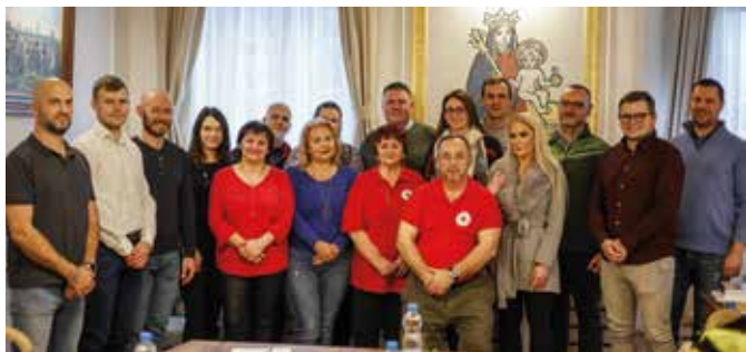
Primátor s najaktívnejšími darcami krvi