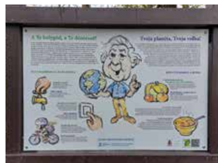
Informačný panel náučného chodníka na ceste Štvrťiny

Cieľom projektu je zvýšiť ekologické povedomie obyvateľov, pripraviť pre miestne školy nové možnosti výuky, doplniť turistickú infraštruktúru územia a zvýšiť atraktivitu Žitného ostrova. Časť projektu je zameraná na vytvorenie 350 m dlhého náučného chodníka na území nášho mesta, ktorý sa tiahne popri čilistovskom úseku cyklotrasy. Združenie umiestnilo k cyklotrase štyri informačné panely, ktoré poukazujú na dôležitosť ochrany životného prostredia. Grafický návrh panelov pripravil šamorín-