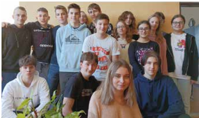
Do súťaže iBorbor sa zapojilo veľa študentov

Hlavným cieľom súťaže iBorbor, založenej v roku 2004 v Litve, je podporiť záujem o informačné a komunikačné technológie u všetkých žiakov. Súťaž chce deti podnietiť kreatívne a intenzívne využívať moderné technológie vo vzdelaní. (gmsr)