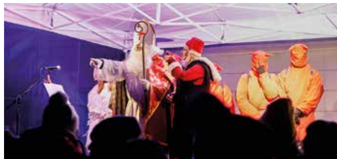
6. decembra zavítal Mikuláš aj do nášho mesta, aby rozsvietil mestský vianočný stromček. Hlavné námestie bolo aj tentokrát plné vzrušenými a radujúcimi sa detičkami a po meste sa šírila vianočná nálada. Sviatočné osvetlenie a výzdoba Hlavného námestia ešte umocnila predvianočnú atmosféru. Mikuláš mal so sebou niekoľko vriec darčiekov, z ktorých sa samozrejme každému ušlo.

Samospráva nášho mesta zároveň každoročne udeľuje najaktívnejším darcom krvi zo Šamorína aj peňažnú odmenu. (I)