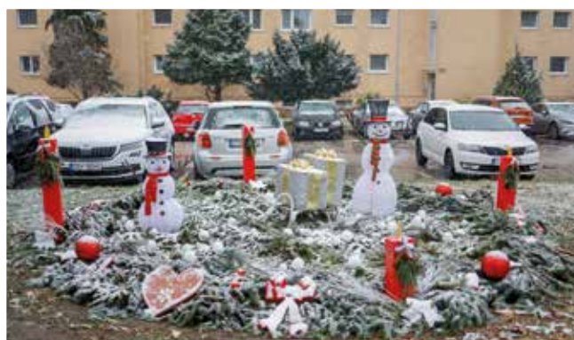
Priestor pred mestským úradom: Základná škola Mateja Bela