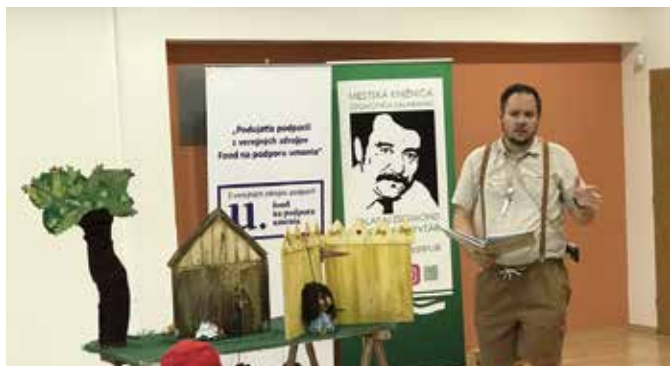
Zájazdové divadlo Spoza Voza