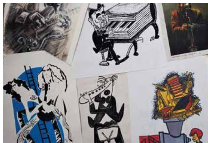
V aule Mestského kultúrneho strediska v Šamoríne sa konala medzinárodná výstava karikatúr s názvom Hudba v krivom zrkadle. Výstava priniesla najlepšie vtipné ilustrácie od autorov z krajín višegradskej štvorky.