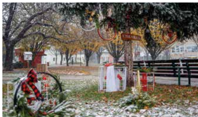
Park na Hlavnom námestí: Jasle a materská škola Kiskakas