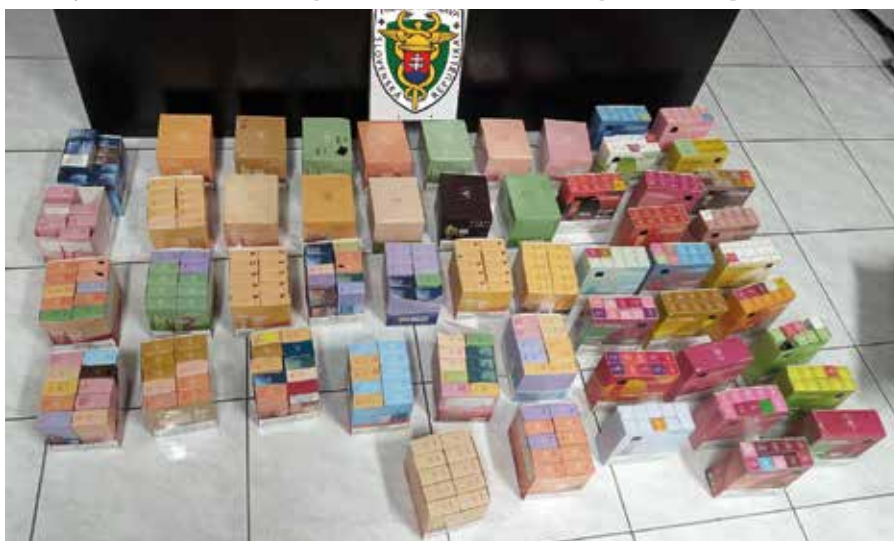
Napodobeniny elektronických cigariet zaistené v Šamoríne