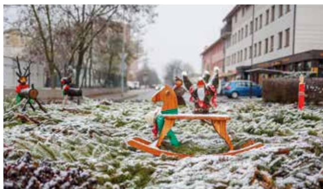
Kruhový objazd na Hlbokej ulici: Materská škola na Školskej ulici

Adventná výzdoba pripravená pedagogičkami škôlok a škôl nášho mesta sa už počas posledného novembrového týždňa dostala na najfrekventovanejšie časti nášho mesta - na kruhové objazdy, na Hlavné námestie a na plochu pred mestským úradom. Aj touto cestou ďakujeme, že nám priniesli vianočnú atmosféru priamo do ulíc Šamorína.