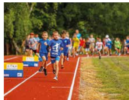
Vynovená atletická dráha

Atletická dráha na dvore ZŠ Mateja Korvína dostala nový tartanový povrch a boli tu vybudované aj sektory na skok do diaľky a vrh guľou. Investícia sa uskutočnila za podpory Fondu na podporu športu a samosprávy Šamorína. Aj túto dráhu využívajú doobeda žiaci, neskôr počas dňa obyvatelia mesta.