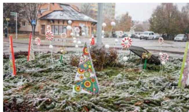
Kruhový objazd pred MsKS: ZUŠ Štefana Németha-Šamorínskeho