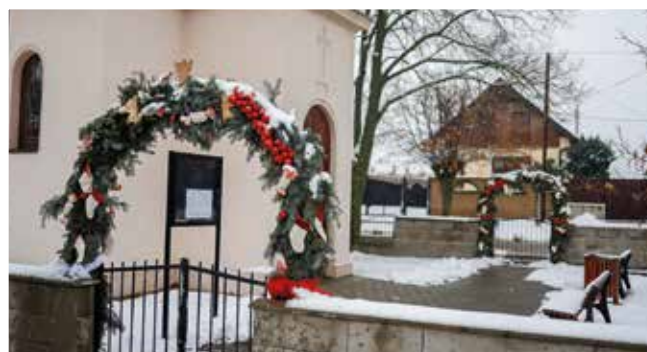
Mliečno: Základná škola s VJM v Mliečne