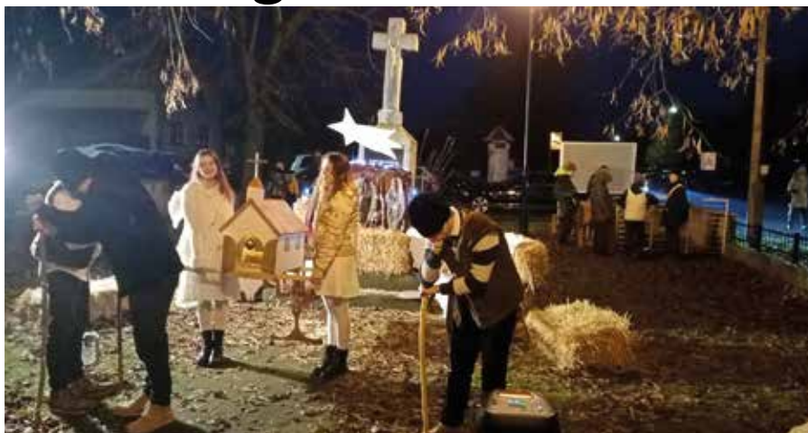
Hamisítatlan karácsonyi hangulatot varázsoltak a gimnazisták