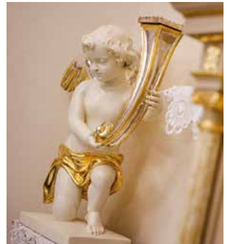
A szobrokat a legújabb technológiával újították fel

„2013 tavaszán szólított meg Nagy József képviselő, hogy a 100. évforduló alkalmából szeretnék újracsenteltetni a kápolnát, és segítenék-e restauráltatni az oltár és a falak melletti piedesztákon álló szobrokat - mondta a neve elhallgatását kérő somorjai adakozó. - Elvállaltam, majd hosszas keresés után felvettem a kapcsolatot egy idős karcsai műbútorasztalossal, aki több oltárt is felújít-