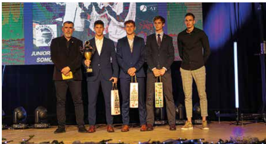
A legjobb csapat: a Somorjai Vívó Klub juniorjai