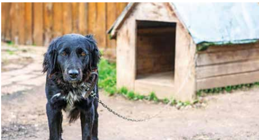
Minden gazdinak meg kell értenie, hogy a láncon tartás már nem elfogadható

„A veszélyes fajtákat kivéve tilos a kutyákat megkötni. Ez nem érvényes a vemhesség utolsó harmadában levő, a kicsi-