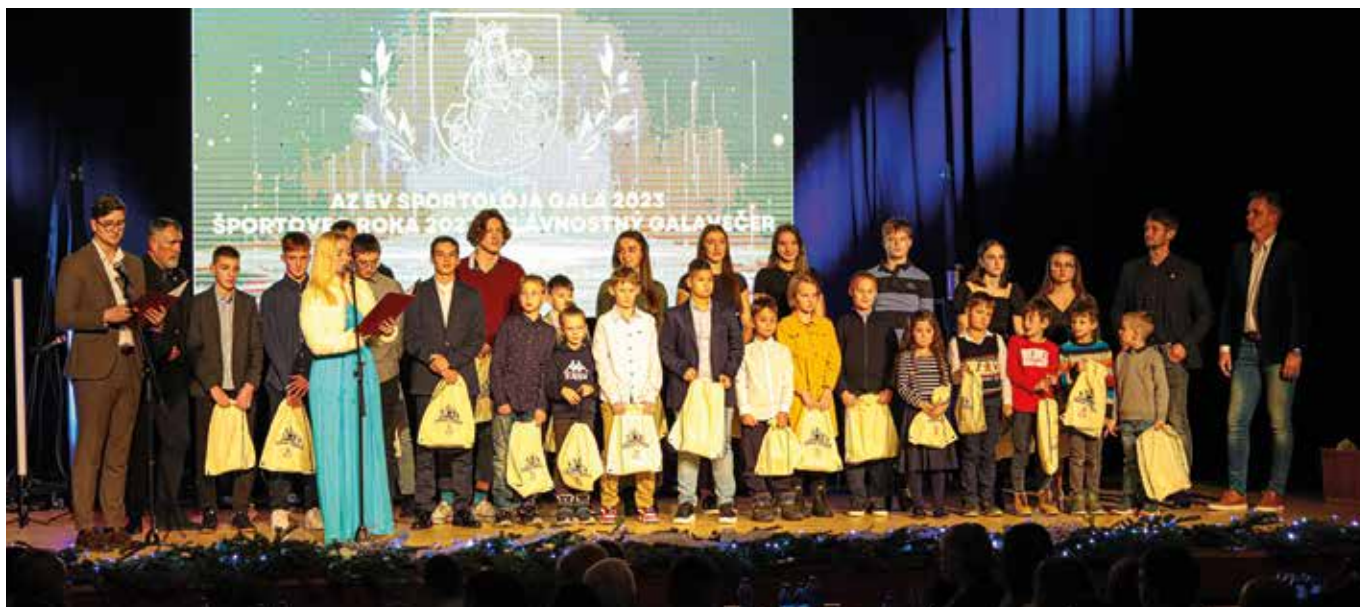
Városunkban nagyon sok a tehetséges fiatal sportoló