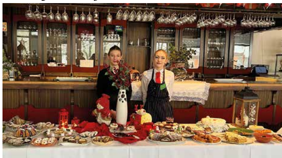
Az iskola diákjai megmutatták, mit tanultak