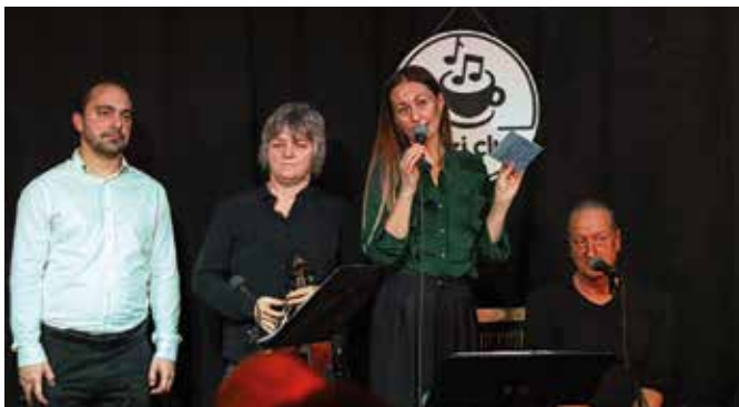
Új lemeze anyagát is bemutatta a zenekar