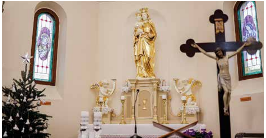
Az oltárt egy karcsai műbútorasztalos restaurálta