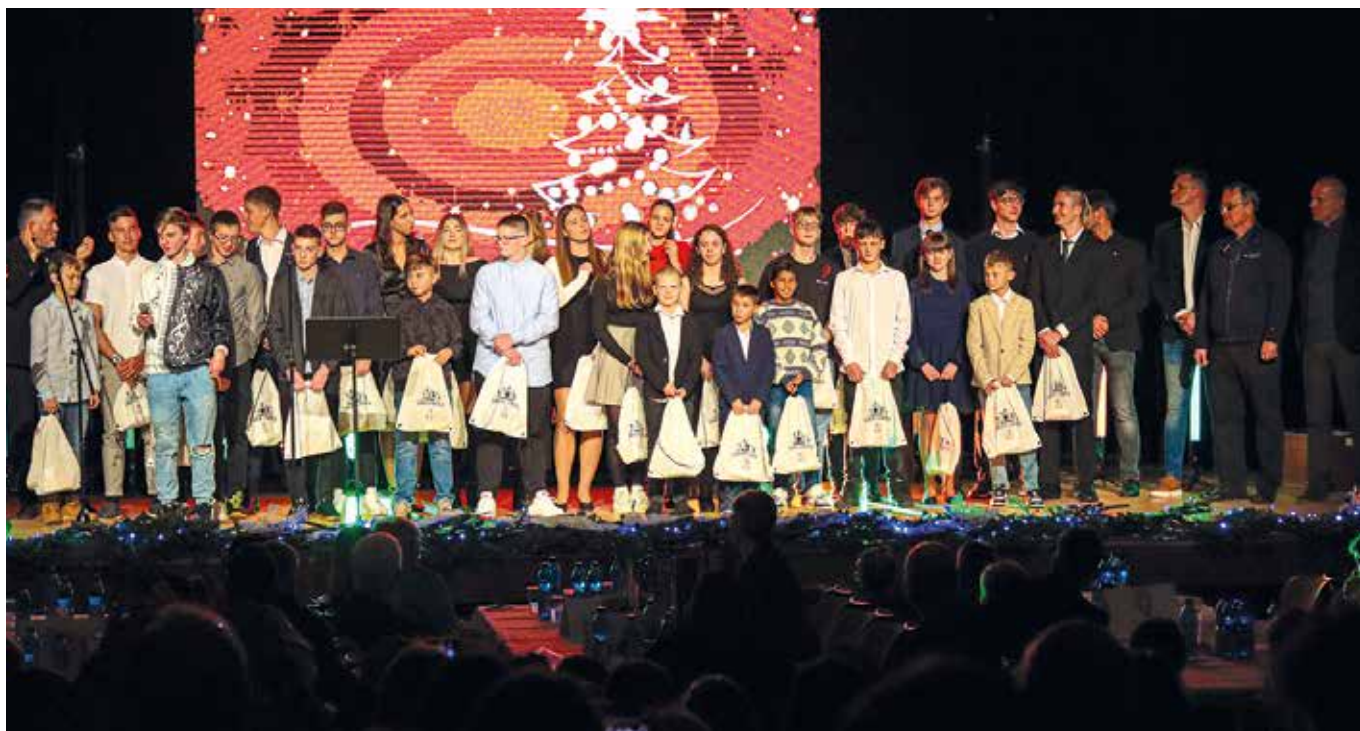
Somorja legjobb sportolóit ünnepelte a közönség. Írásunk a 10. oldalon.