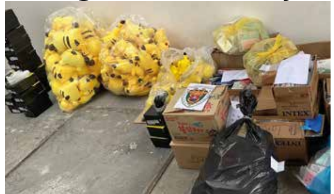
Ismert márkák hamisítványai akadtak horogra

ványaiból akarnak illegálisan hasznot húzni, az áru megsemmisítésén kívül büntetőjogi felelősségre vonják, és a vámhivatal 67 ezer euróig terjedő pénzbírságot szabhat ki rájuk” - közölte a szóvivő. A törvény ismételt megsértéséért akár 135 ezer euróig terjedhet a bírság. A vámhivatal figyelmeztetett arra, hogy a hamisított termékek az előállításuk, a minőségük vagy az összetételük miatt az egészségre is veszélyesek lehetnek.