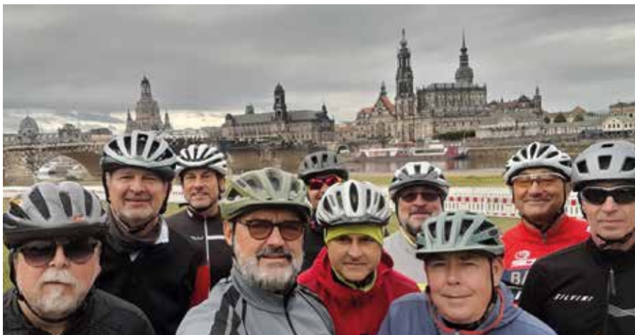
A csapat Drezdában, az óváros látképevel

Este a kokoříni völgyben, egy kisvendéglőben várt bennünket a finom vacsora. A túra