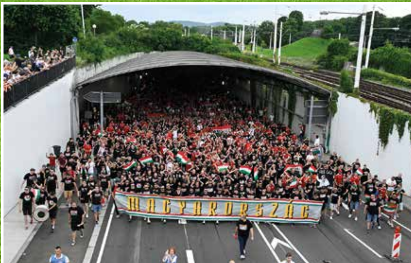
A németországi fociünnep a remek szurkolók miatt is emlékezetes marad: magyarok vonulásáról, a hollandok táncáról, vagy a skótok barátságáról.