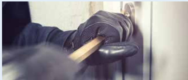
A betöréssel nagyobb károkat okoztak, mint a lopással

„Nem is a lopással, hanem a rongálással okozott nagyobb kárt az illető, ami mintegy 200 euróra tehető. A felvételek alapján egyértelműen azonosítottuk a férfit, a városi rendőrök még aznap előállították, de ő váltig