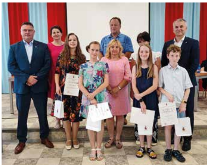
A városvezetés is gratulált az iskolásoknak

A testület ezt követően elfogadta a város 2023-as évi