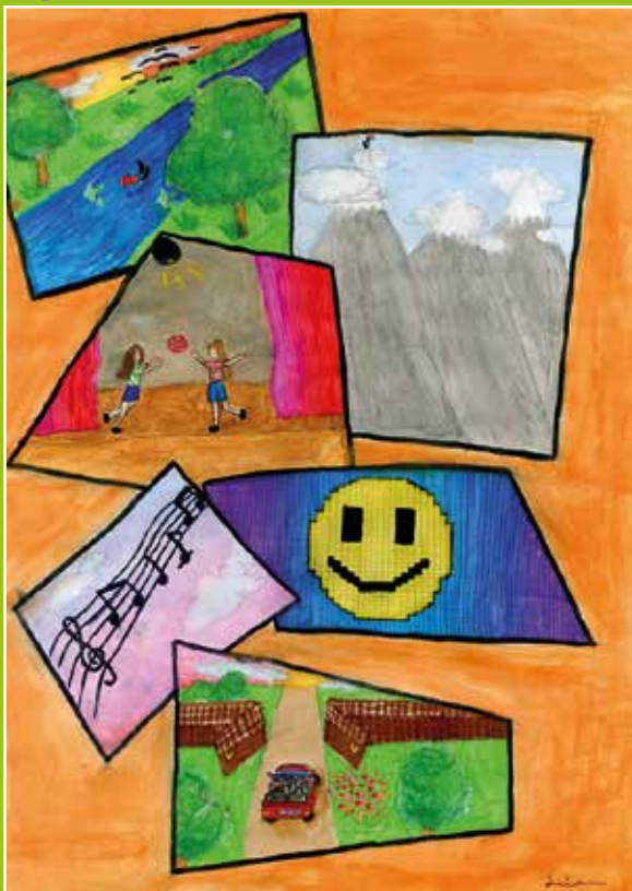
Óváry Lilla illusztrációja

Az élet olyan, mint egy végtelen folyó, Áramlik, sodródik, soha nem áll meg. Napfényben ragyog, holdfényben álmodozik, És mindig új kalandokat tartogat magában.