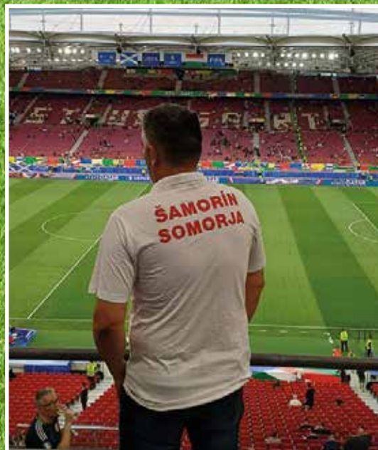
Somorja is jelen volt a stadionokban