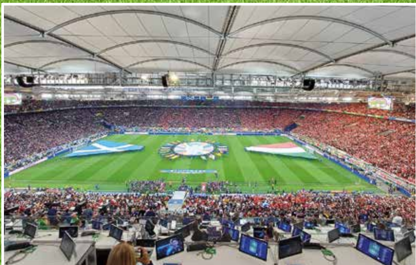
A 2024-es Európa-bajnokság meccseit gyönyörű stadionokban rendezték meg. Sok helyen azonban gondot okozott a pálya talaja.