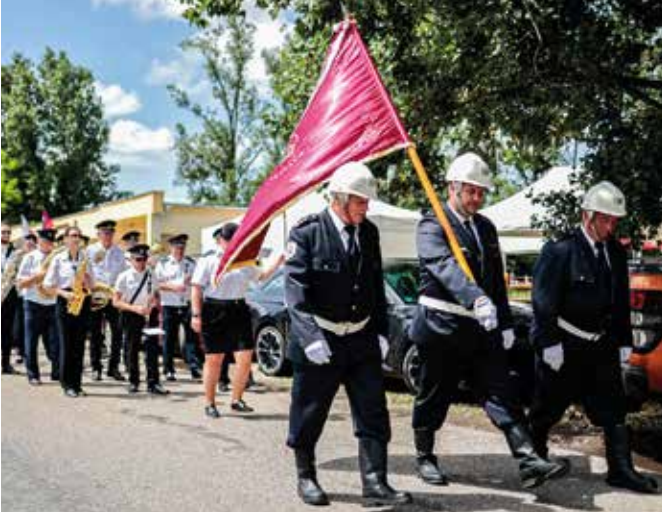
A fűvósok muzsikájától volt hangos a környék (Képarcívum)