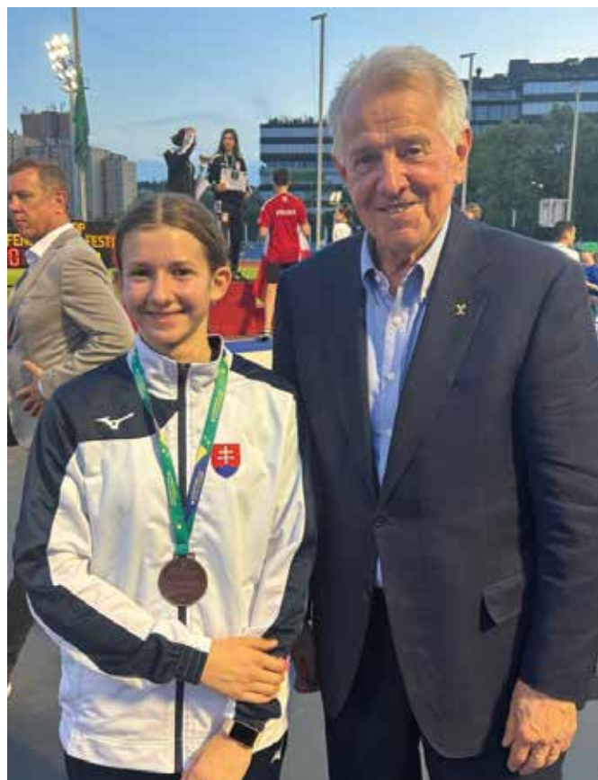
Blanka az egykori magyar köztársasági elnökkel és olimpiai érmessel, Schmitt Pállal (Képtár) (Képtár)

A budapesti program több pontját, például az eredményhirdetést a Testnevelési Egyetem sportudvarán rendezték meg, több olimpiai bajnok jelenlétében. Többek között Schmitt Pál a Nemzet sportolója, kétszeres olimpiai bajnok, a Magyar Olimpiai Bizottság elnöke, két évig Magyarország köztársasági elnöke is ott volt, Blanka is találkozott vele. „Az elnök úr kérdezett az eddigi pályafutásomról és további sok sikert kívánt. Nagy megtiszteltetés és motiváció volt számomra, hogy egy ilyen jelentős személyiséggel találkozhattam” - mondta a somorjai vívó, akinek a személyi edzője Forgách Péter.