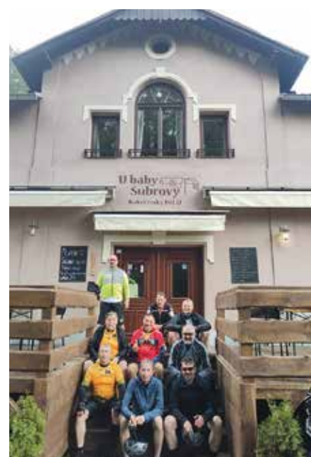
Az első cseh szállásnál