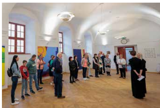
Augusztus első feléig tekinthető meg a kiállítás (Képarcívum)

Művészi témakeresését jelentősen befolyásolta Anna Beata Háblová cseh urbanista műépítész, akinek hatására elkezdett foglalkozni az üresen álló, lelakott és elhanyagolt építményekkel, kihasználatlan területekkel, tárgyakkal. Ezeknek az objektumoknak a különleges láttatása, felújításuk, újrahasznosításuk került munkája fókuszába. Bodó Éva alkotásaiban igyekszik felbontani, megtörni a geometriai szabályosságot. Különleges érzékkel