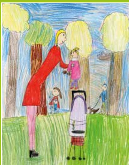
Lőrinczi Mirella illusztrációja