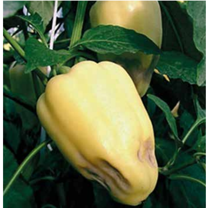
A paprika foltosodását a kalciumhiány okozhatja (Képtárház)

Az augusztus az új eperpalánták telepítésének az ideje. Gondosan előkészítjük a talajt, felássuk, jól fellazítjuk. Ezután megtrágyazzuk komposzt, illetve granulált tehéntrágya hozzáadásával. Az eperágyás letakarására fekete fátlyófia használata ajánlott, amely védelmet nyújt a gyomok ellen és a termések nem sávozódhatnak be.