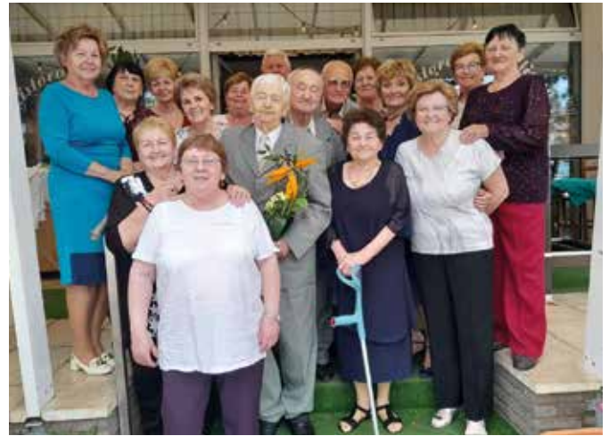
Az 55 évvel ezelőtt érettségizett 3. A osztály