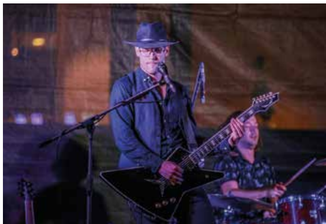
A The Butchers koncertjén