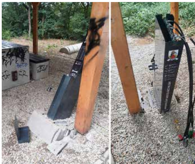
Komoly anyagi károkat okoznak a rongálással

Az érdekes kiállítás augusztus első feléig tekinthető meg az egykori kolostor földszinti dísztermében. (s)