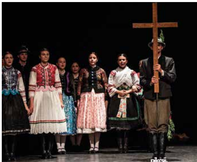
Érettségire, felvételire készülés közben is próbálták a táncosok