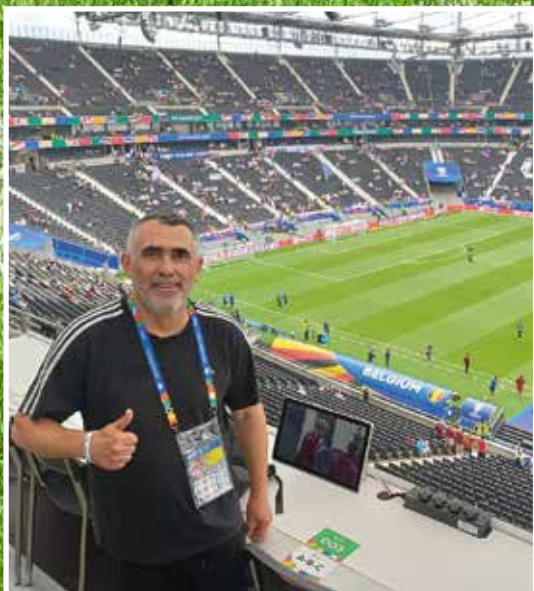
Minél tovább, annál több bürokratikus akadállyal nehezíti az UEFA az újságírók dolgát.