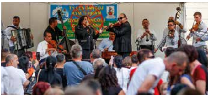
A jó hangulatról idén is neves előadók gondoskodnak

tapsolhat a közönség, de külföldi vendég is lesz. A rendezvényre kilátogató érdeklődők Tubi és barátja, Peter jóvoltából roma képzőművészek munkáit is megtekinthetik, valamint roma írók kötetéből, illetve roma tematikájú könyvekből nyílik kiállítás. A fesztiválzáró zenés buliban a Tosi Band muzsikál, és mivel lesz sok finom enni- és innivaló is, nem maradnak éhen a fesztiválozók. A rendezvény plakátját a pontos programmal lapunk hirdetési mellékletében közöljük. (s)