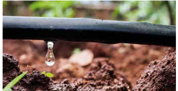
A csepegtető öntözést kora este végezzük

Tudni kell, hogy 1 mm csapadék egy négyzetméteren egyenlő egy liter vízzel. Van továbbá egy általános szabály, hogy egy milliméternyi csapadék kb. 1 cm mélyen nedvesíti be a talajt (a laza, homokos talajokat mélyebben, az agyagosakat sekélyebben). Ebből könnyű kiszámolni, hogy még a sekélyen gyökerező kultúráknál is legalább 10 mm/10l kell egy négyzetméterre ahhoz, hogy 10 centiméter mélységig legyen nedves a talaj.