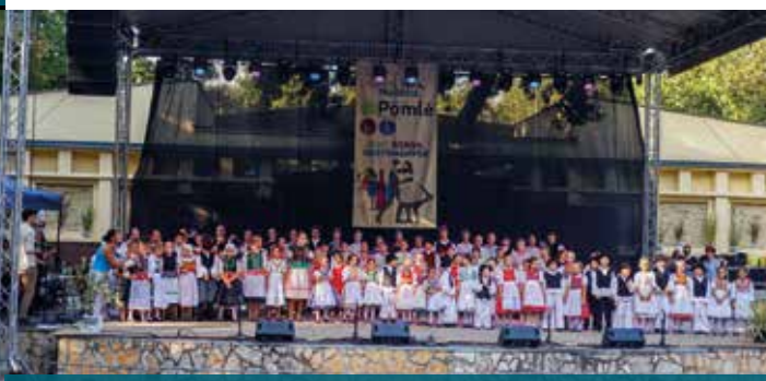
Veľká skupina mladých tanečníkov detského folklórneho galaprogramu