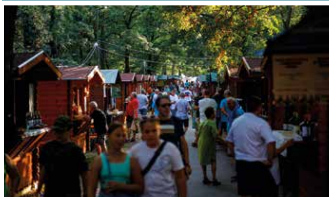
Vo Vínnej uličke bola aj tento rok veľká premávka