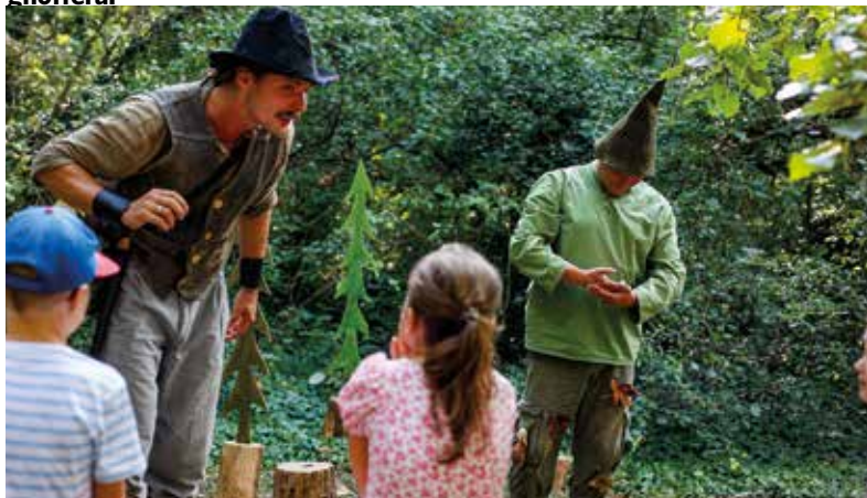
Rozprávková lúka ponúkla tým najmenším rôzne detské predstavenia

Na návštevníkov tohtoročného Festivalu Pomlé čakal už tradične bohatý kultúrny program, lahodné vína a chutné jedlá. Na podujatí pod stromami lesoparku panovala v dňoch 30-31. augusta fantastická atmosféra, ktorú si môžeme pripomenúť zábermi Mátyása Szinghoffera.