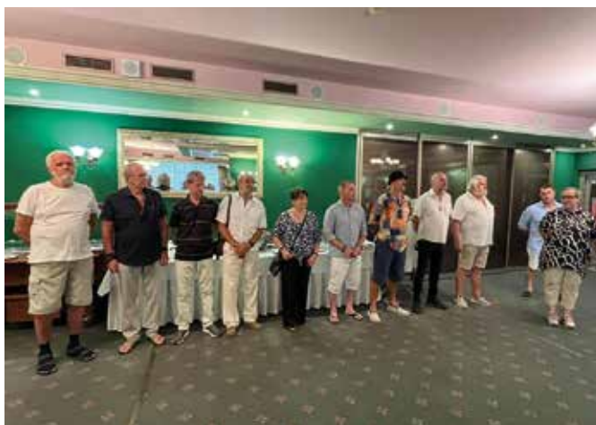
Účastníci sympózia vystavili svoje diela aj tento rok