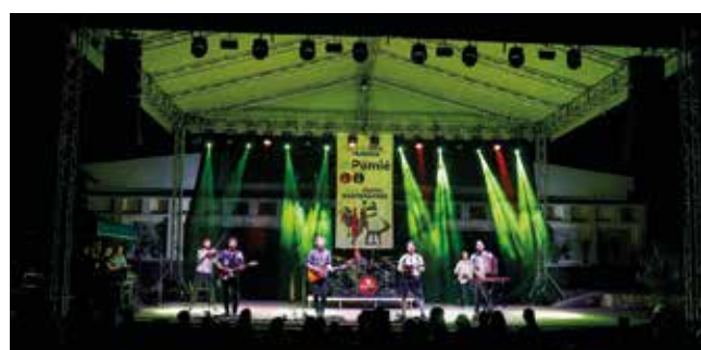
V piatok večer zabávala účastníkov skupina Aurevoir