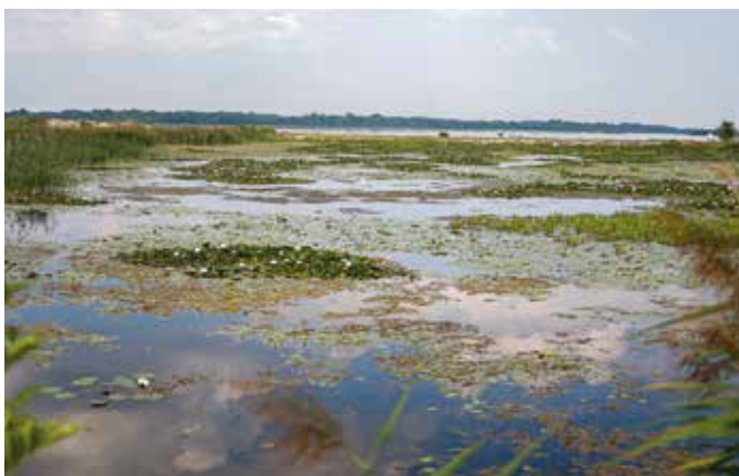
Lagúna Vtáčieho ostrova

Ďakujeme Dobrovoľnému hasičskému zboru Šamorín za ich pomoc pri príprave tejto reportáže.