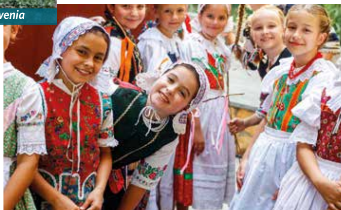
Dobrá nálada nechýbala ani za kulisami