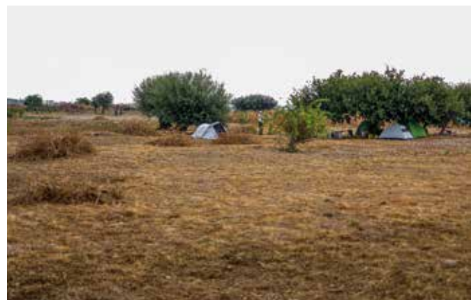
Tábor v tieni posledných zachovaných stromov