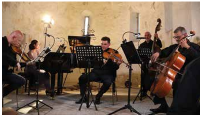
Kostol v Šámote ožil koncertom známeho festivalu