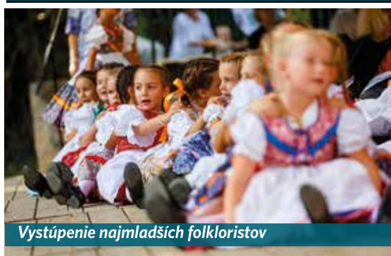
Vystúpenie najmladších folkloristov