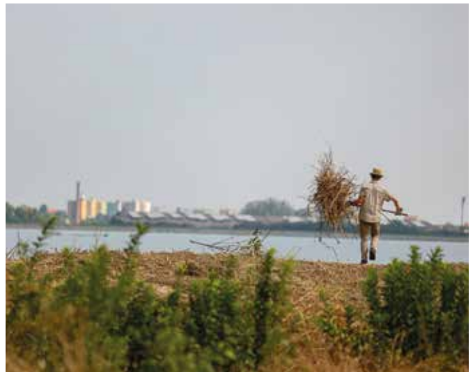
Zber suchej buriny a odstránených náletov bolo v horúčave veru poriadna drina

Nie nadarmo je Dunaj druhým najväčším veľtokom Európy, stále nám pripravuje prekvapenia. Projektantov vodného diela napríklad prekvapil veľkým množstvom sedimentov, ktoré v prírodnom kanáli každoročne ukladá. Keďže koryto je aj plavebnou dráhou, ktorú treba udržiavať, je nutné tieto sedimenty vybagrovať. A s tým obrovským