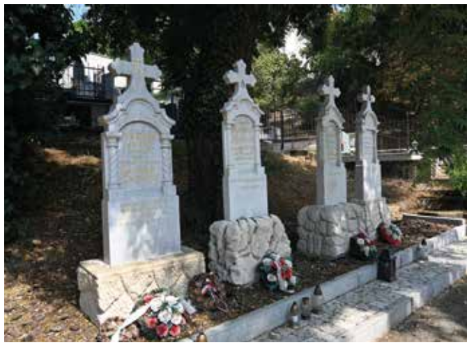
Reštaurované náhrobky rodu Kisfaludyovcov na seneckom cintoríne