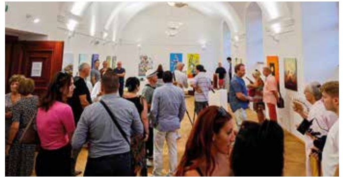
Vernisáž výstavy v sieni Korony