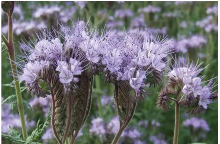
Medziplodiny zlepšujú fyzikálne vlastnosti a štruktúru pôdy

Veľa pestovateľov má v záhrade tekvice s dlhou dobou zrenia ako sú napríklad tekvice Halloween alebo tekvice maslové. Ak