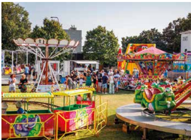
Hody v Mliečne prilákali mnoho návštevníkov

Tohtoročná cyklokampaň je dôkazom, že bicykel je ideálnym dopravným prostriedkom na prekonávanie vzdialeností, a to aj na dennej báze, do práce a domov. Ak máte možnosť, zapojte sa a presadnite na bicykel aj Vy, podporíte udržateľnú miestnu dopravu. (I)