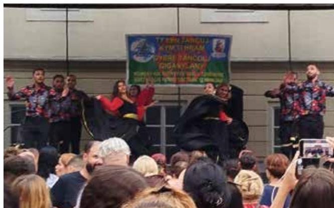
Rómsky kultúrny festival je v Šamoríne veľmi populárny