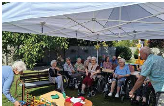
Zakúpený stan umožní seniorom tráviť viac času vonku

V Mliečne boli oslavy aj v deň sv. Štefana. Dňa 20. augusta koncertovala kapela Deja Vu na futbalovom ihrisku a deti sa zabávali na skákacom hrade. Podujatie bolo ukončené veľkolepým ohňostrojom. (s)