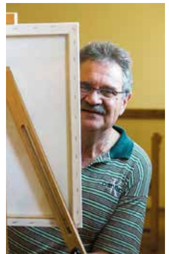
Maľovanie je jeho vášňou celý život

„Ocitol som sa tu na Žitnom ostrove, bez mojich starých priateľov a zázemia. Potreboval som zázemie, ľudí, ku ktorým by som patrila. Na moje veľké potešenie som túto skupinu umelcov našiel v združení umelcov južného Slovenska – Felvidéki Alkotók Egyesülete. Všetci sme amatéri a hrdo sa k tomu hlásime. Tvoríme, ale namiesto dokonalých techník používame srdcia, z neho čerpáme – nech si o tom umelecká obec myslí, čo chce. Po dvoch rokoch som prijal ponuku na umeleckého vedúceho skupiny FAE-ART, čo je pre mňa veľkou poctou“ – uviedol.