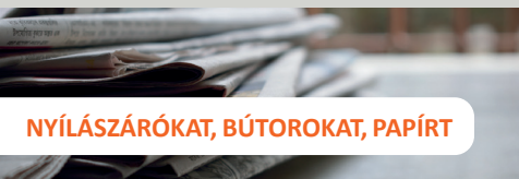
NYÍLÁSZÁRÓKAT, BÚTOROKAT, PAPIRT