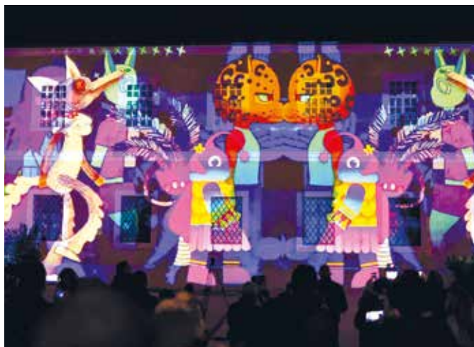
Káprázatos színek és formák a Korona falán