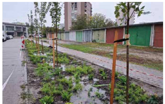
Az esőkert az esőzések után elvezeti és hasznosítja a csapadékokat

A projekt a Nadácia VÚB alapítvány támogatásának köszönhetően valósult meg. (I)