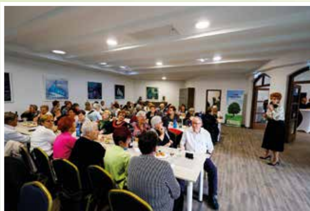
Kosáry Judit operetténekesnő remek hangulatot teremtett és táncra perdítette a közösséget.