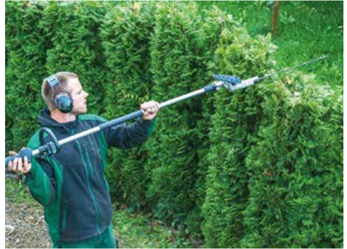
Novemberben vágjuk vissza az élő sövényt

Hagyományos őszi munka az ásás. A lényege az, hogy a talaj felső rétegét lefordítjuk. A talaj fellazul, tavaszra szétfagy, és morzsalékossá válik. Az alkalmat kihasználva istállótrágyát (napjainkban granulátumot), zöldtrágyát, komposztot, illetve csökkentett nitrogéntartalmú káliumot és foszfort tartalmazó műtrágyát juttatunk a talajba.