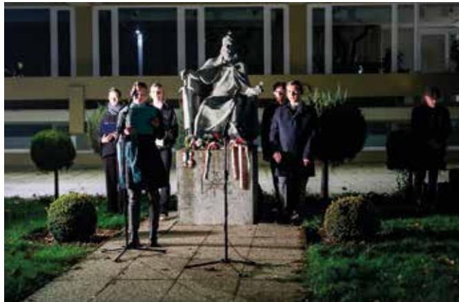
A Szent István téren a Madách Imre Gimnázium diákjai adtak műsort

„1956-ban, október 23-án egy eltiport és kegyetlenül megkínzott nemzet állt fel a padlóról, és rúgta le magát a torkán taposó szovjet csizmát. Senkit sem érdekelt a túlerő, senki sem számoltgatott vagy tervezett,