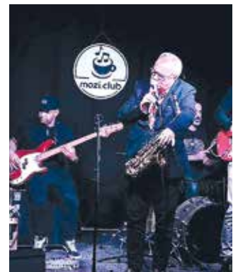
Óriási hangulatot varázsoltak a színpadra a Tudósok

definiáló zenész, író és festőművész Belgrádban folytatott művészeti tanulmányokat, majd 1991-ben Magyarországra költözött, de még az 1980-as évek derekán, Újvidéken alapított formációjával több száz koncertet adott Amerikában és Európa számos avantgárd dzsesszklubjában. A Mozi Clubban rendezett főpróbájuk humorral és öni-róniával fűszerezett, érdekes élményt nyújtó, pimaszul őszinte koncert volt. (s)