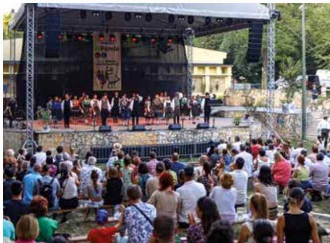
A 2024-es Pomlé Fesztivál látogatóinak száma négy és ötezer fő között mozgott.