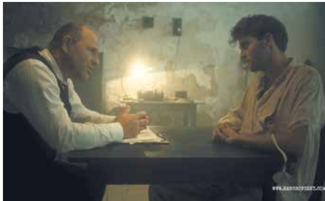
Jelenet a filmből