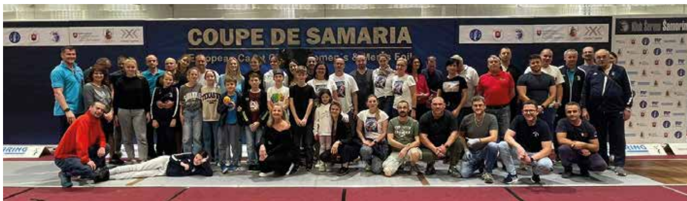
A somorjai vívók nagy családjá