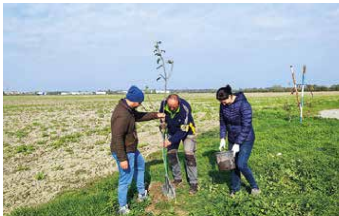
Önkéntesek pótolják a hiányzó fákat

Az önkéntesek legutóbb 50 kisebb és 47 nagyobb, két méter magas körtefát ültettek ki a fasorba, az üres helyekre, és tavasszal elvégzik az oltást. A projekt az Ekopolis Alapítvány támogatásával valósult meg. Az alapítvány képviselői is segítettek a metszésben és az ültetésben. Ez a fasor azért jelentős, mert kevés az ilyen zöld növényzet az intenzíven művelt mezőgazdasági területen, amely búvóhelyet és táplálékot nyújthat olyan állatoknak, amelyek egykor gyakoriak voltak a térségben, mára azonban megcsappant a számuk az élőhely hiánya miatt. (k)