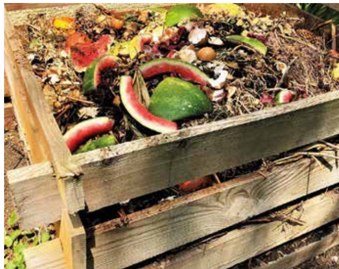
A komposztáláshoz zöld és barna hulladékokra van szükség (Képtár)

A komposztáláshoz szükségünk van zöld és barna hulladékokra. Zöld hulladék a fűnyesedék, a mag nélküli gyomnövények, a konyhai hulladék (pl. krumplicsőr, tojáshéj, kávézacc, lefőzött tealevelek) a virágszárak és zöld levelek. A trópusi gyümölcsök héját ne tegyük a komposztba, mert azok az erjedésgátlóval kezelik,